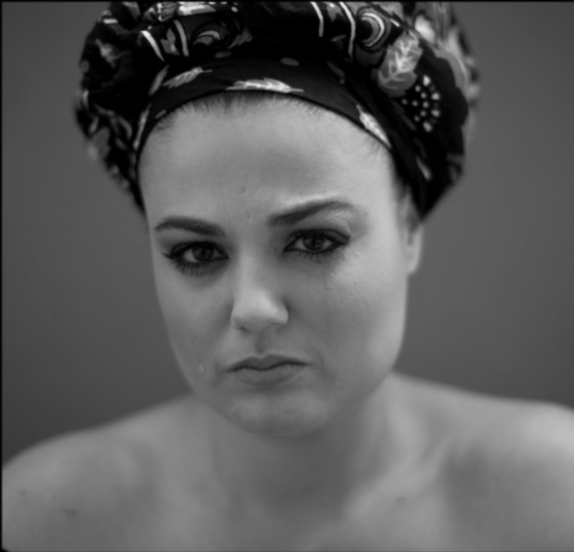
Sadahzinia - singer, writer