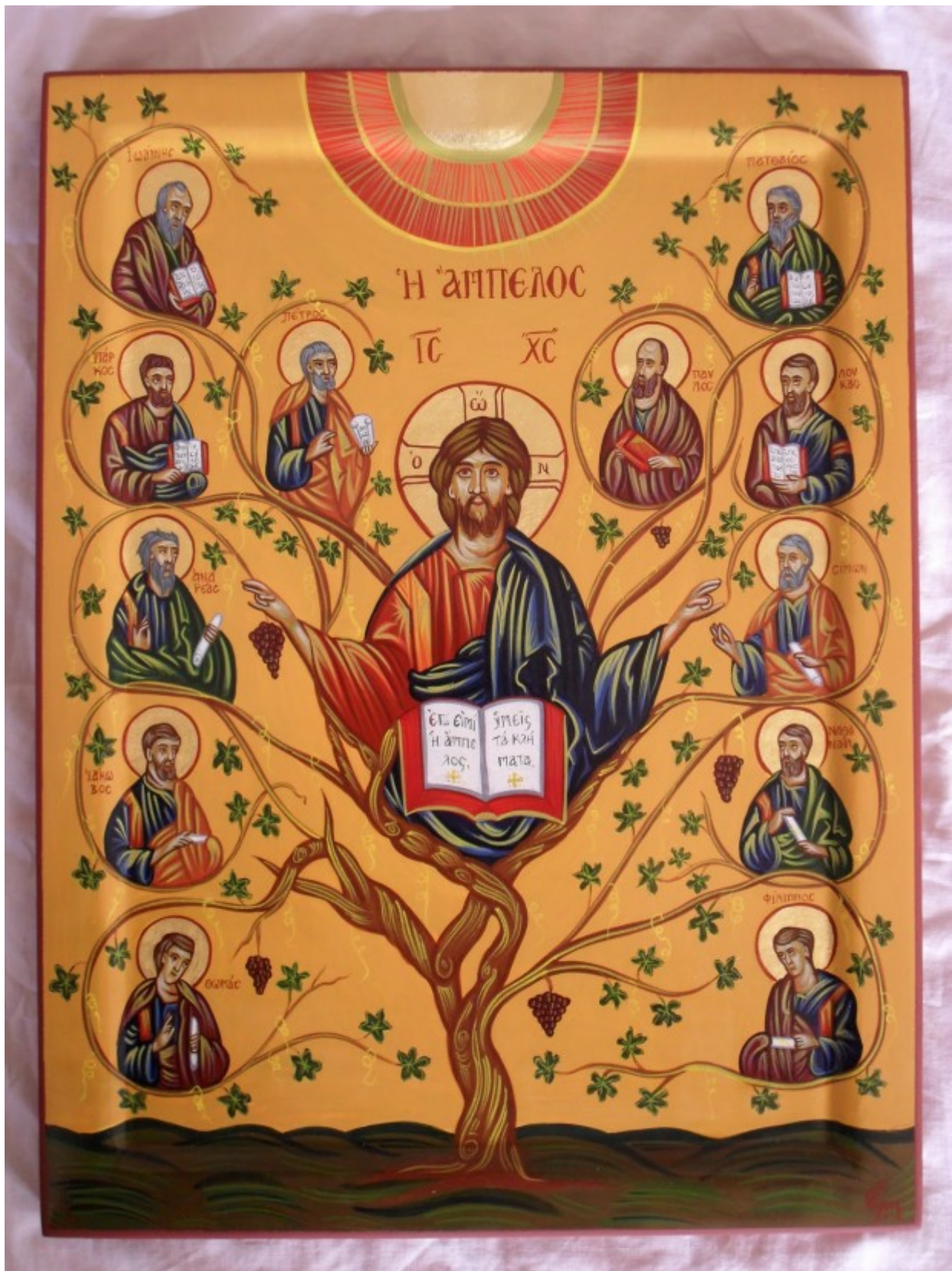
Οι Άγιοι Δώδεκα Απόστολοι