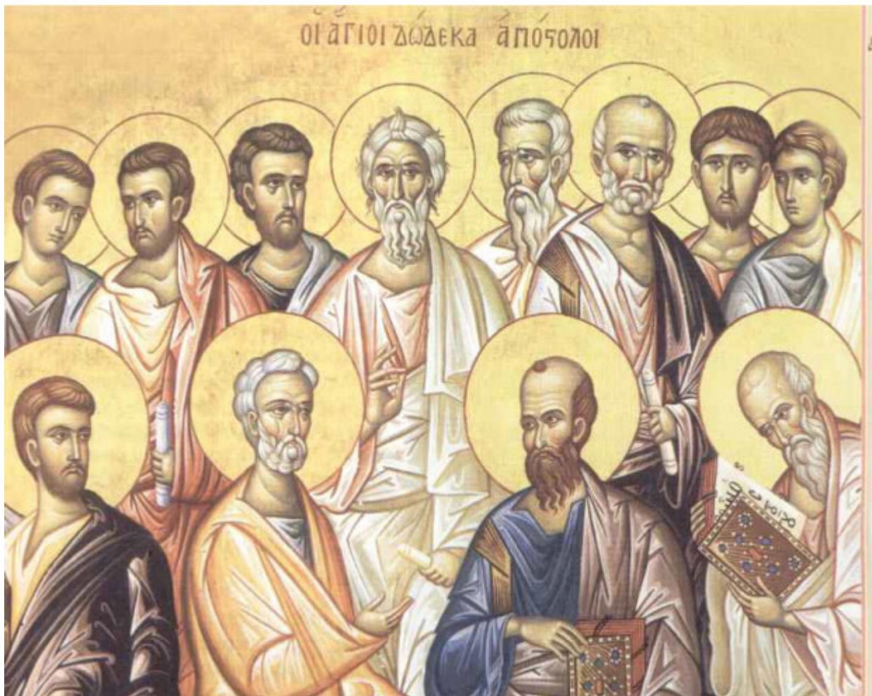
Οι Ἅγιοι Δώδεκα Ἀπόστολοι