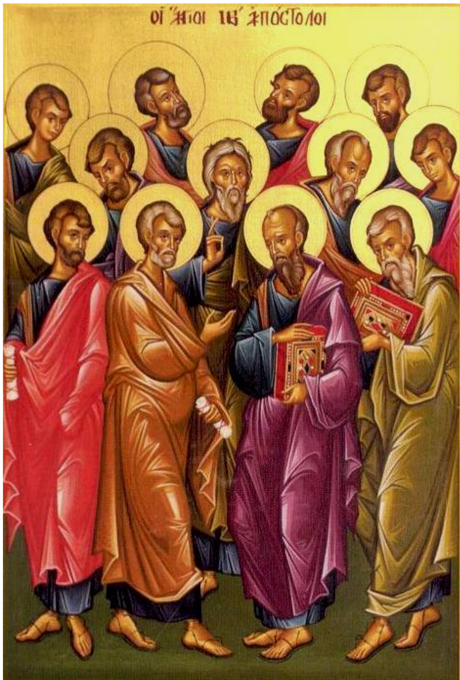
Οι Ἅγιοι Δώδεκα Ἀπόστολοι