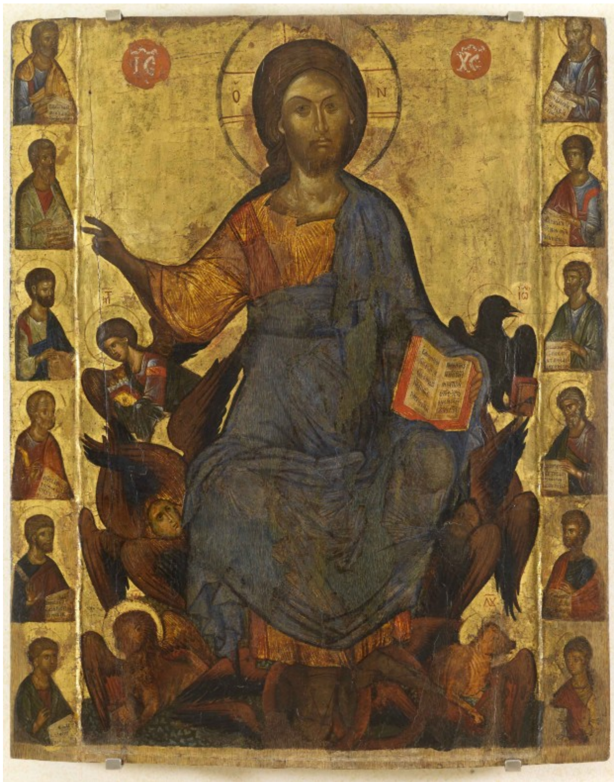
Ο Χριστός εν δόξη και οι δώδεκα Απόστολοι - άγνωστος ζωγράφος από την Κωνσταντινούπολη, μέσα 14ου αιώνα μ.Χ.