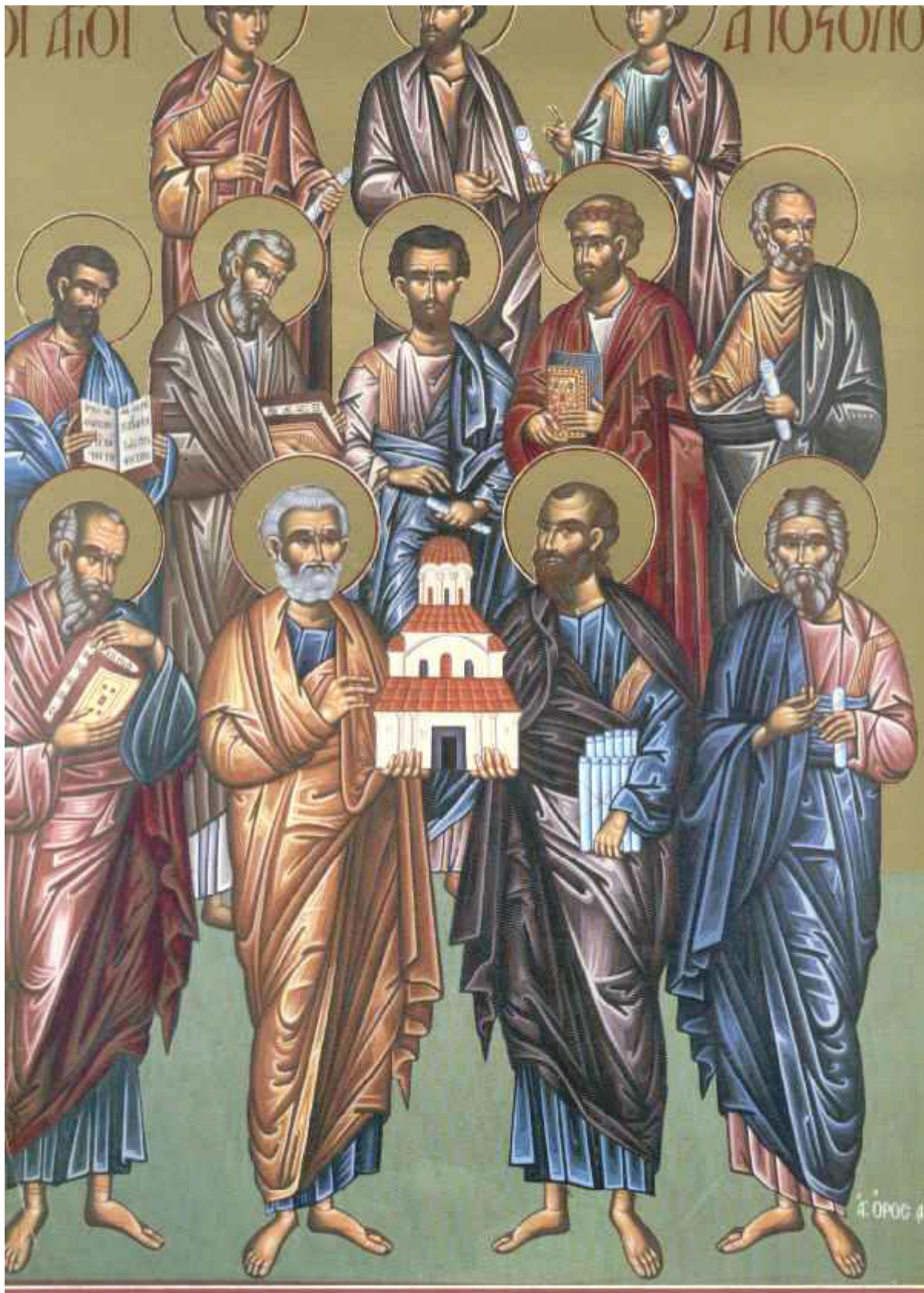
Οι Άγιοι Δώδεκα Απόστολοι