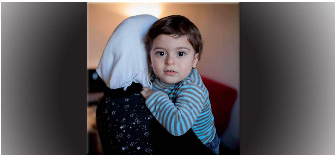
Αυτό το δίχρονο παιδάκι από τη Συρία, πέρασε με την οικογένειά του τα σύνορα και βρέθηκε στην Τουρκία αναζητώντας καταφύγιο.

Η Υπάτη Αρμοστεία του ΟΗΕ για τους Πρόσφυγες (Υ.Α.) δημοσίευσε σήμερα έκθεση για τον αριθμό των προσφύγων, των αιτούντων άσυλο και των εσωτερικά εκτοπισμένων σε όλο τον κόσμο, αριθμός ο οποίος ξεπέρασε τα 50 εκατομμύρια, για πρώτη φορά μετά τον Δεύτερο Παγκόσμιο Πόλεμο.