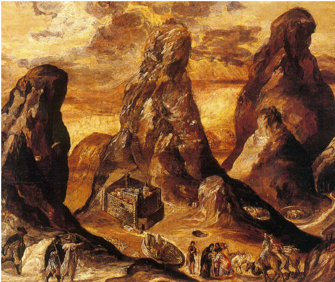
Δομίνικος Θεοτοκόπουλος, Αποψη του Όρους της Μονής Σνά , περίπου 1750, Τέμπερα και Λάδι

Αφιερωμένο στον Ελ Γκρέκο είναι το έτος που διανύουμε και πολιτιστικοί φορείς και μουσεία της χώρας, οργανώνουν μια σειρά από εκθέσεις. Πρώτη έκθεση αυτή, του Ιστορικού Μουσείου Κρήτης καθώς και ένα συνέδριο που αναφέρεται στη ζωγραφική παραγωγή του Δομίνικου Θεοτοκόπουλου, στον τόπο της καταγωγής του, την Κρήτη. Όπως σημειώνει ο Ακαδημαϊκός Μανόλης Χατζηδάκης, στο αφιέρωμα στον Ελ Γκρέκο, που πραγματοποίησε η Εφημερίδα Καθημερινή («7 Ημέρες», της 8-10-1995), «οι βάσεις της ανθρωπιστικής παιδείας και της βυζαντινής αισθητικής θα μείνουν στέρεα θεμέλια για όλη του τη ζωή και θα τον ξεχωρίζουν πάντα από τους καλλιτέχνες της Δυτικής Ευρώπης».