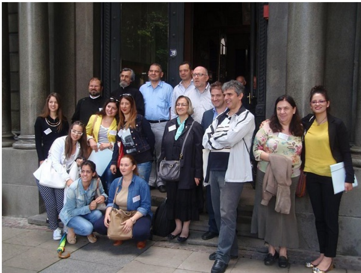
Τμήμα των Εισηγητών μπροστά στην είσοδο της Θεολογικής Σχολής

Οι Εισηγήσεις που παρουσιάστηκαν κατά τις Συνεδρίες περιλάμβαναν πλήθος ενδιαφερόντων θεμάτων, όπως οι Σύγχρονες Προκλήσεις για την Ορθόδοξη Εκπαίδευση, η Διδασκαλία για την Παναγία και την Ορθόδοξη χριστιανική θρησκεία στο Νηπιαγωγείο, εφαρμογές των σύγχρονων τεχνολογιών για το Μάθημα των Θρησκευτικών και για την εκκλησιαστική/ενοριακή εκπαίδευση, ένταξη Μαθησιακών Αντικειμένων σε εκπαιδευτικά σενάρια για τη Θρησκευτική Εκπαίδευση, ΑμΕΑ και Θρησκευτική Εκπαίδευση, η Βιωματική Εκπαίδευση, η Θρησκευτική εκπαίδευση στη σύγχρονη πλουραλιστική κοινωνία, η Παιδαγωγική των Νηπτικών Πατέρων, η Θρησκευτική εκπαίδευση στην Αφρική, Θρησκευτική Εκπαίδευση και Παράδοση, η συνεργασία μεταξύ θεολόγων και ιερέων, η Ιστορία των Θρησκειών.