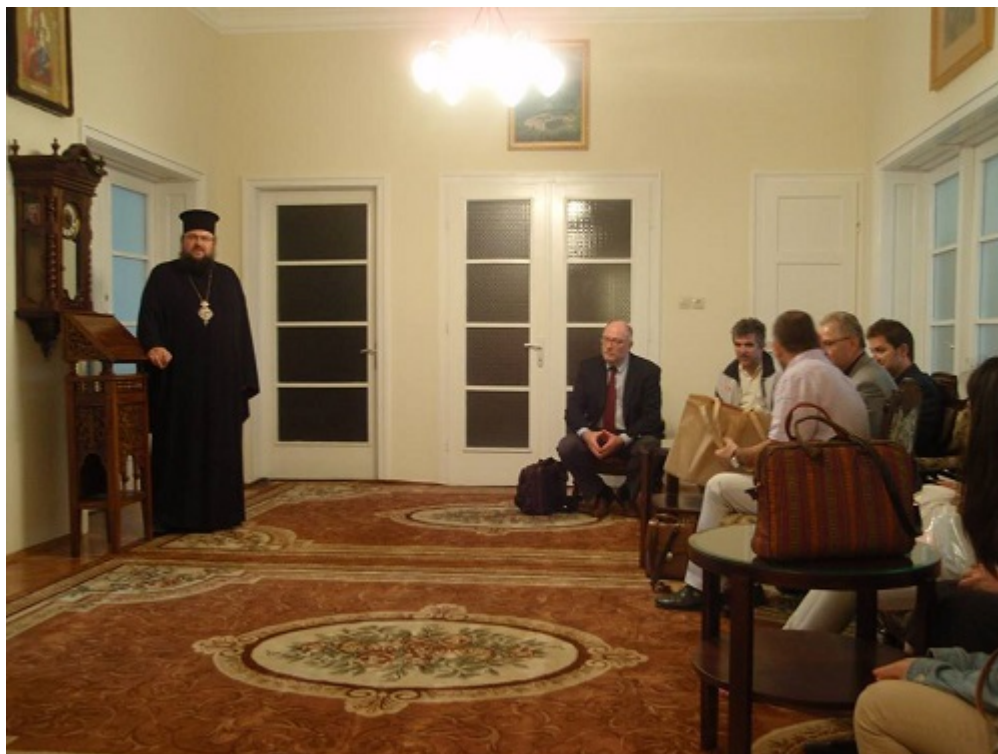
Από την επίσκεψη στο Πατριαρχείο Βουλγαρίας