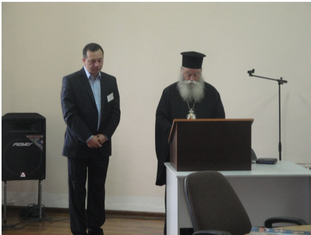
Απόσπασμα από την έναρξη των εργασιών

Αναπτύχθηκαν επίσης και πολλές διερευνητικές διδακτικές προσεγγίσεις καθώς και προτάσεις μαθήματος για μια ποικιλία θεμάτων, όπως: η θέση της γυναίκας στην Ορθόδοξη Εκκλησία, ο άνθρωπος, ως συνεργάτης του Θεού, το θαύμα της Κανά, η Παραβολή του Σπορέα, η διδασκαλία για τους Αγίους, η χρήση των Παροιμιών. Τόσο κατά τη διάρκεια των εισηγήσεων όσο και κατά τις συζητήσεις που τις ακολουθούσαν, έγινε ανταλλαγή των εμπειριών από τις περιστάσεις που επικρατούν σε κάθε χώρα σχετικά με τη Θρησκευτική Εκπαίδευση.