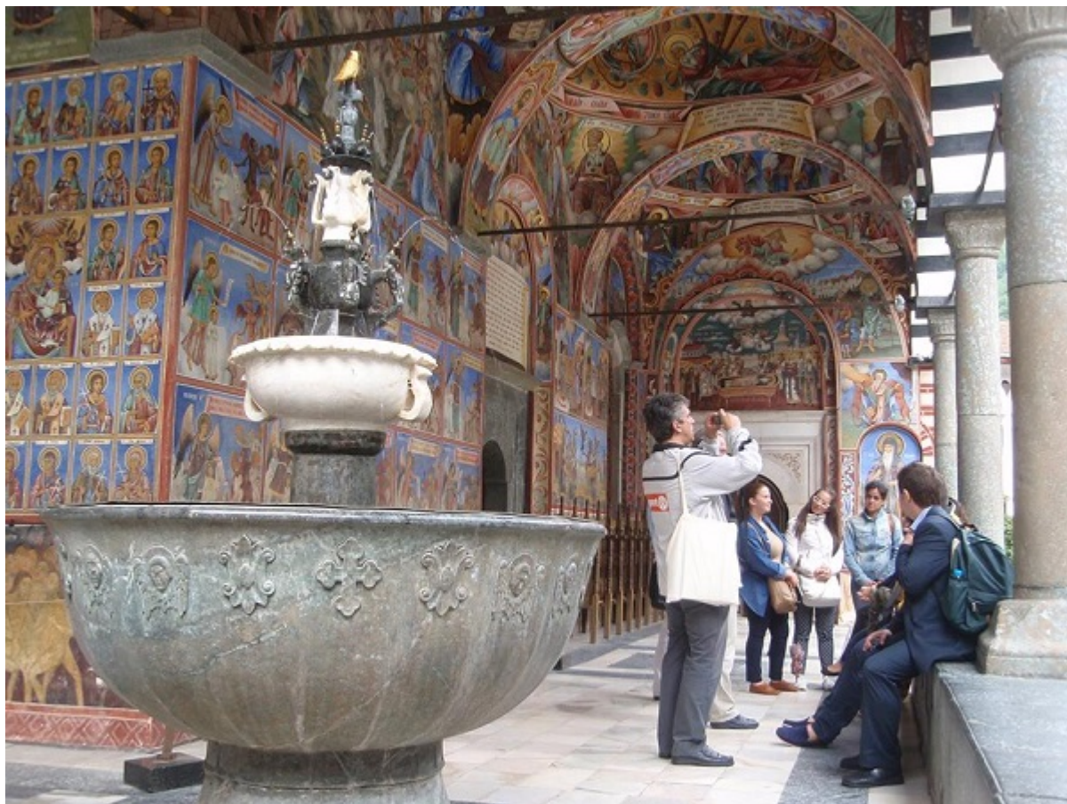
Το συντριβάνι στον περίβολο του Καθολικού στη Ρίλα