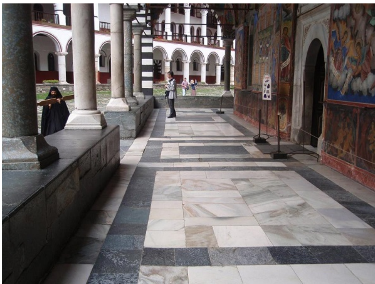
Το τάλαντο χτυπά για τον Εσπερινό στη Ρίλα