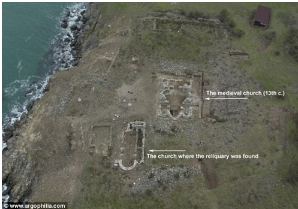
Ερείπια Ναού του Τιμίου Προδρόμου

Θα πρέπει να είμαστε προσεκτικοί, ώστε η όποια εξέταση και έρευνα γίνεται σε ιερά λείψανα να μην προκαλεί σύγχυση στο πλήρωμα της Εκκλησίας. Και να μην εισάγει έμμεσα την αμφισβήτηση της αυθεντικότητας όλων των κειμηλίων, αλλά και της Παράδοσης που, μέσα από τους αιώνες, μας παρέδωσε ως αυθεντικά αυτά τα κειμήλια. Άλλωστε, όπως πολύ ορθά έχει τονιστεί, « Abusus non tollit usum »· η κατάχρηση και η παράχρηση δεν αίρει, δεν καταργεί τη χρήση [64]. Και είναι γνωστό πως η εξαίρεση δεν καταργεί αλλά επιβεβαιώνει τον κανόνα. Ας προβάλλουμε, λοιπόν, τον κανόνα της αυθεντικότητας των ιερών κειμηλίων, ας τον υπενθυμίζουμε σε κάθε ευκαιρία, ας τον διακηρύττουμε urbi et orbi .