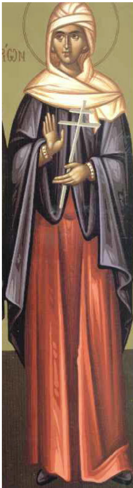
Αγία Βερονίκη η αιμορροούσα