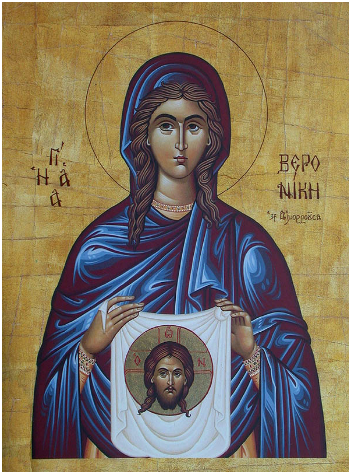
Αγία Βερονίκη η αιμορροούσα