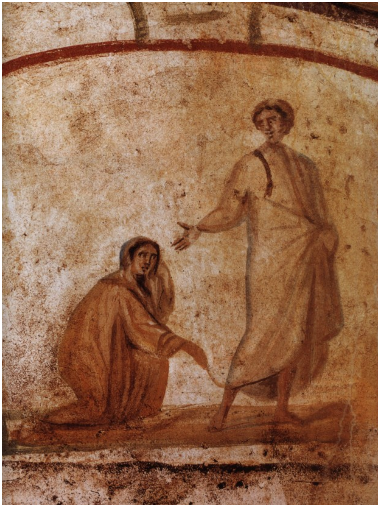
Η Θεραπεία της Αιμορροούσας, τοιχογραφία από την Κατακόμβη των Μαρκελλίνου και Πέτρου, αρχές 4ου αι. μ.Χ.