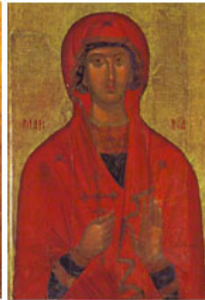
ΑΓΙΑ ΜΑΡΙΝΑ 17 Ιουλίου