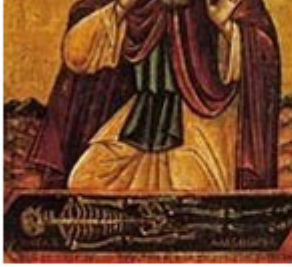
ΑΓΙΟΣ ΣΙΣΙΝΗΣ 6 Ιουλίου