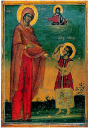
ΑΓ. ΚΗΡΥΚΟΣ & ΙΟΥΛΙΤΑ 15 Ιουλίου