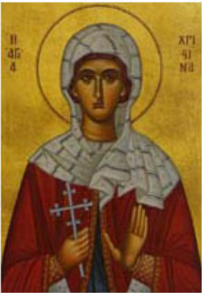
ΑΓΙΑ ΧΡΙΣΤΙΝΑ 24 Ιουλίου