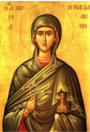
ΑΓ. ΜΑΡΙΑ ΜΑΓΔΑΛΗΝΗ 22 Ιουλίου