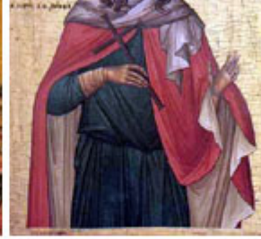
ΑΓΙΑ ΚΥΡΙΑΚΗ 7 Ιουλίου