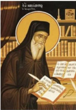
ΑΓ. ΝΙΚΟΔΗΜΟΣ ΑΓΙΟΡΕΙΤΗΣ 14 Ιουλίου