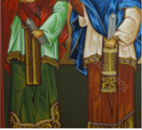
ΑΓ. ΚΟΣΜΑΣ & ΔΑΜΙΑΝΟΣ 1 Ιουλίου