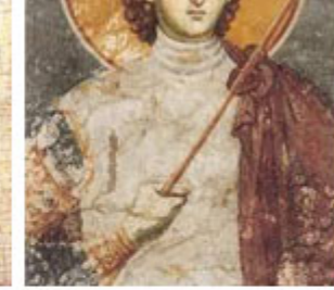
ΑΓΙΟΣ ΠΡΟΚΟΠΙΟΣ 8 Ιουλίου