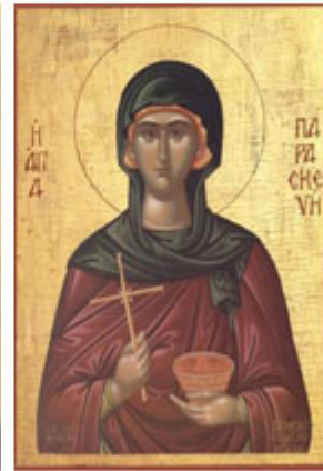
ΑΓΙΑ ΠΑΡΑΣΚΕΥΗ 26 Ιουλίου