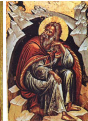
ΠΡΟΦΗΤΗΣ ΗΛΙΑΣ 20 Ιουλίου