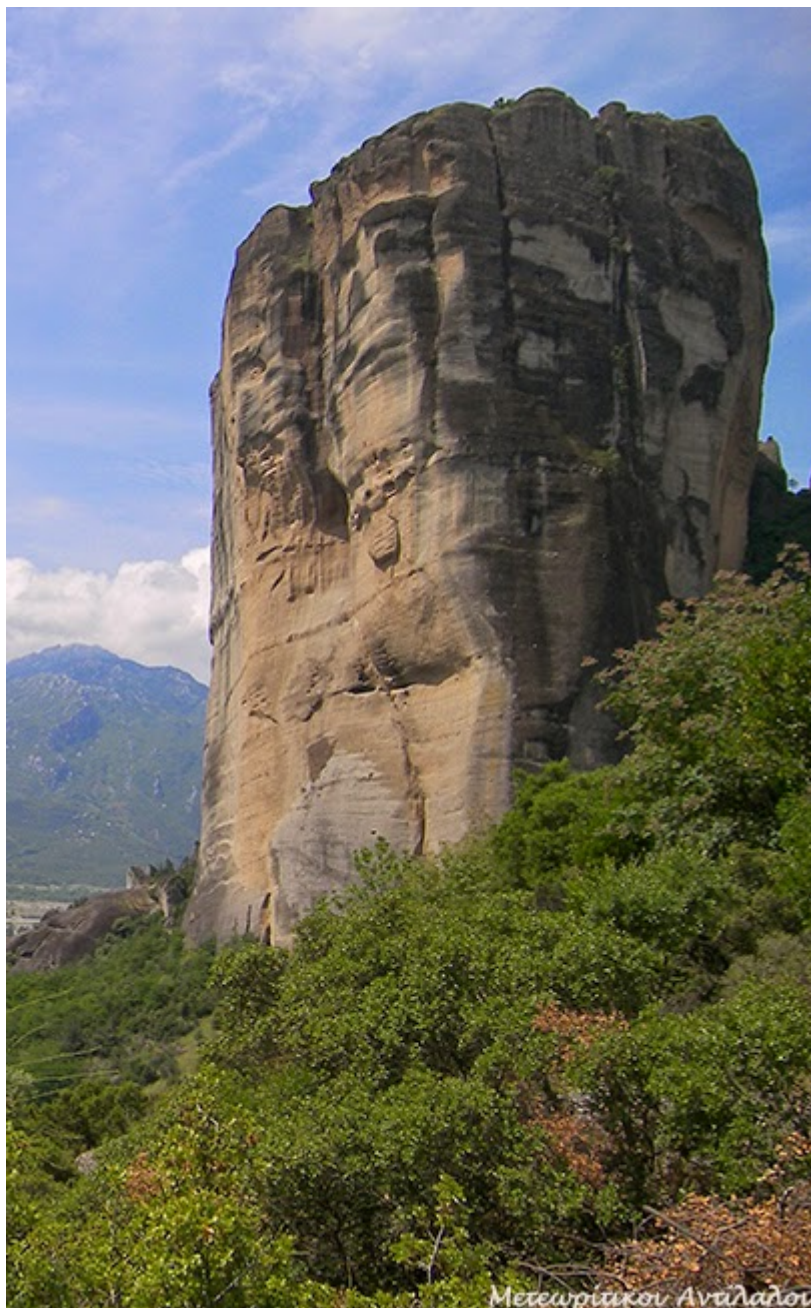
Ιερά Μονή Προσκυήσεως της Αλύσεως του Αποστόλου Πέτρου

«Ο Άλυσος είναι ένας γιγάντιος Βράχος που βρίσκεται βόρεια της Καλαμπάκας, νοτιοδυτικά της Αγίας Τριάδος και χωρίζει βορειοδυτικά με ένα φαράγγι βάθους 110 μέτρων από τον βράχο του Αγίου Μοδέστου (κοινώς Μόδι).