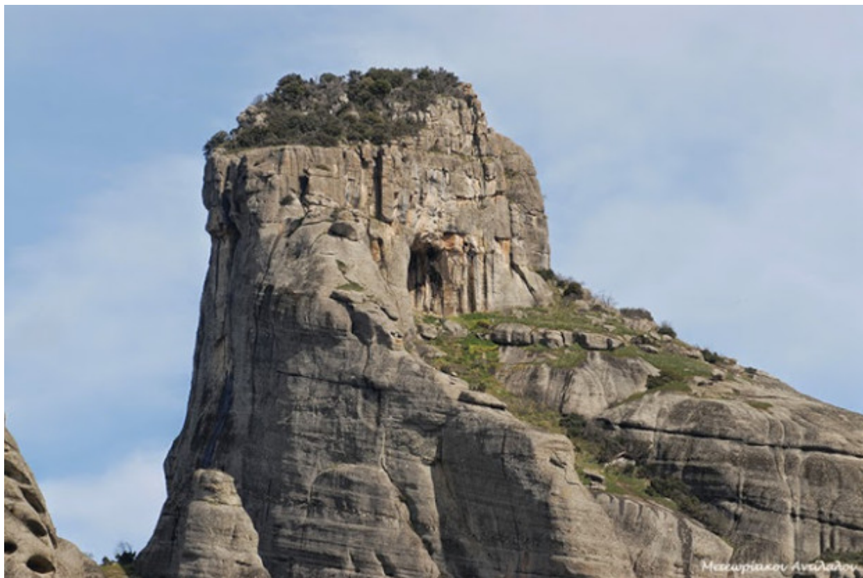
Ιερά Μονή Αγίων Αποστόλων (Αϊά)

«Βορειοδυτικά της Καλαμπάκας υψώνεται ένας πανύψηλος και πελώριος βράχος, λίαν δυσπρόσιτος, καλούμενος επιτοπίως Αγιά (Αϊά). Η ψηλότερη κορυφή του έχει ύψος 630 μέτρα.