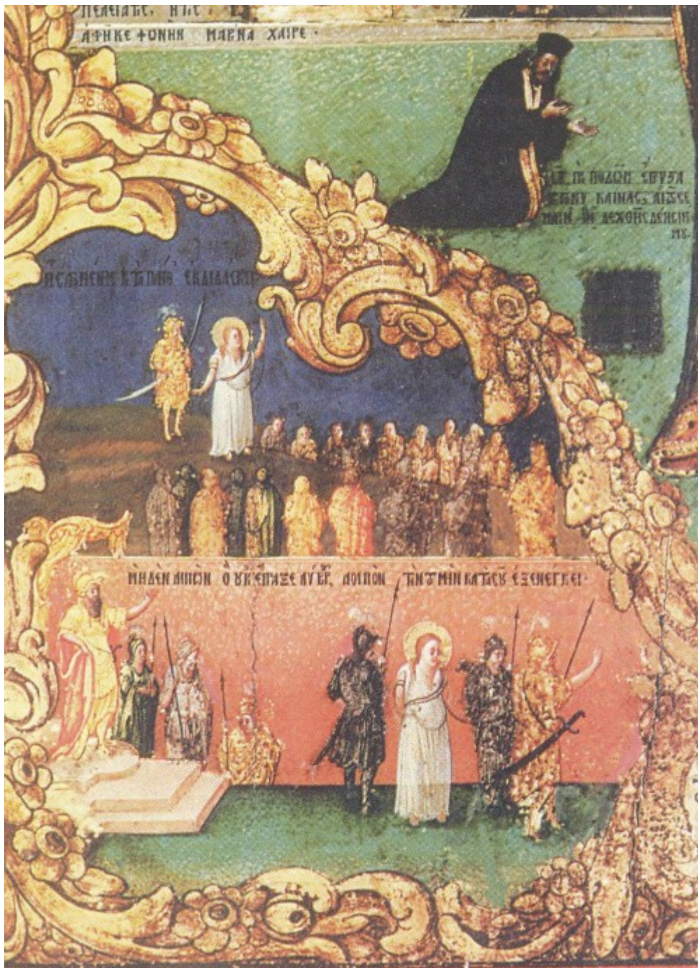
Σκηνές από το βίο και το μαρτύριο της Αγίας Μαρίας