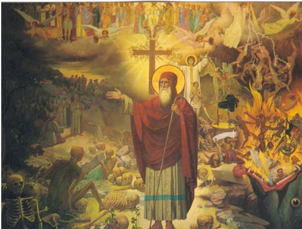
Το Ὁραμα του Προφήτη Ἰεζεκιήλ