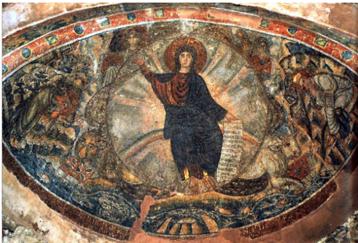
Το Όραμα του Προφήτη Ιεζεκιήλ, ψηφιδωτό στον Όσιο Δαβίδ της Θεσσαλονίκης, β΄ μισό 5ου αι. μ.Χ. – Το ψηφιδωτό απεικονίζει το όραμα του Ιεζεκιήλ, με το Χριστό Εμμανουήλ (νεαρό) στο κέντρο να κάθετα σε πολύχρωμο τόξο. Γύρω του εικονίζονται τα σύμβολα των τεσσάρων Ευαγγελιστών και στην αριστερή γωνία ο προφήτης Ιεζεκιήλ στις όχθες του ποταμού Χοβάρ και στη δεξιά ο προφήτης Αββακούμ ή ο Ησαΐας.