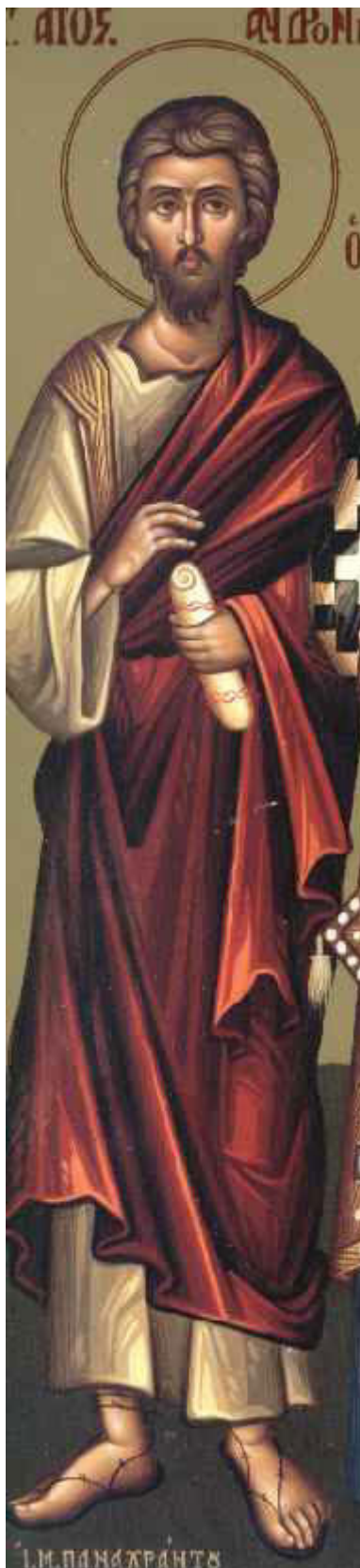
Άγιος Ανδρόνικος ο Απόστολος