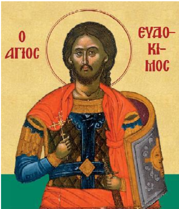
Όσιος Ευδόκιμος ο Δίκαιος