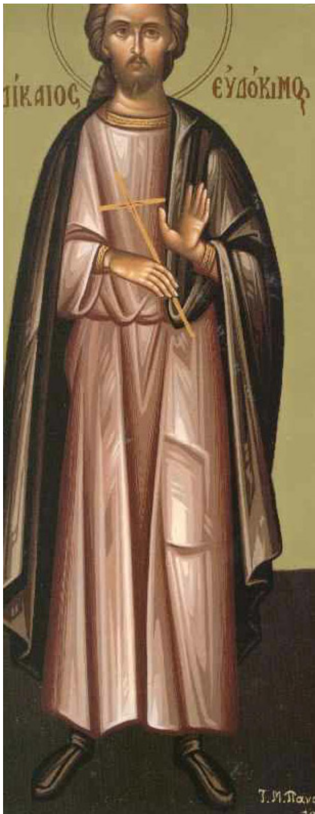
Όσιος Ευδόκιμος ο Δίκαιος