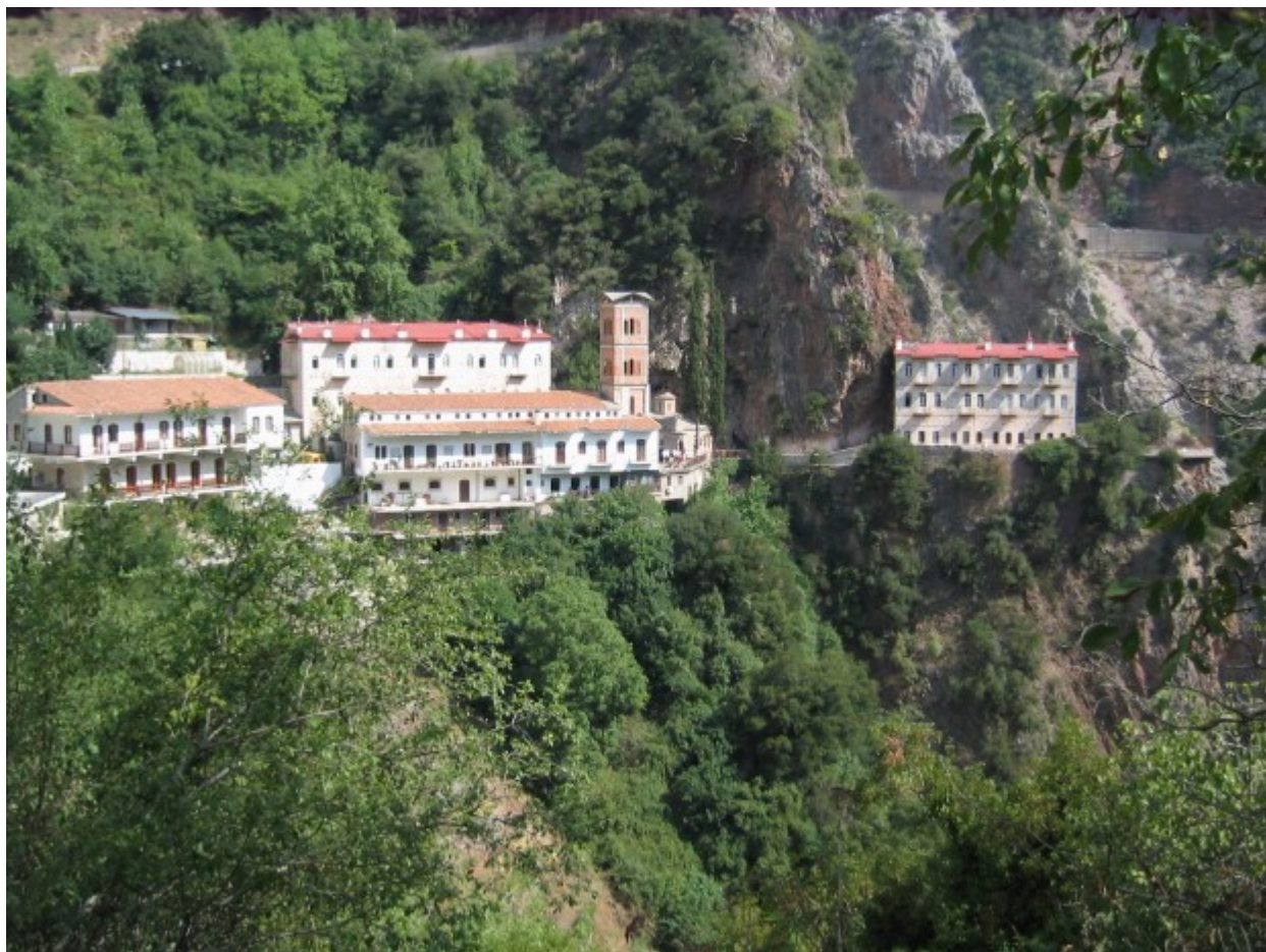
Ιερά Μονή Παναγίας Προσιώτισσας