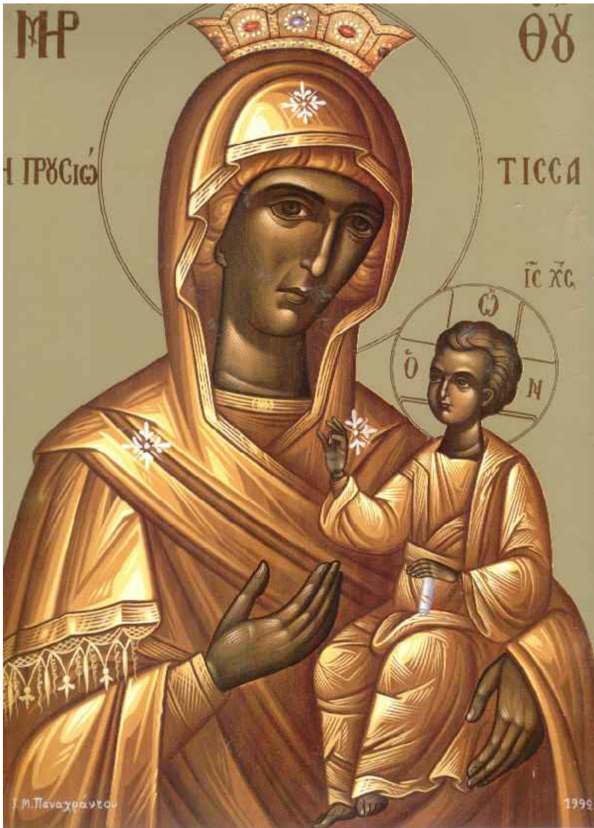
Παναγία η Προυσιώτισσα

Εορτάζει στις 23 Αυγούστου εκάστου έτους.