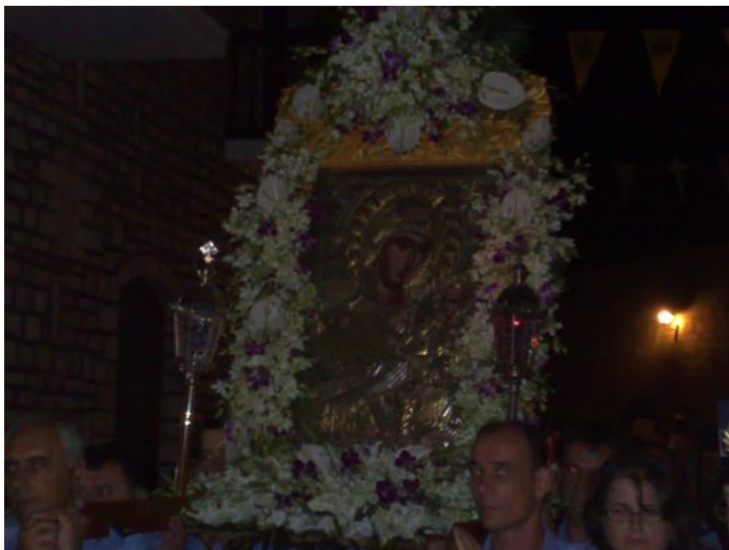
Παναγιά η Προυσιώτισσα