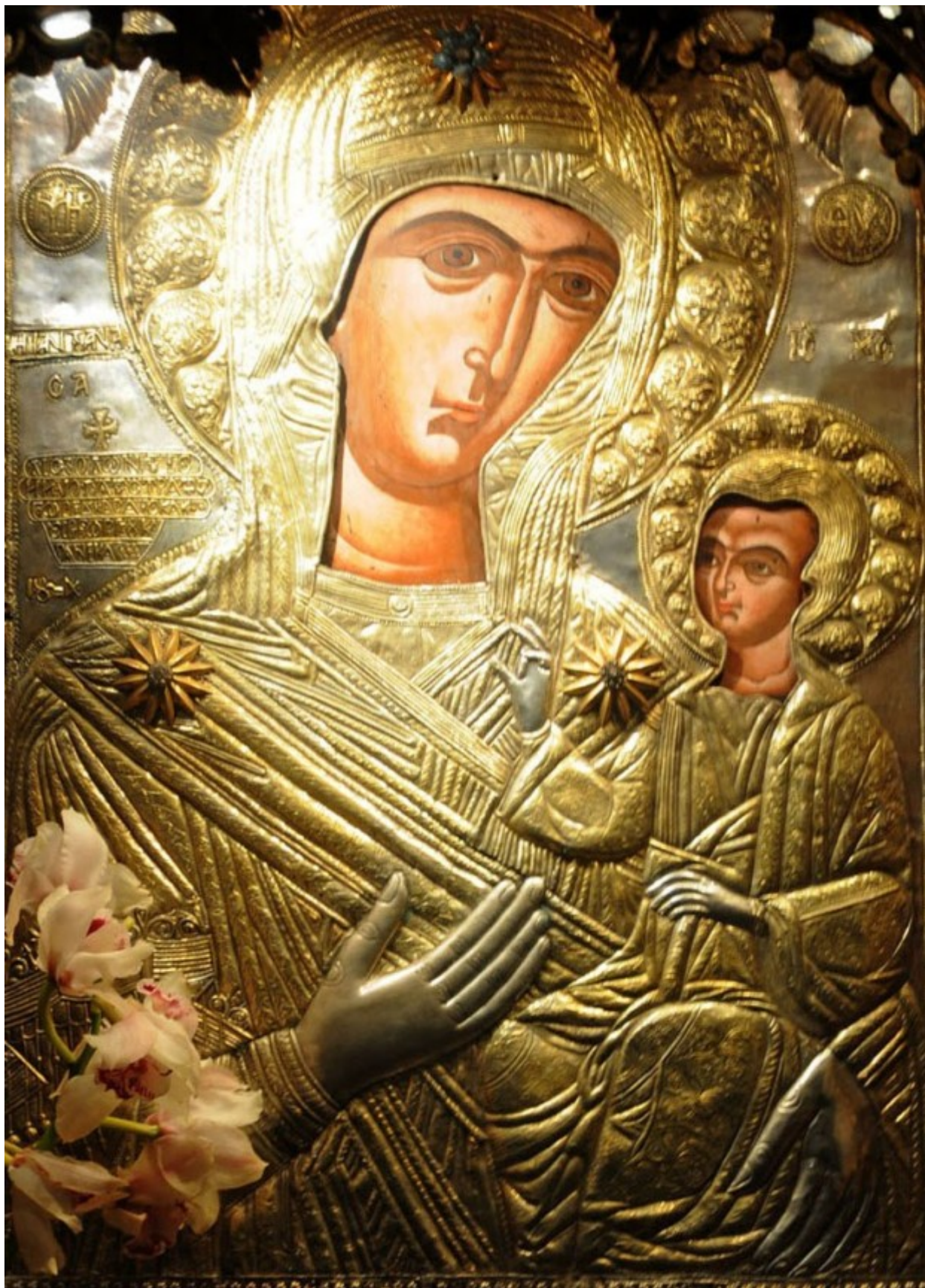
Παναγία η Προυσιώτισσα