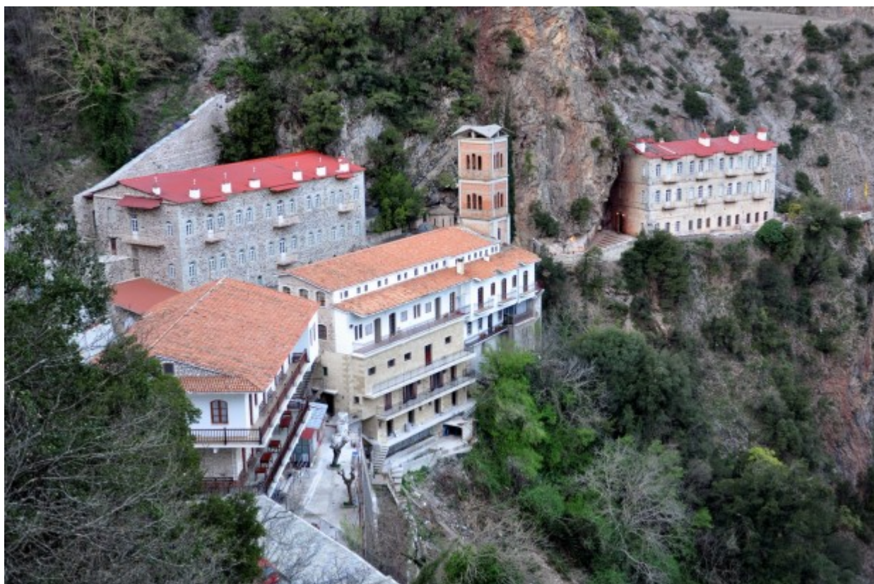
Ιερά Μονή Παναγιάς Προυσιώτισσας