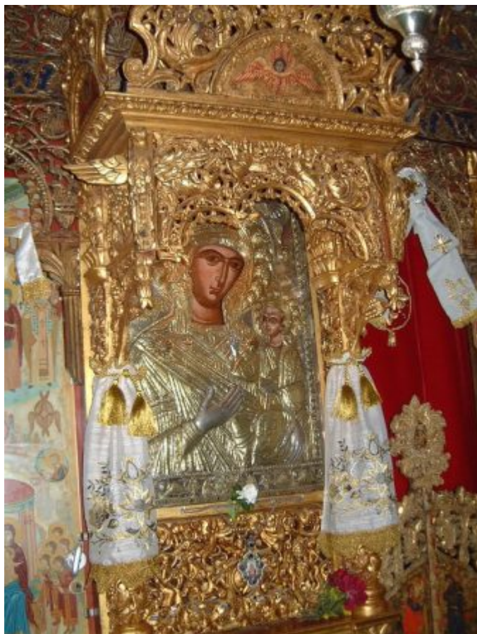
Παναγιά η Προυσιώτισσα