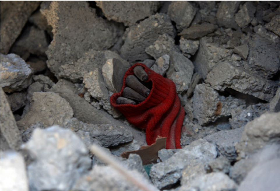
Παιδια θαμένα στα συντρίμια Gaza Jan 21, 2009.