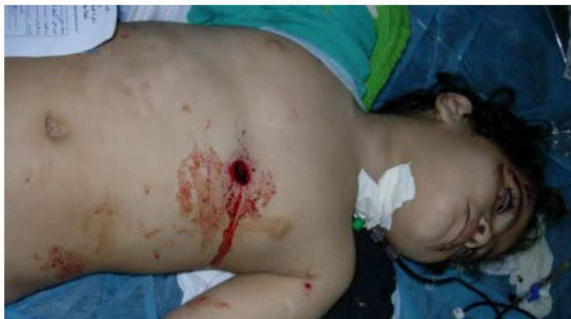
Χτυπημένα απο σφαίρες ελεύθερων σκοπευτών