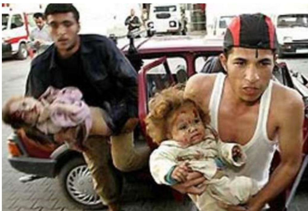
Παιδιά μεταφέρονται στα νοσοκομεία μετα τις επιθέσεις με λευκό φώσφορο- Gaza Cast Lead 2008-2009