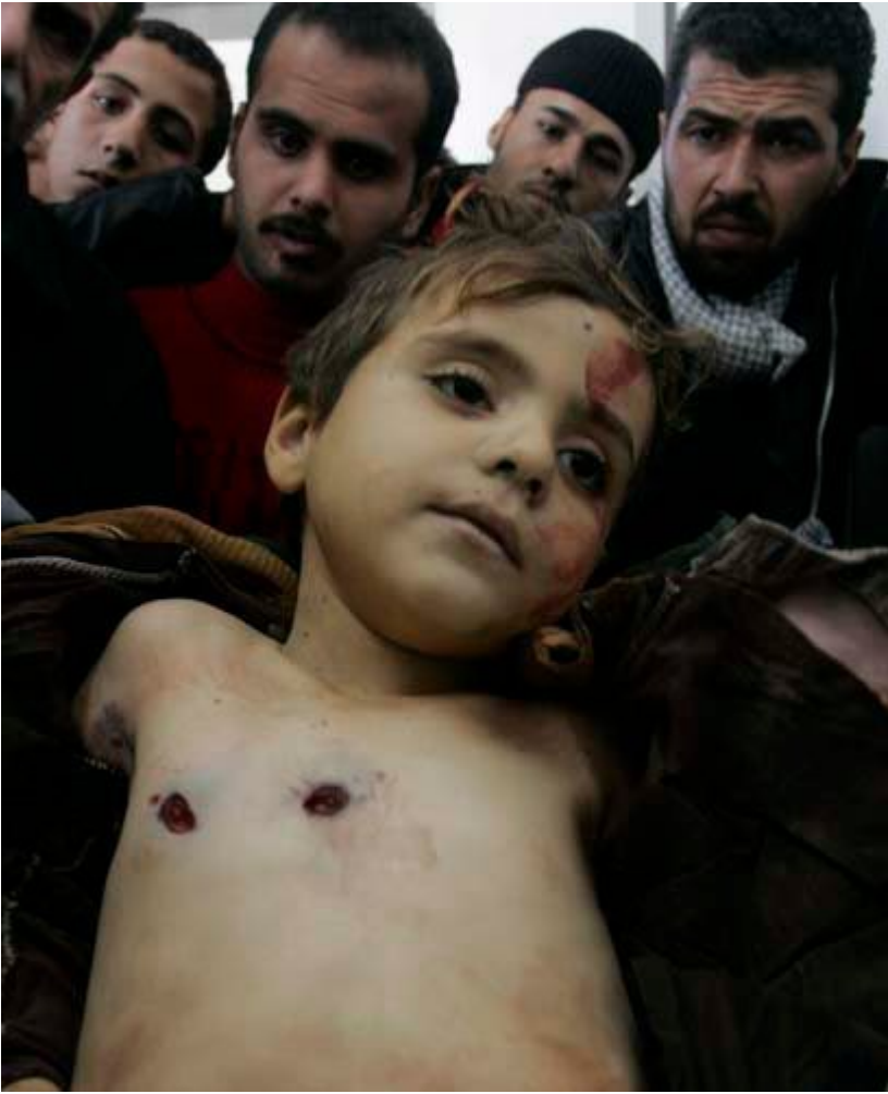
Χτυπημένα απο σφαίρες ελεύθερων σκοπευτών