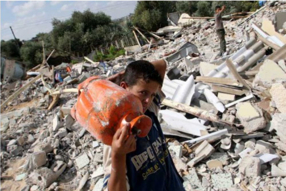
Παιδί κουβαλάει νερό σε στρατόπεδο προσφύγων. Οι ελλείψεις στο πόσιμο νερό στη Γάζα προειδοποιούν οι διεθνείς οργανισμοί έχουν φτάσει σε επικίνδυνο σημείο.