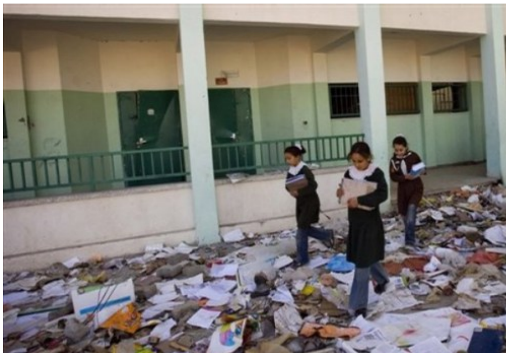
Ό,τι απέμεινε από το σχολείο μετά απο βομβαρδισμό