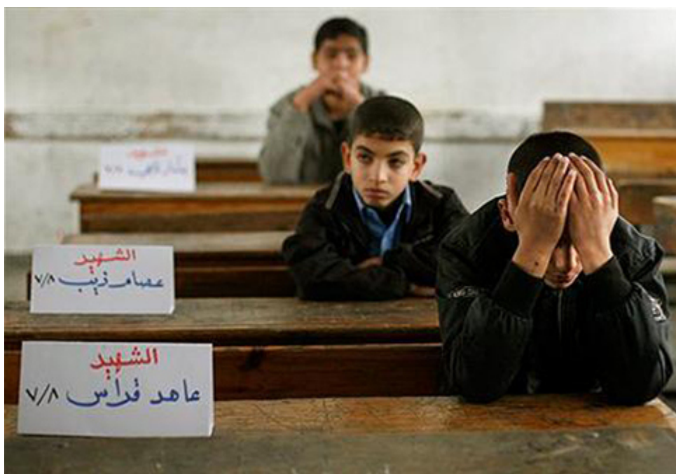
Όνόματα παιδιών που σκοτώθηκαν σε τάξη σχολείου στη Γάζα