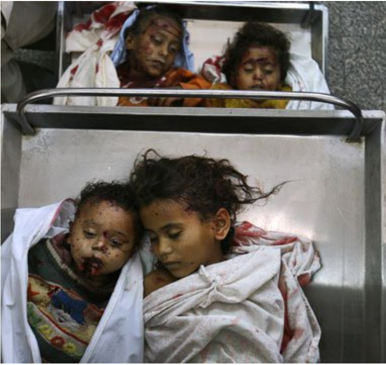
Brothers and sisters, little children, slaughtered by Israel. Gaza, Cast Lead offensive 2008-2009