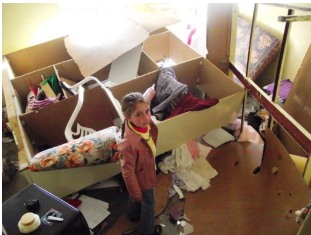
Τα σπίτια τους μετα απο βομβαρδισμό