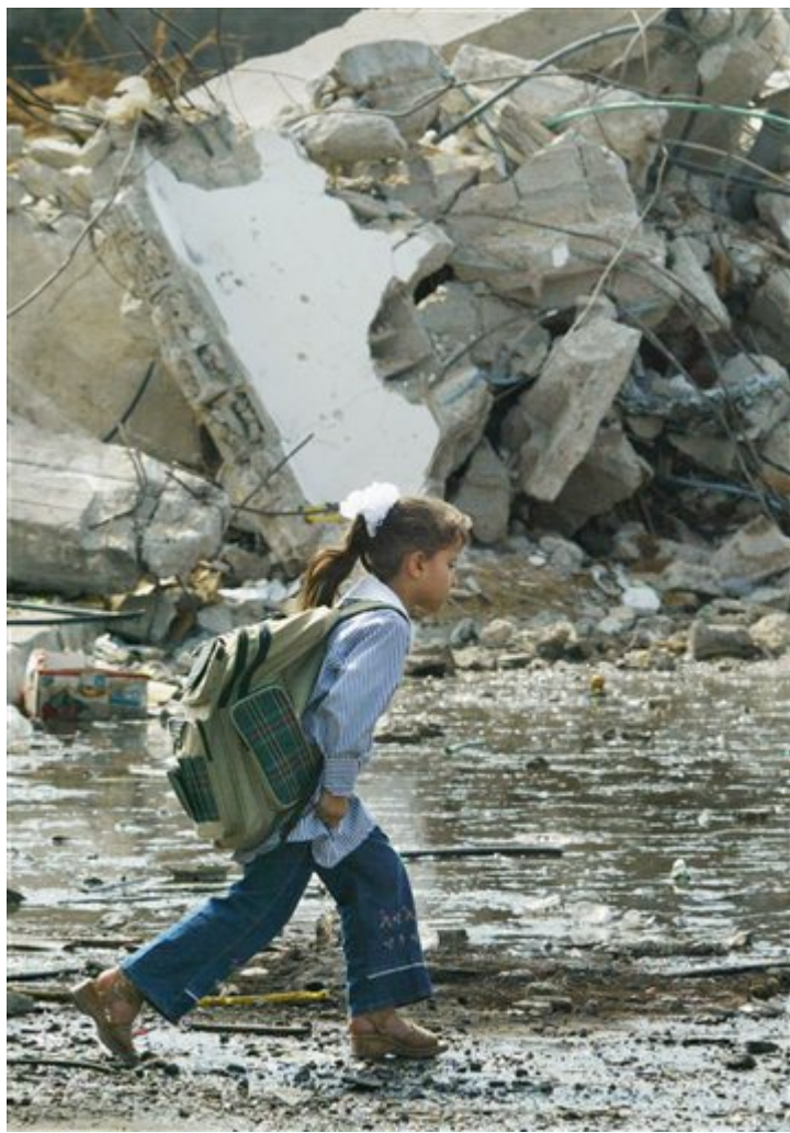
Ενα Παλαιστίνιο κορίτσι περπατά μέσα στα χαλάσματα για να φτάσει στο σχολείο