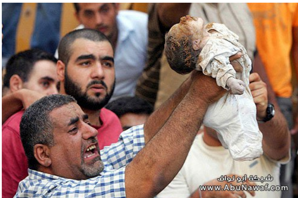
Νεογεννητο μωρο θυμα βομβαρδισμού