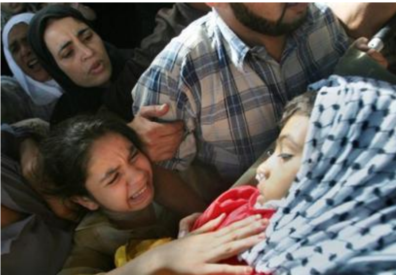
Τα παιδιά αποτελούν το μεγαλύτερο μέρος των αμάχων που σκοτώνονται.