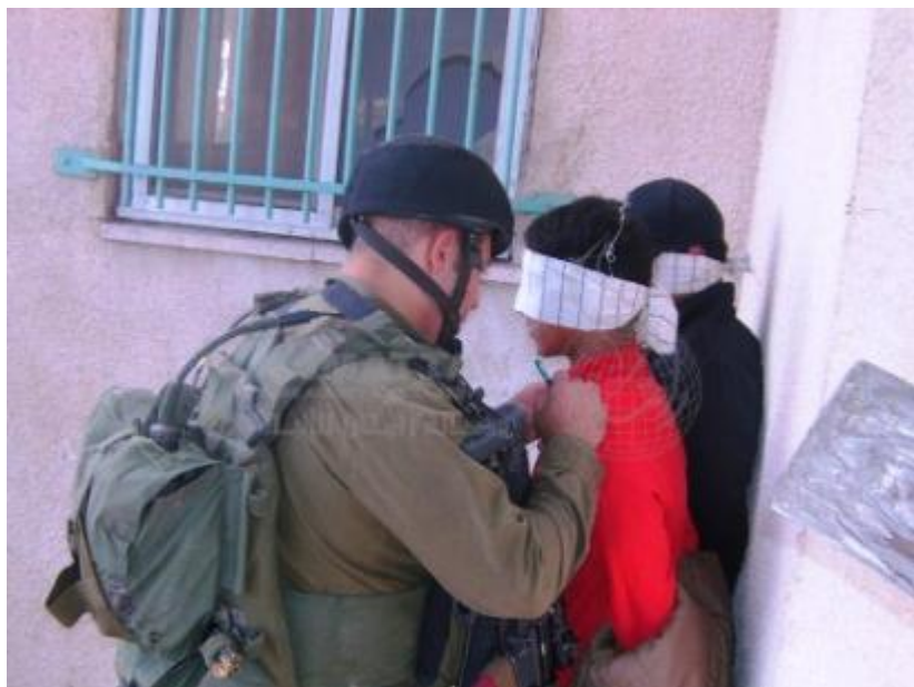
σλληψεις Παλαιστίνιων παιδιών.