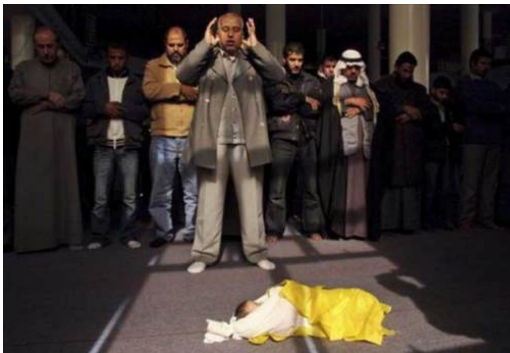
Οι κηδείες στιγματίζουν τις ζωές των παλαιστίνιων παιδιών