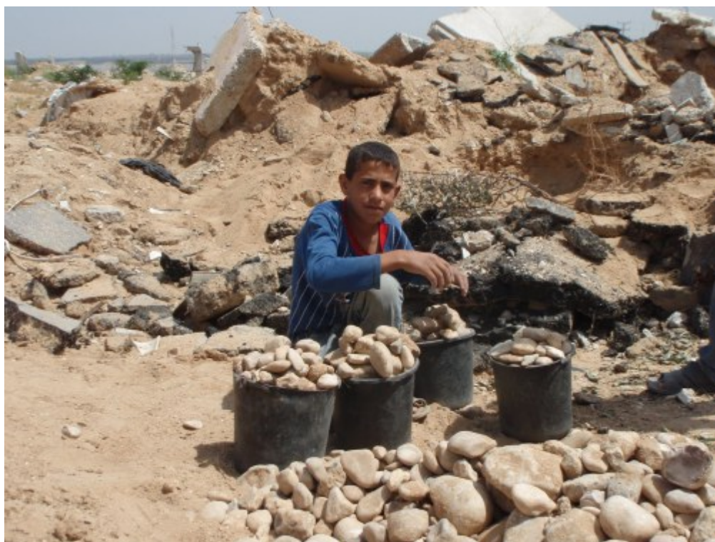
Παιδί μαζεύει μπάζα σε μια απο τις πιο επικίνδυνες περιοχές της Γάζας, όπου Ισραηλινοί ελεύθεροι σκοπευτές συχνά πυροβολούν. Μαζευει μπάζα για να τα πουλήσει ώστε να κερδίσει χρήματα για φαγητό.