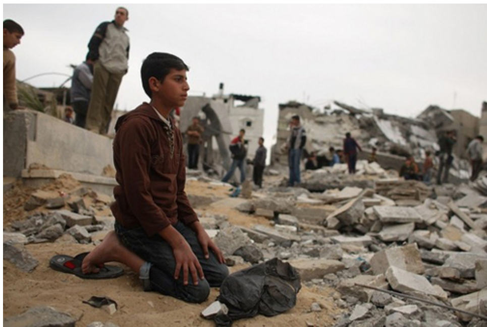
Παιδιά στο πέρασμα της Rafah