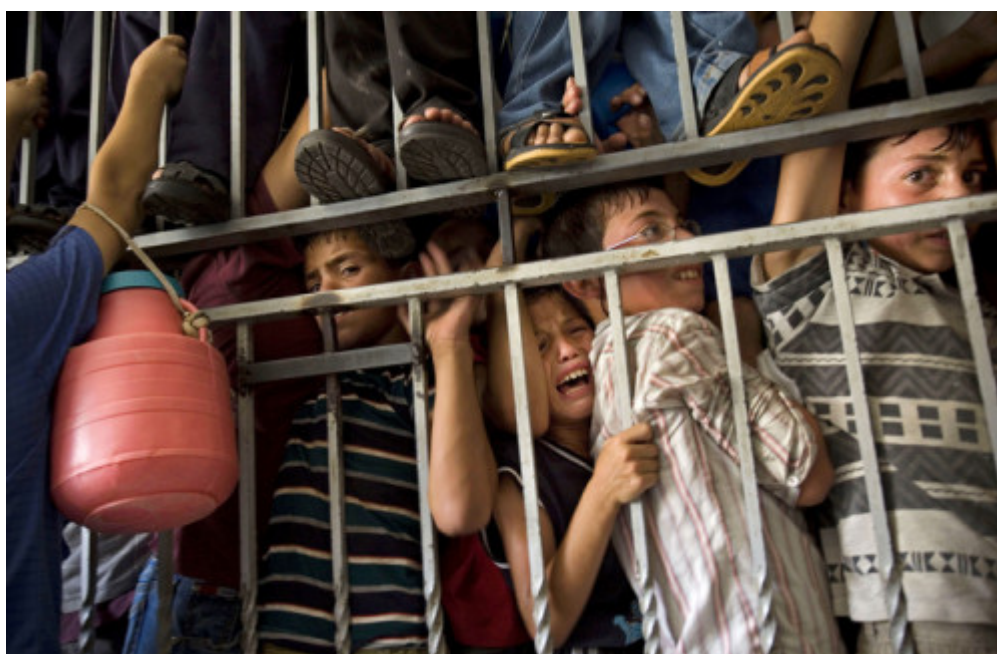
(παλαιστίνια παιδιά σε σημείο ελέγχου)