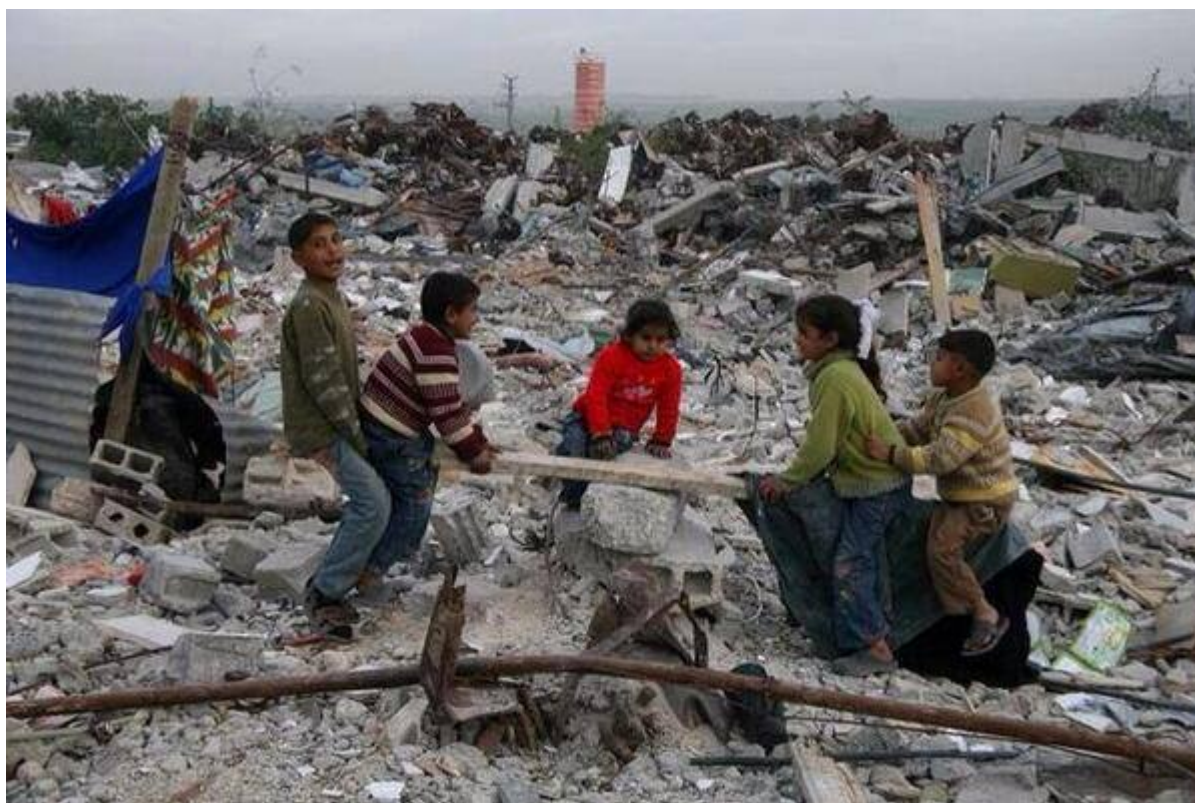
Γάζα- Παιδιά παίζουν τραμπάλα μετά τον βομβαρδισμό