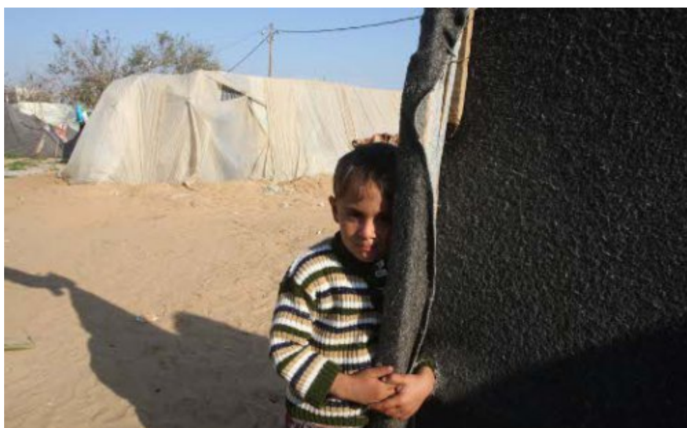
Ένα παιδί στο στρατόπεδο προσφύγων στην Jabaliya στη Gaza, μια από τις πιο πυκνοκατοιμένες περιοχές του κόσμου.