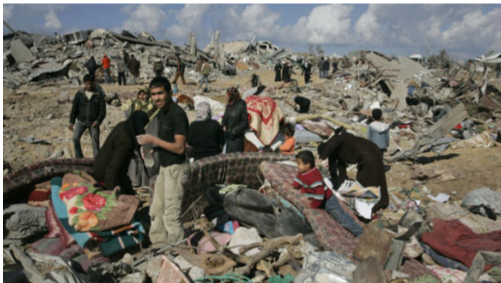
Ό,τι απόμεινε από τα σπίτια τους