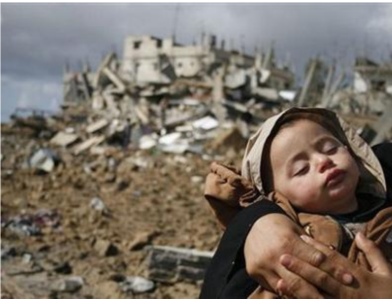
Στα συντρίμια των σπιτιών τους μετα απο βομβαρδισμους