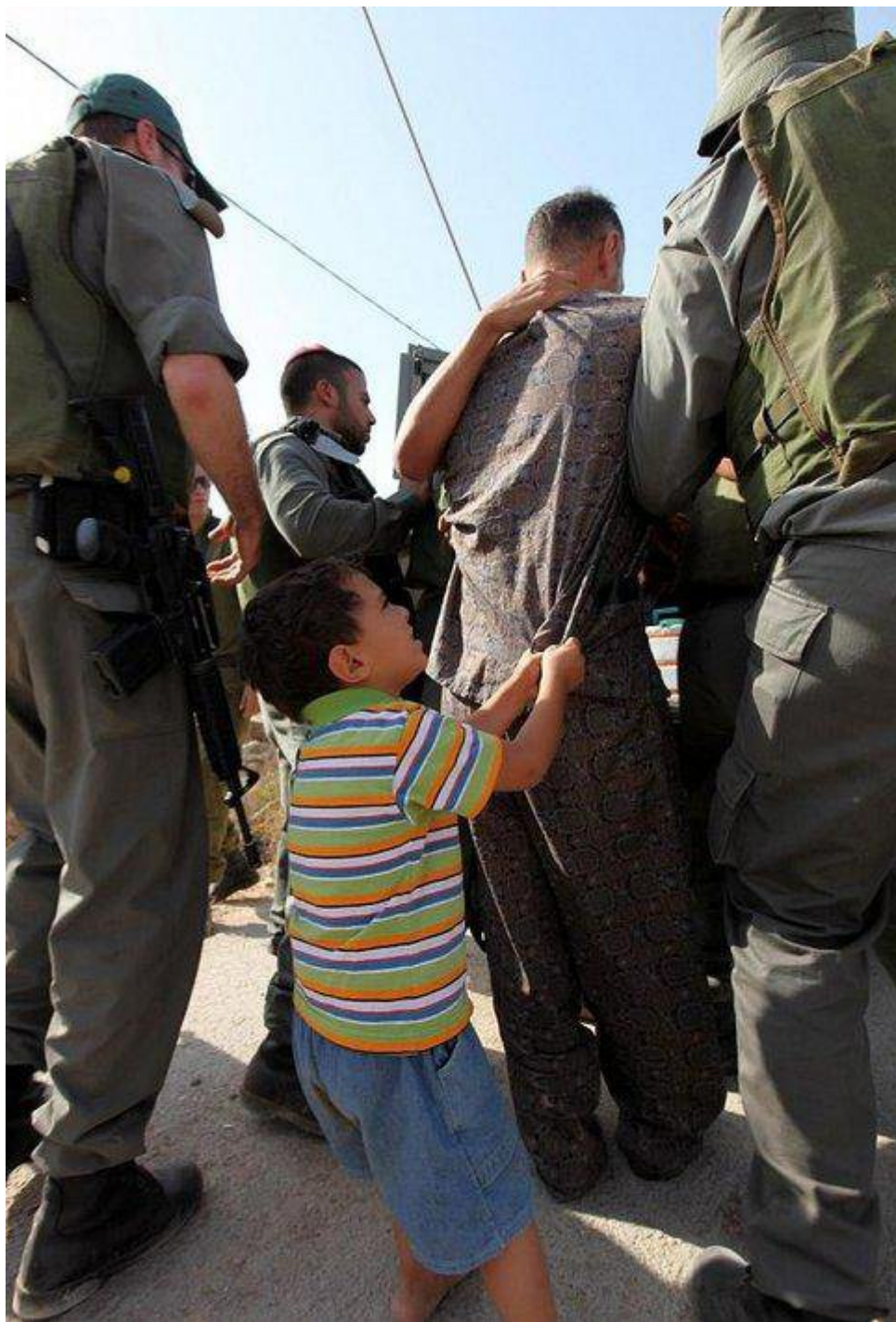
ο μικρος Παλαιστινιος προσπαθει να εμποδισει την σύλληψη του πατέρα του.