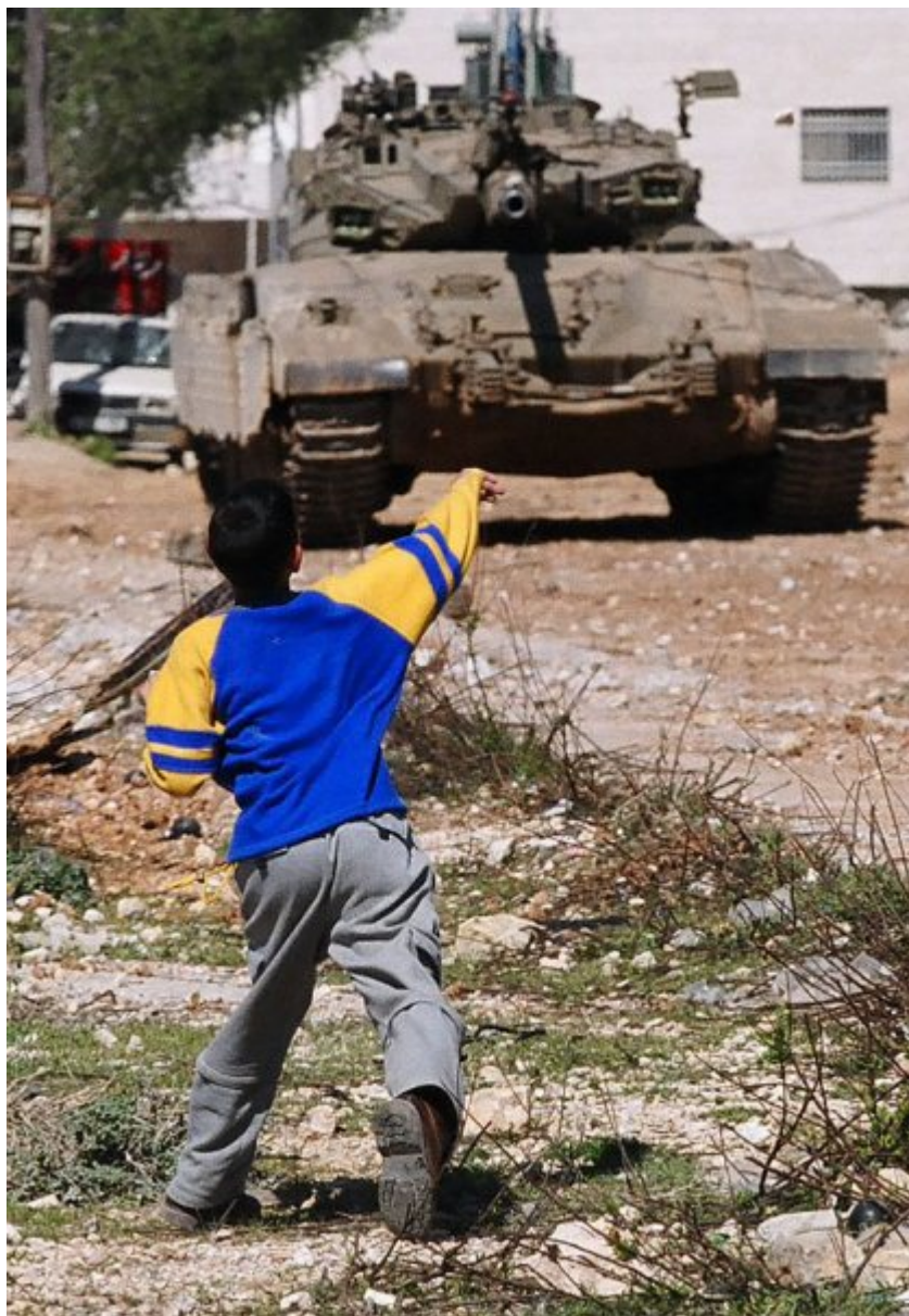
Η δύναμη της αντίστασης