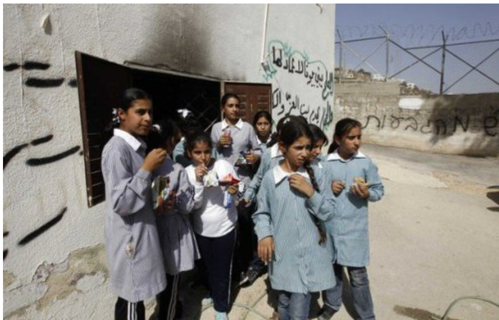
σχολεία στη Γάζα