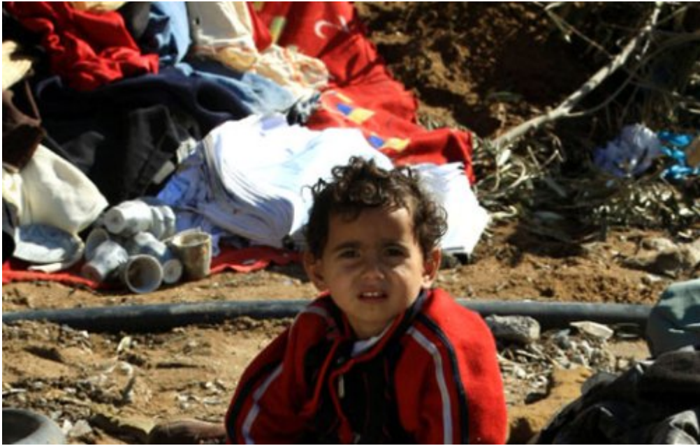
Every child deserves a home. But this Palestinian child has no home no more. Israel demolishes during indiscriminate attacks civil highly populated areas...