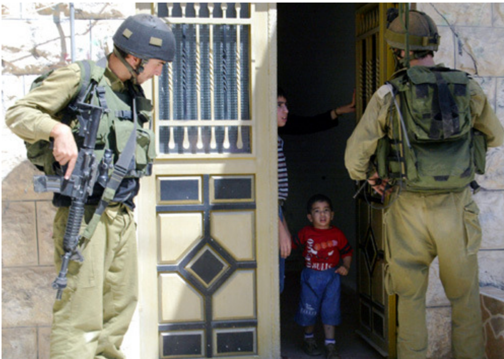
έλεγχος στα σπίτια Παλαιστινίων