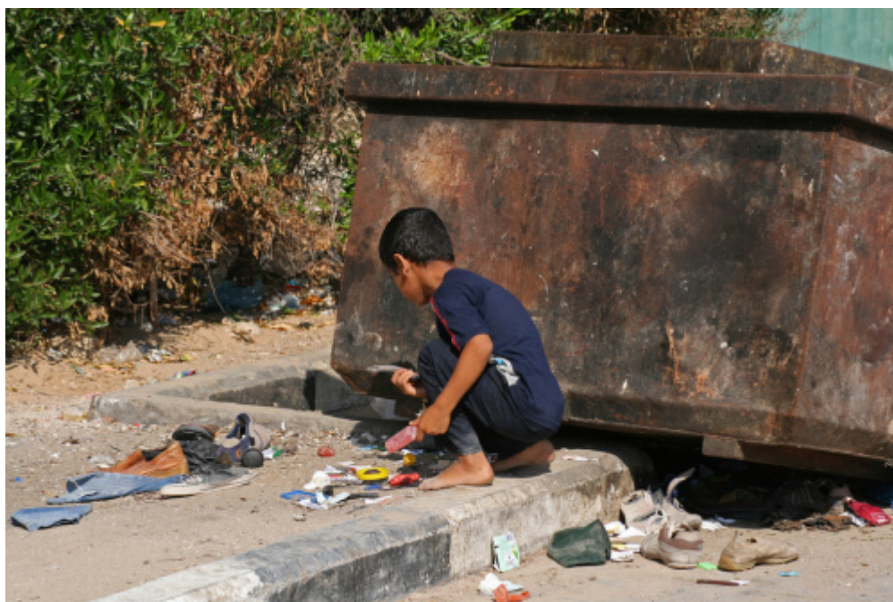
Ψάχνοντας στα σκουπίδια