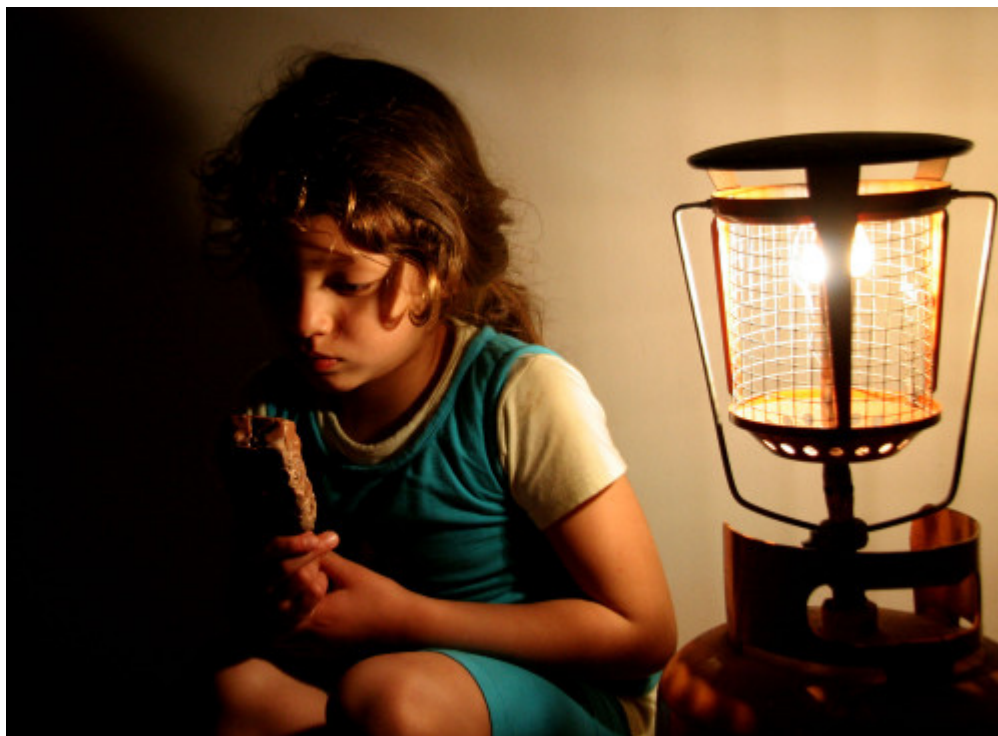
Οι διακοπες ηλεκτροδότησης είναι καθημερινες προκαλώντας μυριάδες προβλήματα σε νοσοκομεία και ατυχήματα στα σπίτια.