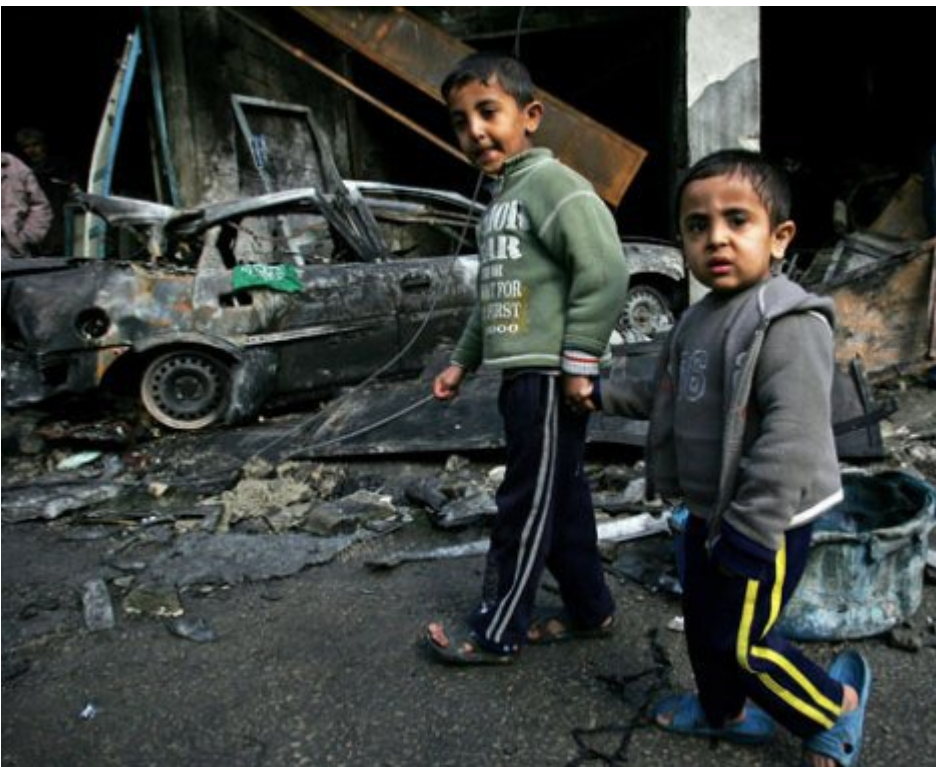
Children in Gaza walking aside a by Israel airattacks demolished mosque