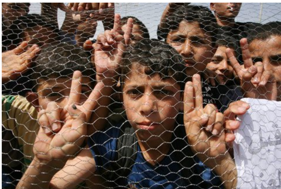
Ελπίζοντας και χαμογελώντας για το καλύτερο....Τα παιδιά της Παλαιστίνης