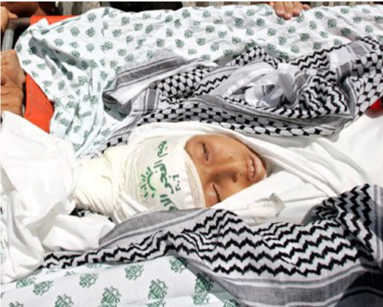
παιδιά, αδέρφια, κορίτσια αγόρια ακόμη και μωρα θύματα των ισραηλινών επιθέσεων στη Γάζα 2008 - 2009