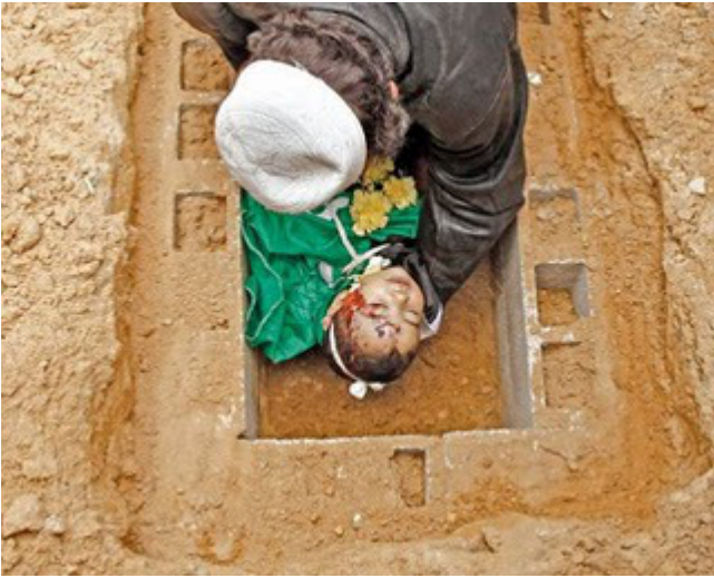
Man burying his child, killed in attacks on Gaza during operation Cast Lead