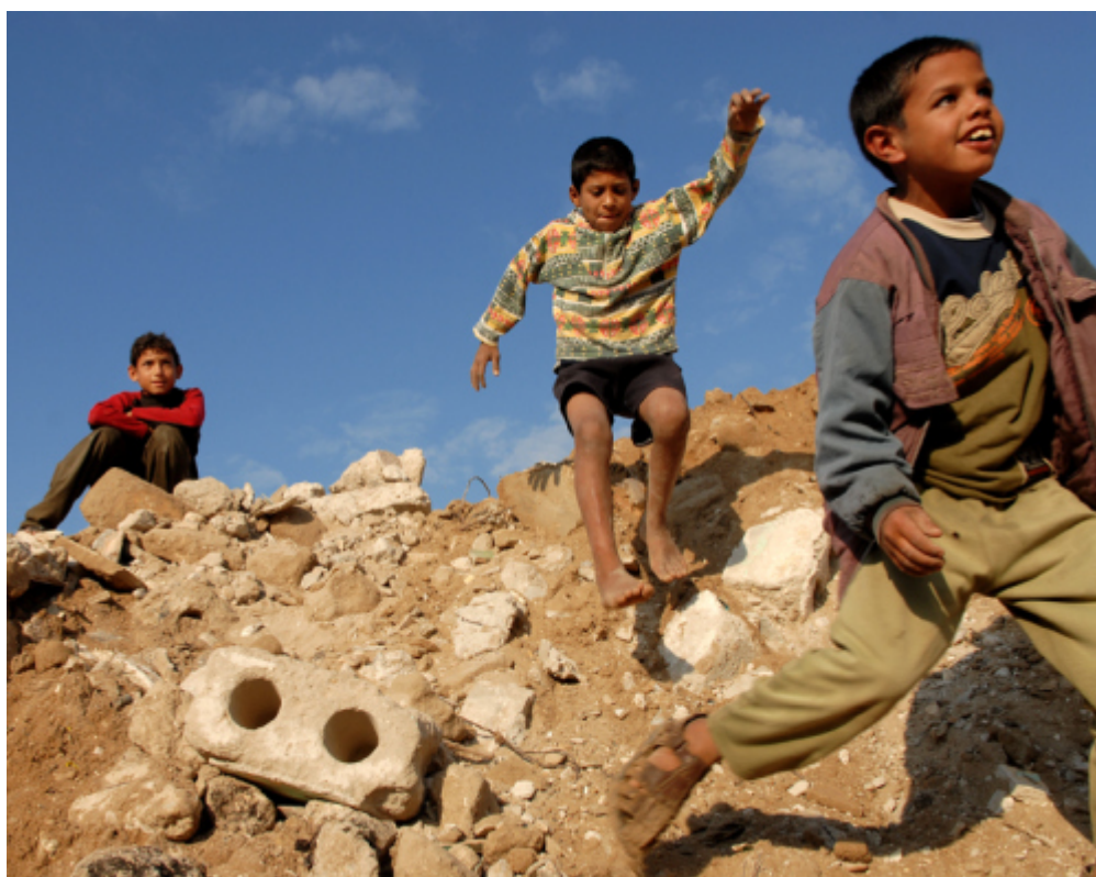
παιδια παίζουν σε συντρίμια απο βομβαρδισμό στη Γάζα