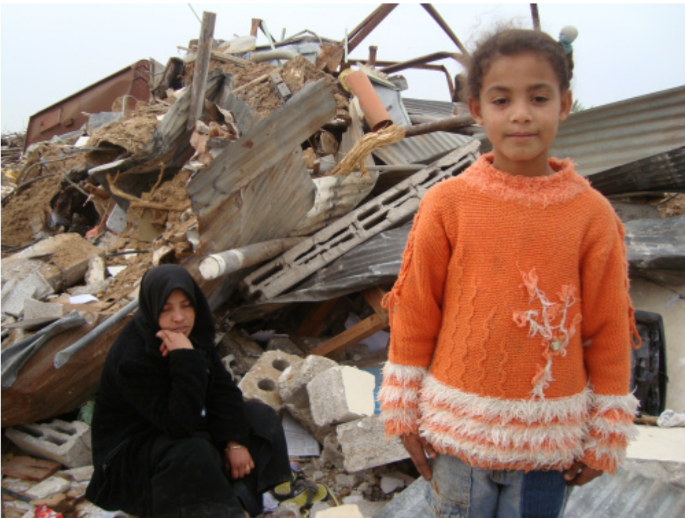
ό,τι έμεινε από το σπίτι της μικρής Παλαιστίνιας μετα από βομβαρδισμό.