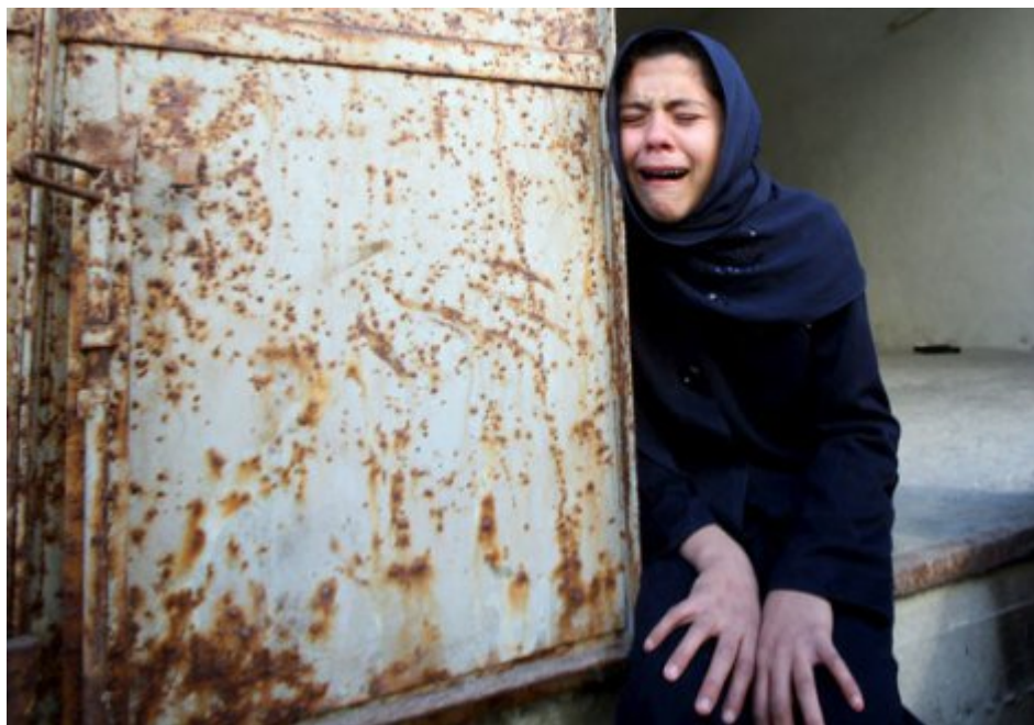
Τα παιδιά βιώνουν καθημερινά την απώλεια δικών τους ανθρώπων και φίλων τους.