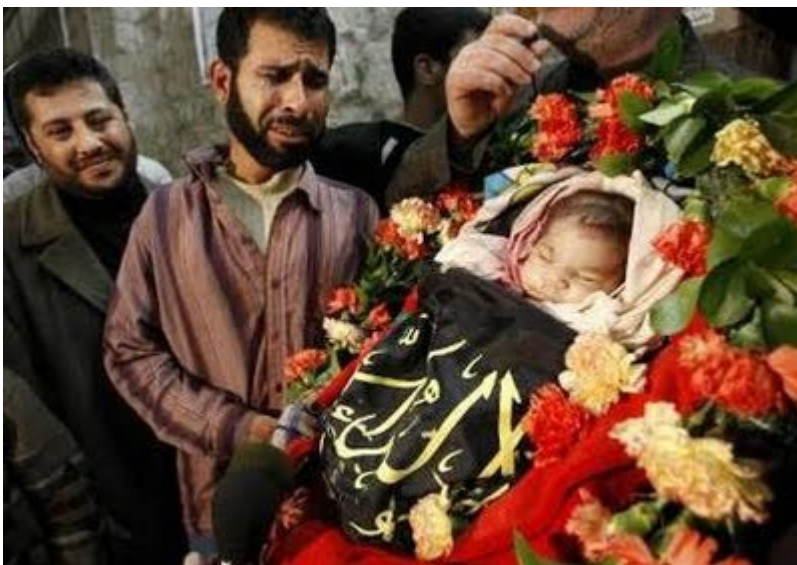
A baby... killed