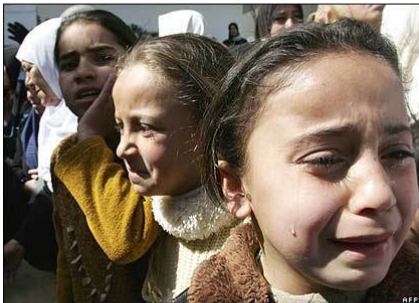
Τα παιδιά της Γάζας με σοβαρές ψυχολογικές συνέπειες, κλαίνε και βρίσκονται σε πανικό κατά την διάρκεια μιας κηδείας, μίας από τις πολλές στις οποίες είναι υποχρεωμένα να παραβρίσκονται.