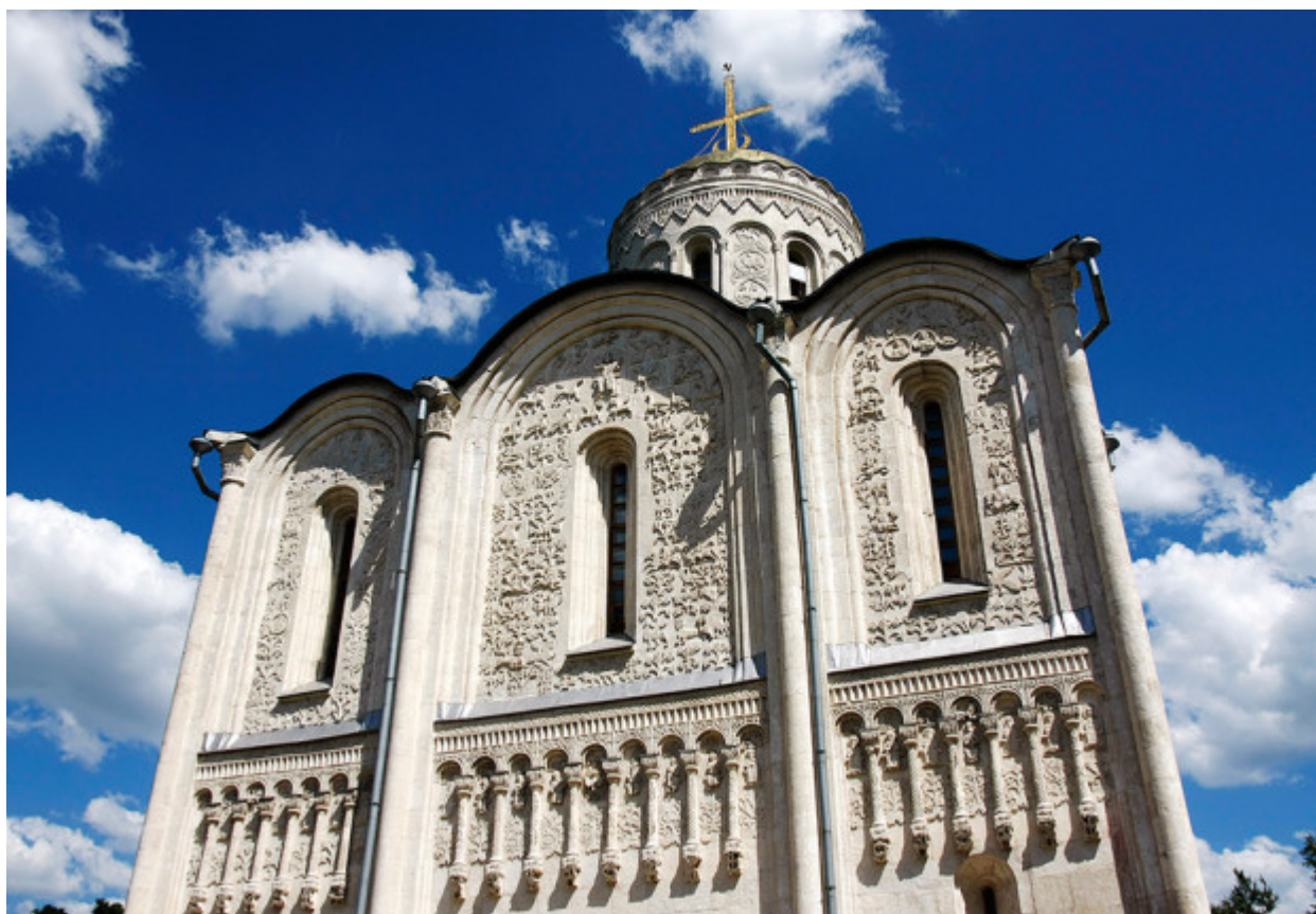
Ο Καθεδρικός του Αγίου Δημητρίου είναι κτισμένος από άσπρη πέτρα και η αρχιτεκτονική του είναι