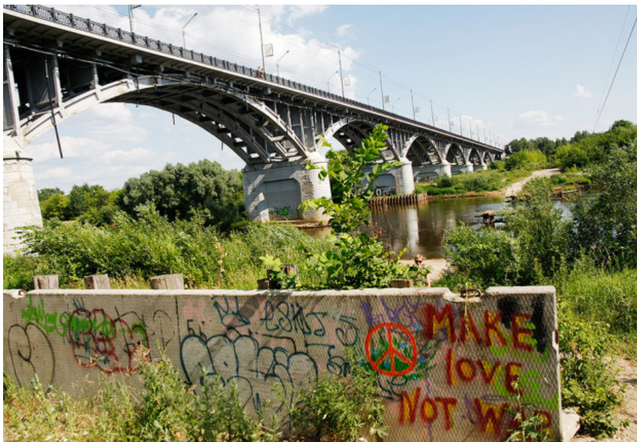
Το 1960 χτίστηκε μόνιμη γέφυρα πάνω από τον ποταμό Κλιάζμα, ενώ πριν οι δύο όχθες συνδέονταν με