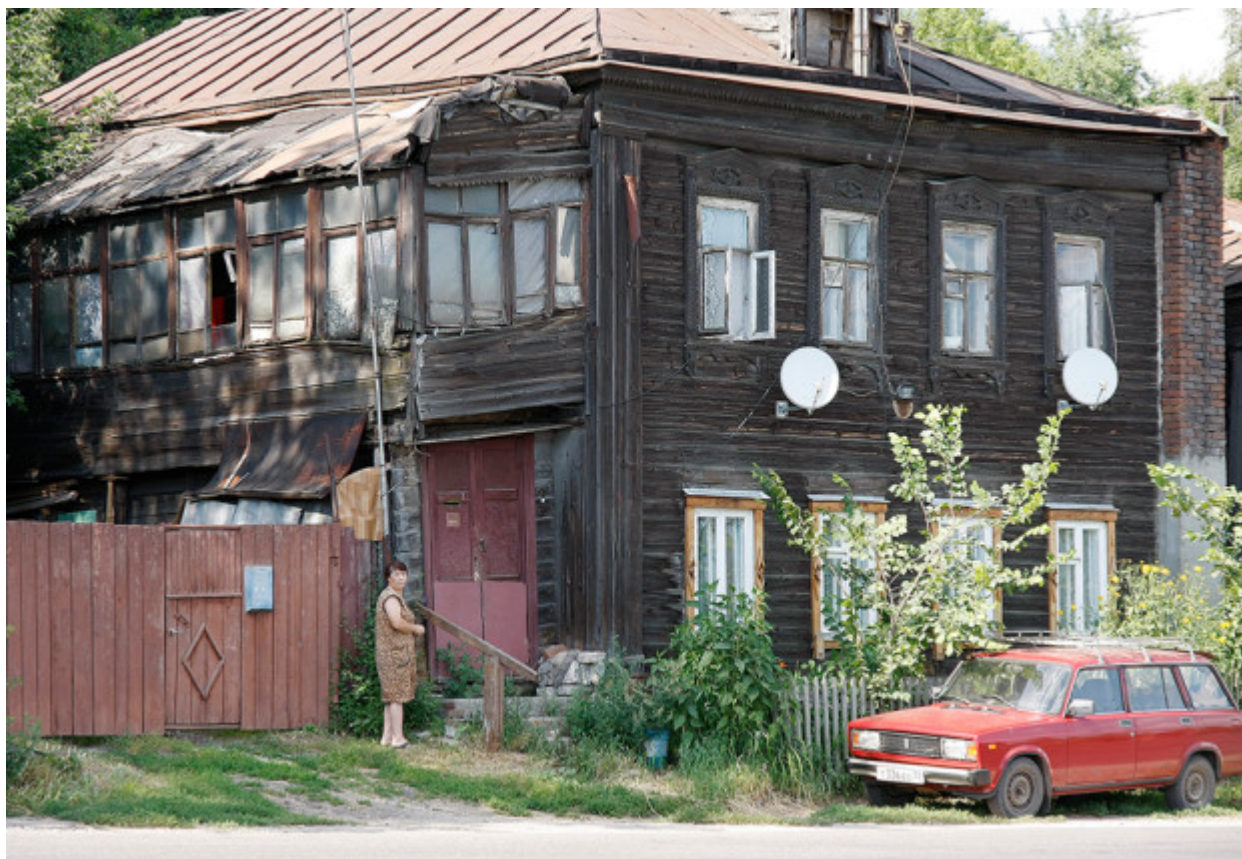
Παρόλο που τα αρχιτεκτονικά μνημεία του Βλαντίμιρ διατηρούνται πολύ καλά, οι περισσότεροι από τους κατοίκους της πόλης ζουν σε ετοιμόρροπα σπίτια που χτίστηκαν προς το τέλος του 19ου αιώνα.