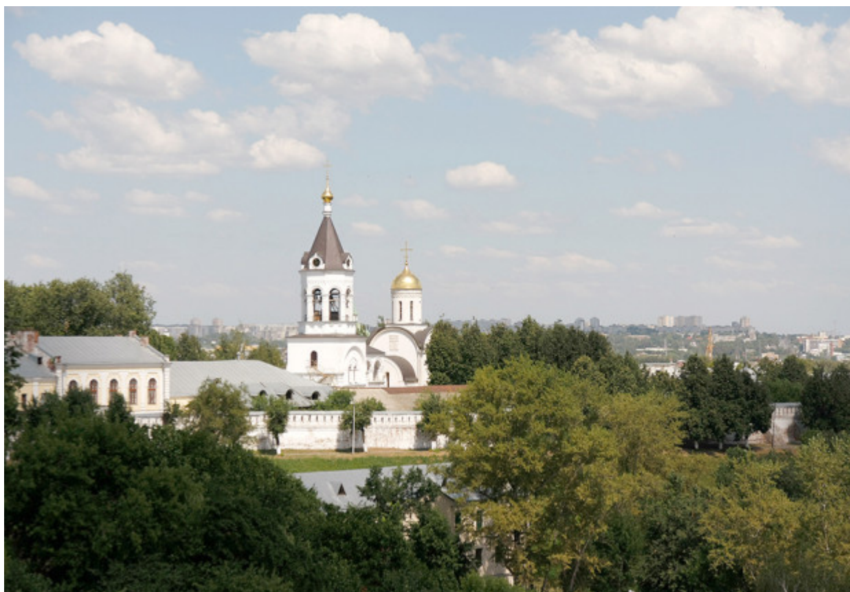
Η Μονή της Γεννήσεως είναι από τις παλαιότερες μονές στη Ρωσία. Ιδρύθηκε το 1191 κατά τη