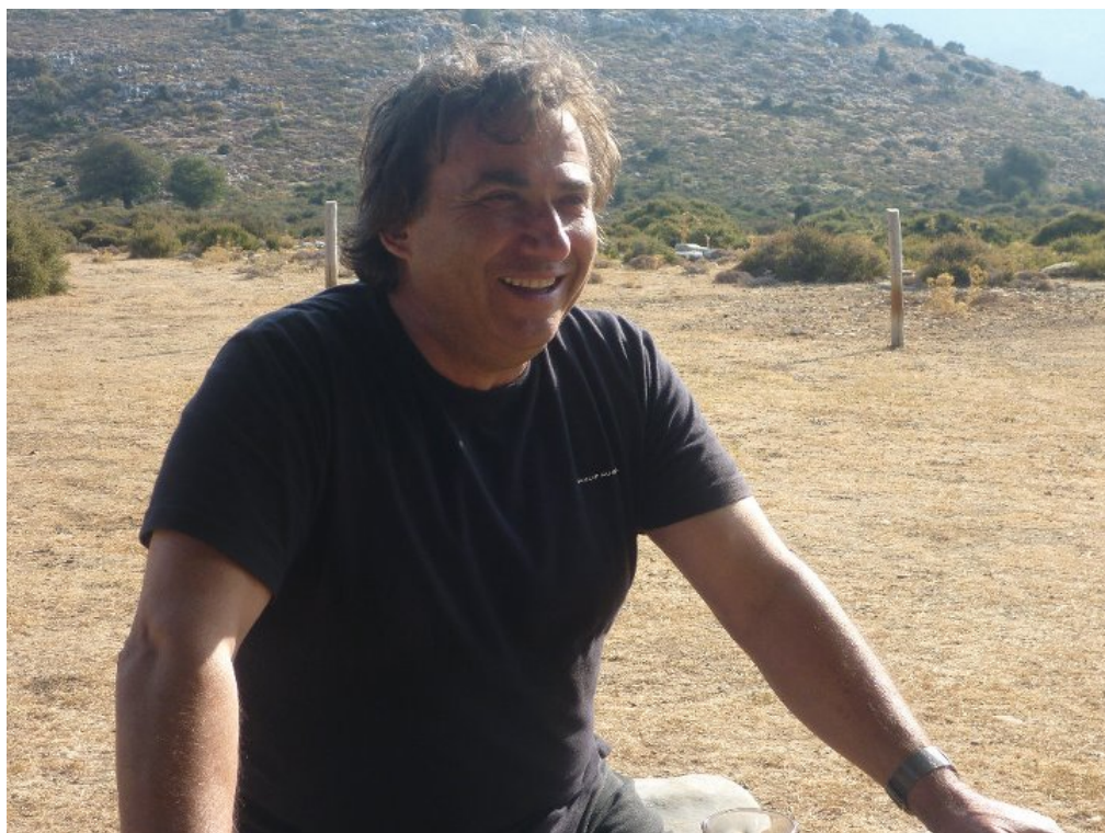
Λουδοβίκος των Ανωγείων, 8-11-2011

Ψαραντώνη παρουσιάζουν τη μουσική παράσταση «Ερωτόκριτος» του Βιτσέντζου Κορνάρου, που ανέβηκε στο Ηρώδειο στις 30 Ιουνίου, ενώ η έκπληξη της βραδιάς είναι μια σύνθεση του Βαγγέλη Παπαθανασίου, μια παραγγελία ειδικά για τα Υακίνθια, με θέμα τον Ερωτόκριτο. Κατά τη διάρκεια των εκδηλώσεων θα παρουσιαστεί έκθεση ζωγραφικής του Λουδοβίκου των Ανωγείων με θέμα: «Οι ήρωες του Ερωτόκριτου», με σύγχρονα πρόσωπα.