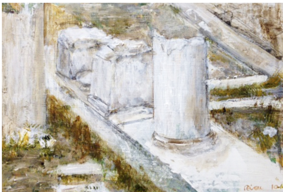
Έργο του Παπαδάκη

Η έκθεση, η οποία παρουσιάστηκε για πρώτη φορά στην Αίθουσα Τέχνης Ιανός, από τις 3 Ιουνίου έως τις 12 Ιουλίου 2014, μεταφέρεται στο Ιστορικό και Λαογραφικό Μουσείο του Δήμου Αίγινας, από τις 18 έως τις 30 Ιουλίου.