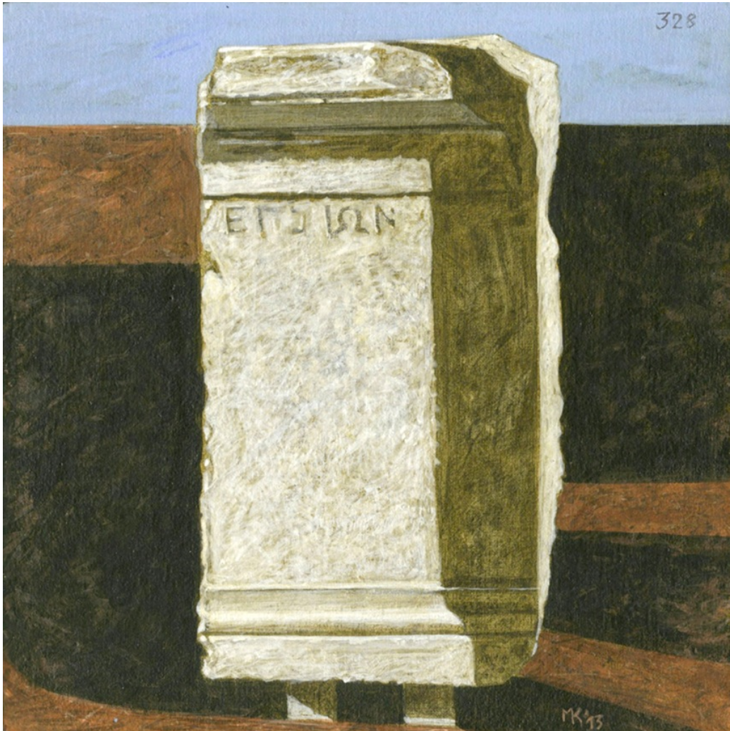
Έργο του Καμπάνη

και την εξαιρετική πένα του Πausανία, που με μοναδικό ύφος αποδίδει την πραγματικότητα του ελληνικού χώρου και μαρτυρά την ελληνική ζωή της κλασικής εποχής.