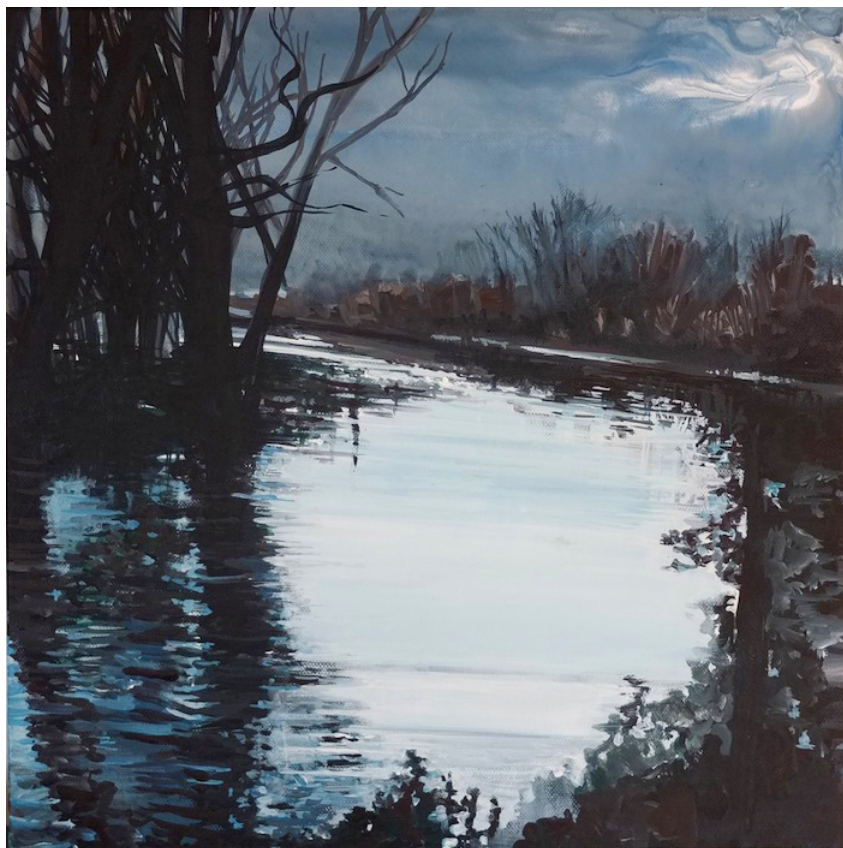
Έργο του Σαλταφέρου

Η έκθεση, η οποία παρουσιάστηκε για πρώτη φορά στην Αίθουσα Τέχνης Ιανός, από τις 3 Ιουνίου έως τις 12 Ιουλίου 2014, μεταφέρεται στο Ιστορικό και Λαογραφικό Μουσείο του Δήμου Αίγινας, από τις 18 έως τις 30 Ιουλίου.