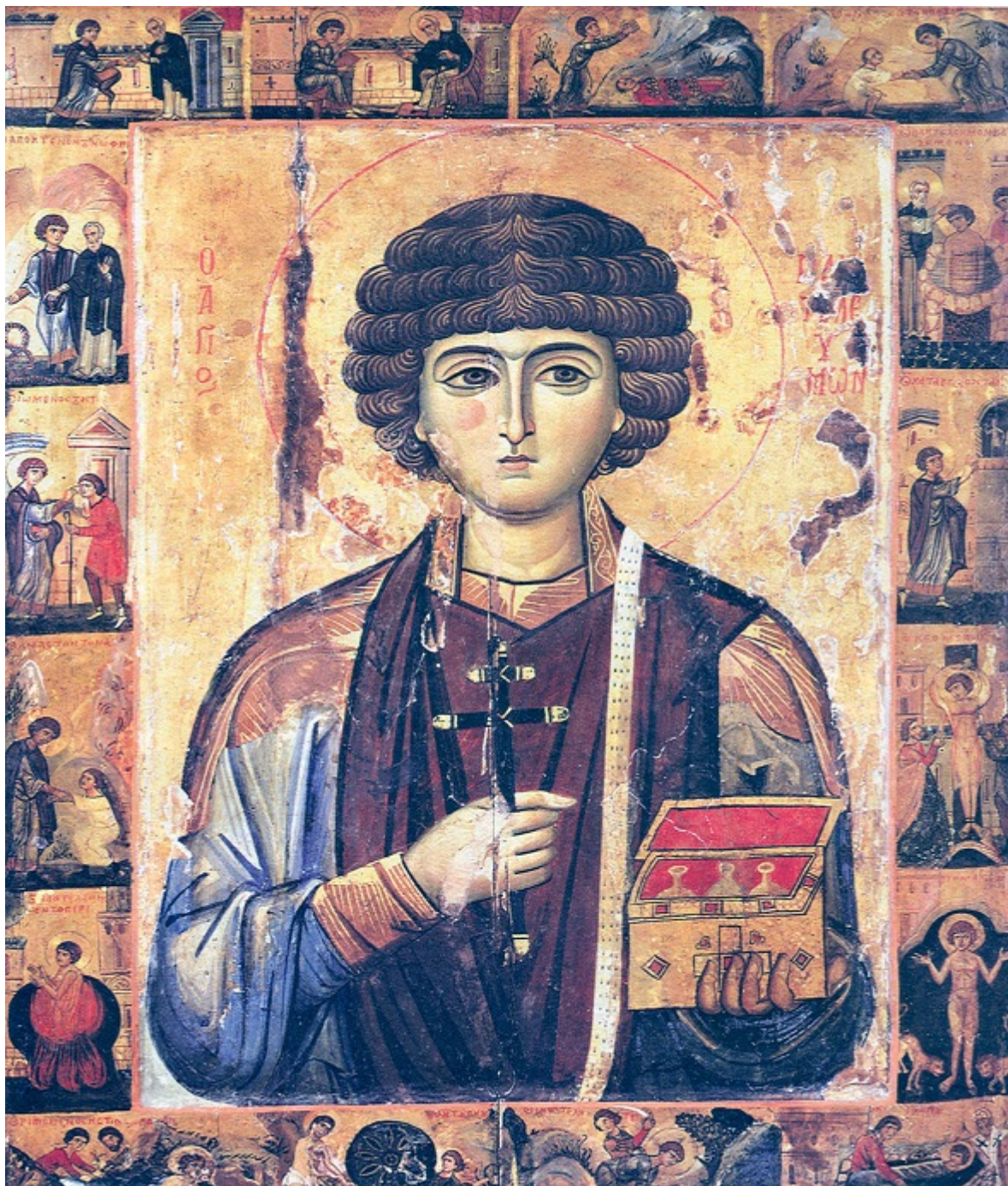
Θεραπεία του τυφλού