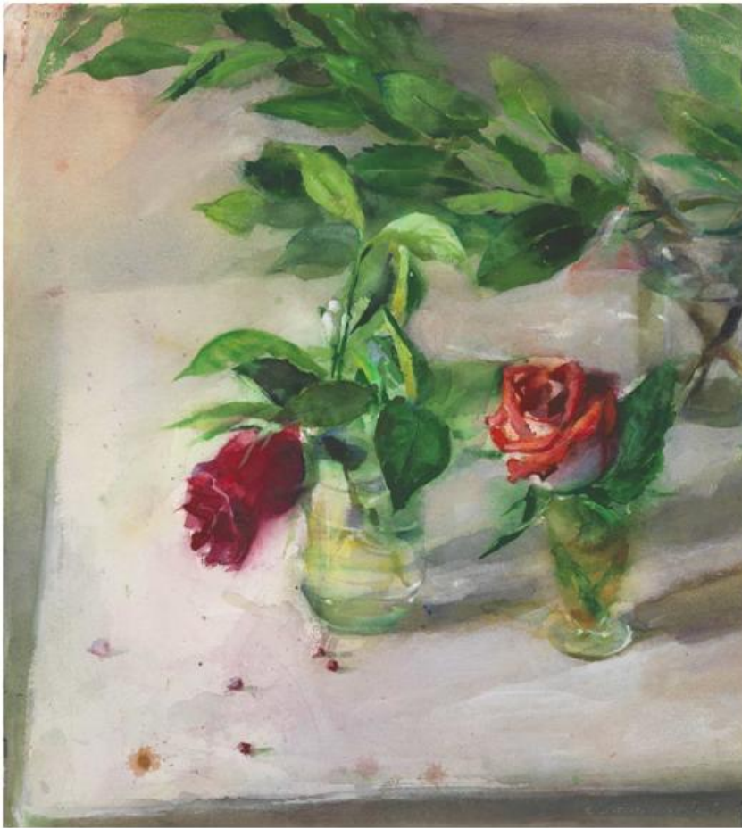
Έργο του Στέφανου Δασκαλάκη

Η έκθεση είναι αποτέλεσμα αλληλεγγύης μεταξύ καλλιτεχνών, μόνιμων κατοίκων του νησιού, Ελλήνων και ξένων θερινών κατοίκων, καθώς επίσης και φίλων του ιερού νησιού. Με τα έργα τους οι καλλιτέχνες υμνούν την ομορφιά του Αιγαίου και της Πάτμου, αλλά επισημαίνουν ταυτοχρόνως την εύθραυστη ισορροπία του θαλάσσιου οικοσυστήματος που κινδυνεύει από την ρύπανση και την υπεραλίευση.