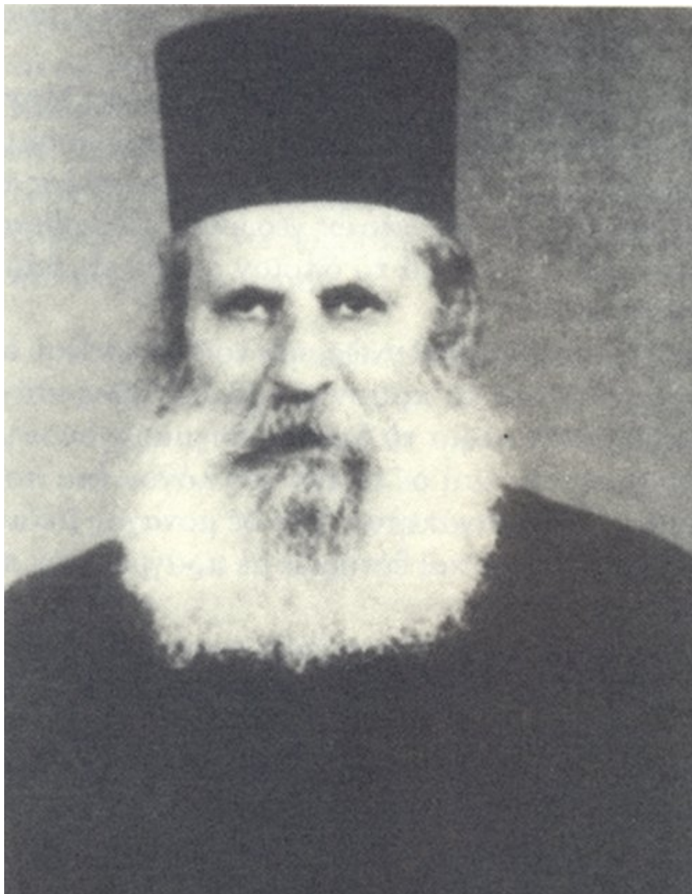
Ο Γέροντας Θεοδόσιος ο Σταυροβουνιώτης

εκεί τα εξής: «Τώρα που είμαι εδώ θα με καλέση ο Κύριος όπως όλους τους ανθρώπους και θα εγκαταλείψω την ζωή αυτήν δι'αυτό σας παρακαλώ να μεταφέρετε το σώμα μου εις την μονήν της μετανοίας μου, διά να ταφώ εκεί μετά των λοιπών μου αδελφών». Αυτά επραγματοποιήθησαν με ακρίβειαν, όπως τα προείπε.