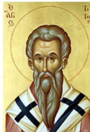
ΑΠ. ΤΙΤΟΣ 25 Αυγούστου