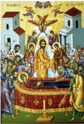
ΚΟΙΜΗΣΙΣ ΤΗΣ ΘΕΟΤΟΚΟΥ 15 Αυγούστου