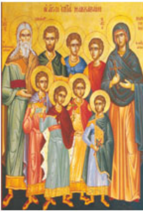
ΑΓ. 7 ΜΑΚΚΑΒΑΙΟΙ 1 Αυγούστου