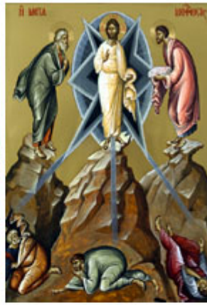
ΜΕΤΑΜΟΡΦΩΣΙΣ 6 Αυγούστου