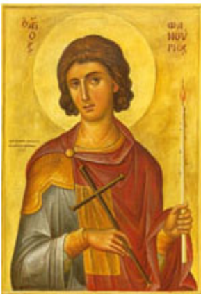
ΑΓ. ΦΑΝΟΥΡΙΟΣ 27 Αυγούστου