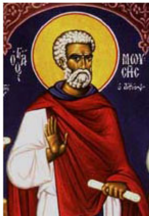
ΑΓ. ΜΩΥΣΗΣ Ο ΔΙΘΥΟΣ 28 Αυγούστου