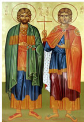
ΑΓ. ΦΛΑΥΡΟΣ & ΣΑΥΡΟΣ 18 Αυγούστου