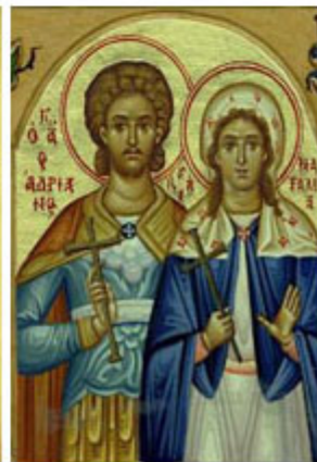
ΑΓ. ΑΔΡΙΑΝΟΣ & ΝΑΤΑΛΙΑ 26 Αυγούστου