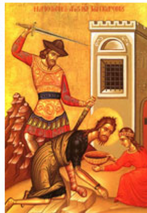
ΑΠΟΤΟΜΗ ΠΡΟΔΡΟΜΟΥ 29 Αυγούστου