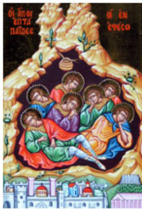
ΑΓ. 7 ΠΑΙΔΕΣ ΕΝ ΕΦΕΣΩ 4 Αυγούστου