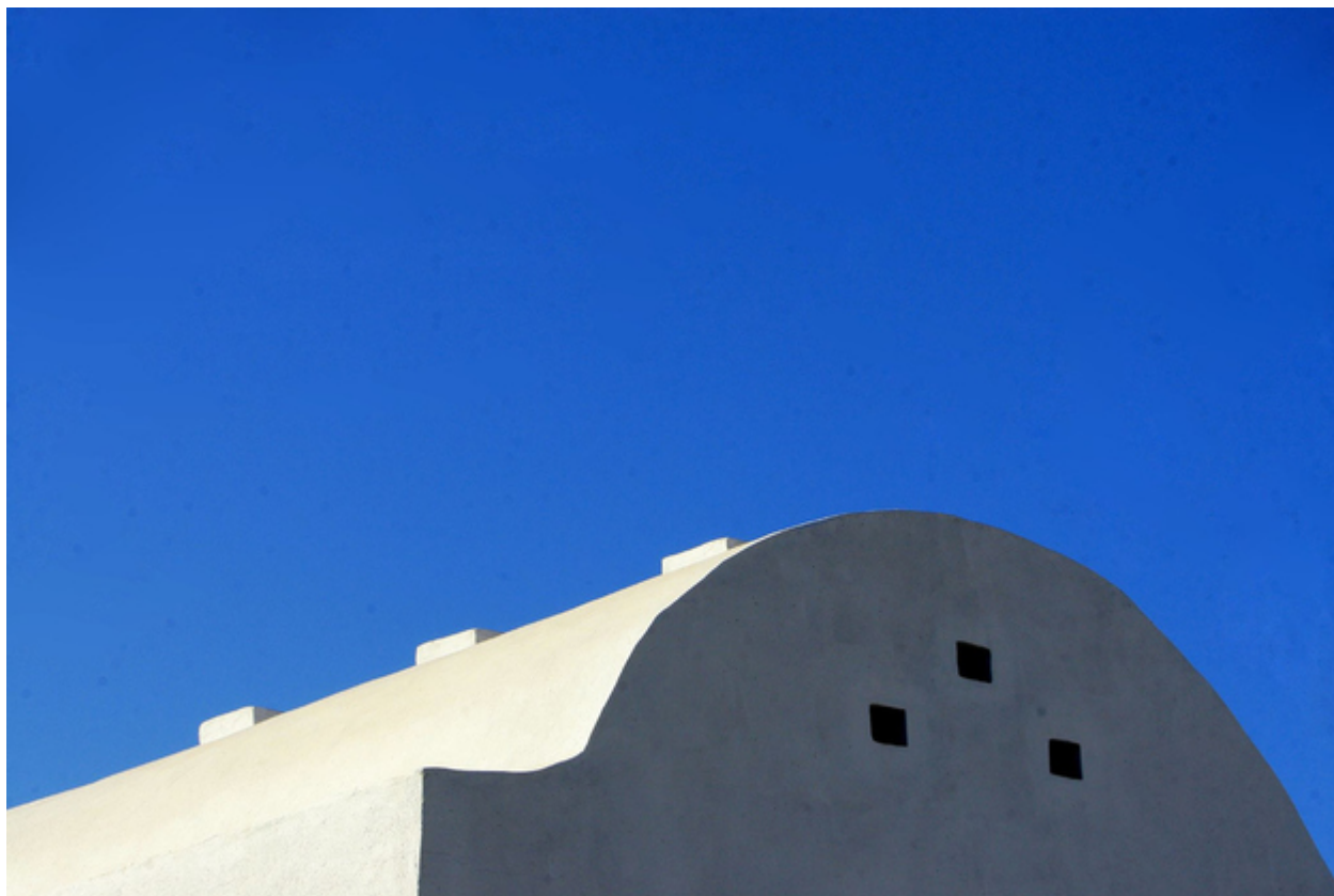
30. Η Μύκονος είναι το μεγαλύτερο beach party του καλοκαιριού