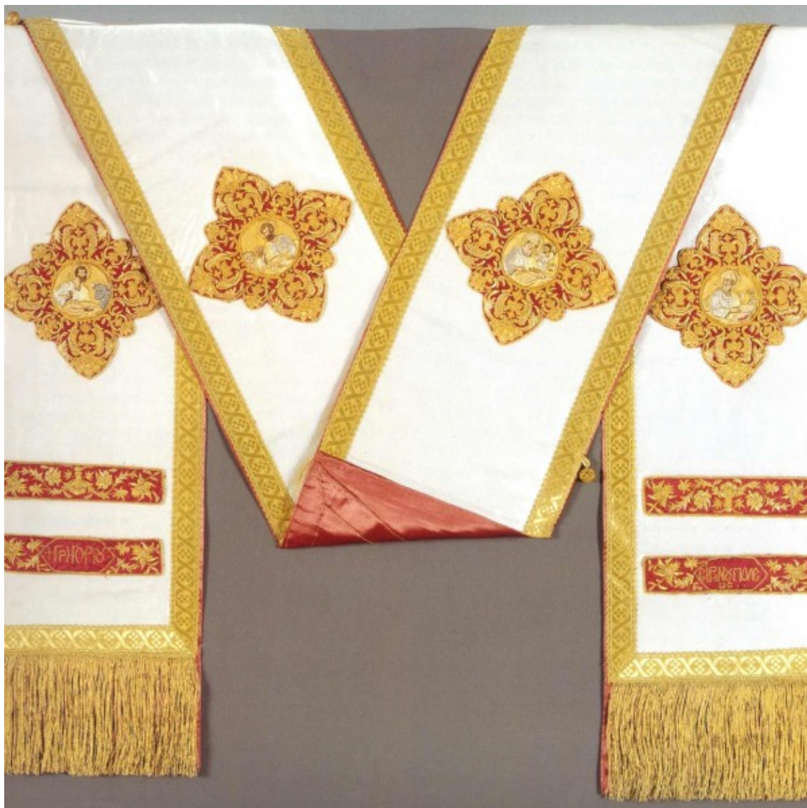
Το ομόφορο του Μητροπολίτου Ειρηνουπόλεως και Βατοπαιδίου κυρού Γρηγορίου, το οποίο φυλάσσεται στο Νεώτερο Σκευοφυλακίο της Ιεράς Μεγίστης Μονής του Βατοπαιδίου

Το επόμενο βήμα είναι για τα τέλη του 18ου αιώνα, εκεί γύρω στα 1774, κι ύστερα από τη Συνθήκη του «Κιουτσούκ Καϊναρτζή», η λειτουργία των ονομαζόμενων «σπιτικών» σχολείων από τους «γραμματοδιδασκάλους», οι οποίοι δίδασκαν βέβαια τα στοιχειώδη: ανάγνωση, γραφή, αριθμητική.