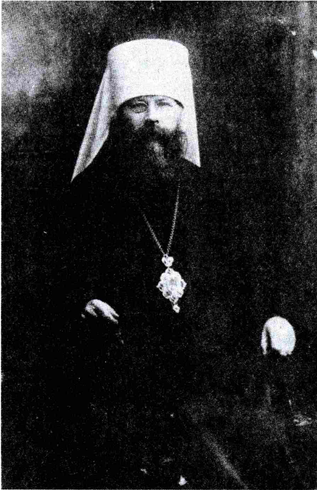
Ο Βενιαμίν εξελέγη Μητροπολίτης Πετρουπόλεως -τότε πρωτευούσης του Κράτους- το έτος 1917, όταν την εξουσία κατείχε η προσωρινή επαναστατική Κυβέρνηση του Κερένσκυ. Η εκλογή του είχε γίνει κατά τρόπο απόλυτα