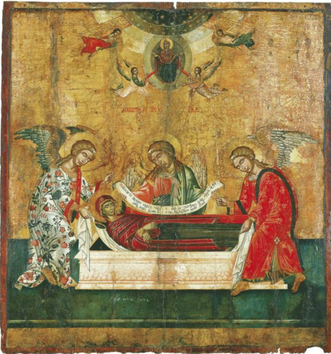
Βυζαντινό Μουσείο, Η Κοίμηση και Μετάσταση της Θεοτόκου, Α μισό του 18ου αι, Κων. Κονταρίνης

σου κανοναρχούνε το κάθε απομεσήμερο έως αργά με το δικό τους τρόπο τον Παρακλητικό Κανόνα.