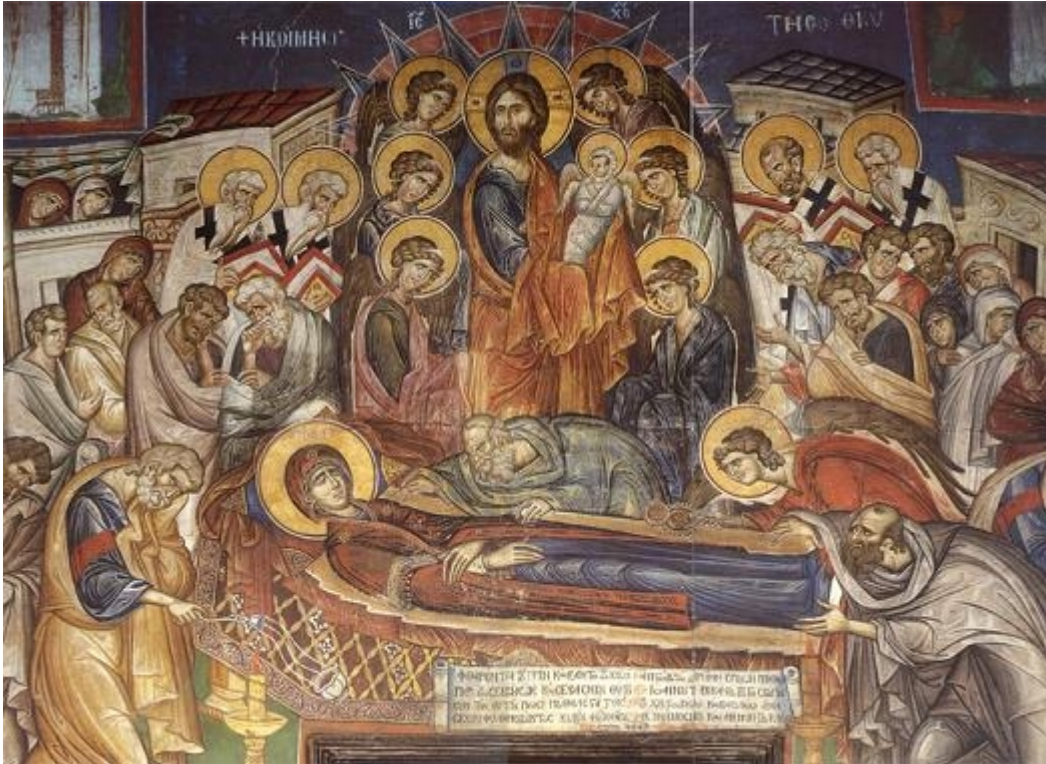
Η Κοίμηση της Παναγίας, Τοιχογραφία καθολικού Ι.Μ. Βατοπαιδίου (1312)

/ Άγιοι - Πατέρες - Γέροντες / Ορθόδοξη πίστη