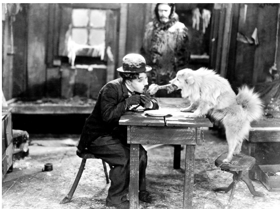
Τσάρλι Τσάπλιν. Η ταινία Ο Χρυσοθήρας

4) Δευτέρα 1 Σεπτεμβρίου 2014, στις 20:30μ.μ.