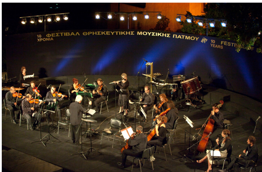
Η Ορχήστρα του Φεστιβάλ Πάτμου

Το δεύτερο μέρος της συναυλίας είναι αφιερωμένο στο Μάνο Χατζηδάκι. Εδώ βέβαια τα κομμάτια που θα ακουστούν, δεν έχουν αμιγώς θρησκευτικό περιεχόμενο. Θεώρησα ότι δεν θα έπρεπε το φεστιβάλ να μην κάνει έστω μία σύντομη αναφορά, στον σπουδαίο αυτό τραγουδοποιό. Θα παίξουμε τραγούδια από τη «Ρωμαϊκή Αγορά», τα τραγούδια αυτά που ταιριάζουν στο χώρο, τραγούδια με ευαισθησία και υψηλή αισθητική. Ένας στενός συνεργάτης του Χατζηδάκι, ο Βασίλης Γισδάκης θα ερμηνεύσει τα τραγούδια του. Αξίζει να σημειωθεί ότι για τον Ελ Γκρέκο και τον Χατζηδάκι θα διαβαστούν στοιχεία για τη ζωή και το έργο τους.