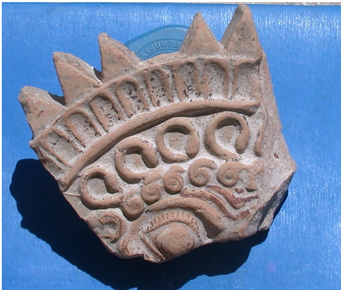
Από τα ευρήματα στο κτίριο Δ, φωτο 2

Οι φετινές έρευνες έφεραν στο φως, σε πολύ μικρή απόσταση την είσοδο του τεμένους, ένα νέο μεγάλο κτίριο, το οποίο προστίθεται στα άλλα 12 κτίρια που έχουν αποκαλυφθεί από τις παλαιότερες έρευνες και στα 5 που έχουν εντοπιστεί στο νησάκι Τσιμνητήρι, το οποίο κατά τη αρχαϊκή περίοδο ήταν ενωμένο με το Δεσποτικό. Η ανασκαφή του κτιρίου δεν ολοκληρώθηκε, αλλά έγινε σαφής η πολύπλοκη κάτοψη του με τουλάχιστον πέντε δωμάτια. Με βάση τα ευρήματα χρονολογείται στην κλασική περίοδο. Ο εντοπισμός του κτιρίου, αφενός μαρτυρά τη συνεχή λειτουργία του ιερού και στους κλασικούς χρόνους και αφετέρου τη μεγάλη έκτασή του και τη πολύπλοκη χωροταξική οργάνωσή του, η οποία αντανακλά τη μεγάλη εμβέλεια φήμη του και την υψηλή επισκεψιμότητά του, τόσο στους αρχαϊκούς όσο και τους κλασικούς χρόνους.