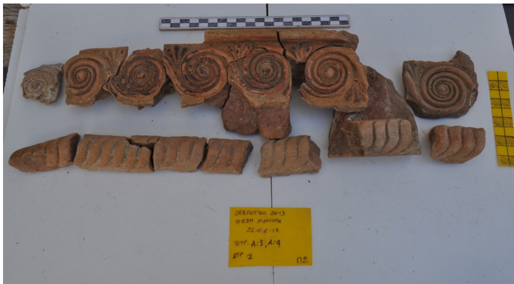
Από τα ευρήματα στο κτίριο Δ, φωτο 1

Ιδιαίτερα σημαντικά και διαφωτιστικά για την τοπογραφία, την έκταση και τη χωροταξική οργάνωση του ιερού του Απόλλωνα στη θέση Μάντρα, στο ακατοίκητο νησί Δεσποτικό, στα δυτικά της Αντιπάρου, ήταν τα αποτελέσματα της φετινής ανασκαφικής περιόδου που πραγματοποιήθηκε χάρη στις ευγενικές χορηγίες των Ιδρυμάτων Α&Π Κανελλοπούλου, Ι. Λάτση, Α.Γ.Λεβέντη, του Αθ. Μαρτίνου και του Υπουργείου Ναυτιλίας και Αιγαίου.