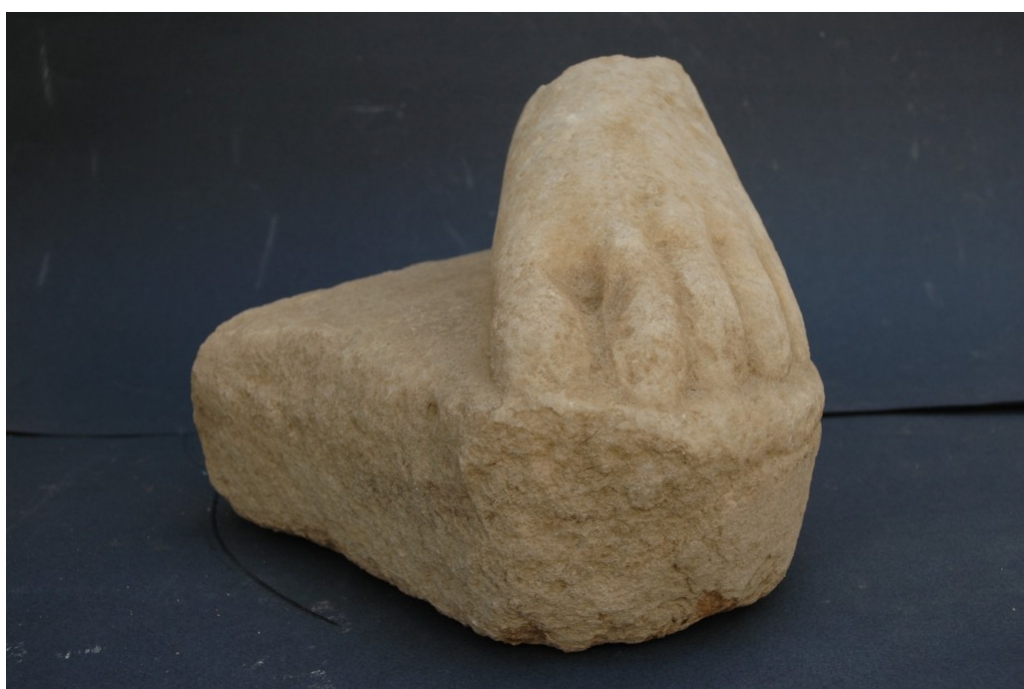
Κάτω άκρο αρχαϊκού κούρου

παραπάνω ευρήματα είναι ιδιαίτερης σπουδαιότητας, γιατί αποτελούν πλέον με σιγουριά τις πρωιμότερες ενδείξεις λατρευτικών πρακτικών, στο χώρο του ιερού του Απόλλωνα ήδη από τον 9 ο αι. π.Χ., στον ίδιο χώρο όπου τον 6 ο αι. π.Χ. κτίστηκε ο μνημειακού χαρακτήρα ναός. Δυτικά του κτιρίου Δ, συνεχίστηκε η ανασκαφή της εκτεταμένης απόθεσης αντικειμένων, που είχε διερευνηθεί το 2013, η οποία δημιουργήθηκε μετά την ανακαίνιση του κτιρίου. Η φετινή ανασκαφική έρευνα έφερε στο φώς πληθώρα ευρημάτων, όπως αρχαϊκούς κεράμους οροφής, πήλινα ακροκέραμα από την οροφή του κτιρίου, ζωόμορφα ειδώλια, αγγεία σε σχήμα ταυροκεφαλής, λεοντοκεφαλής, σειρήνας, διακοσμημένα αγγεία παριανών εργαστηρίων, χάλκινα αντικείμενα και κοσμήματα, ενεπίγραφα αγγεία αφιερωμένα στον Απόλλωνα.