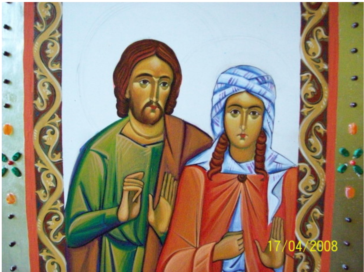
Άγιοι Ανδριανός και Ναταλία