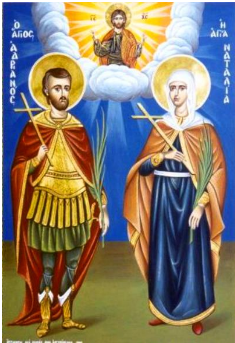
Άγιοι Ανδριανός και Ναταλία