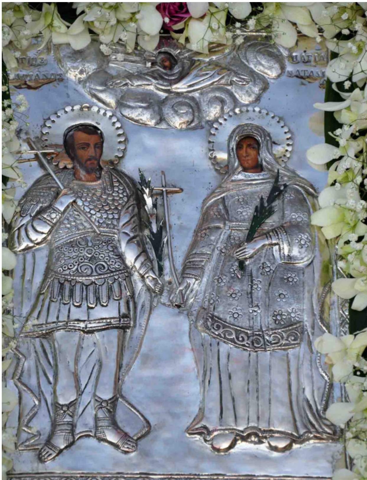
Άγιοι Ανδριανός και Ναταλία