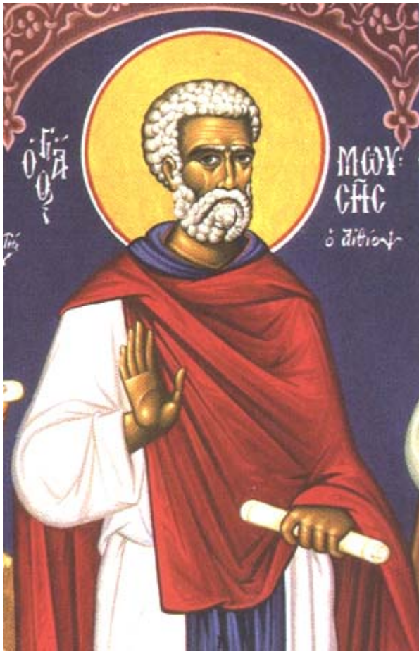
Όσιος Μωυσής ο Αιθίοπας