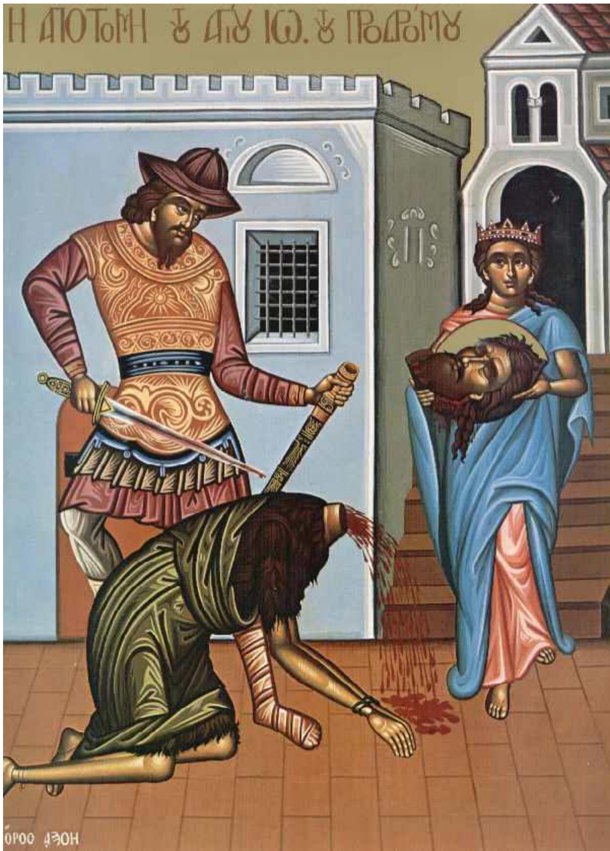
Η Αποτομή της Τιμίας Κεφαλής του Αγίου Ιωάννου του Προδρόμου