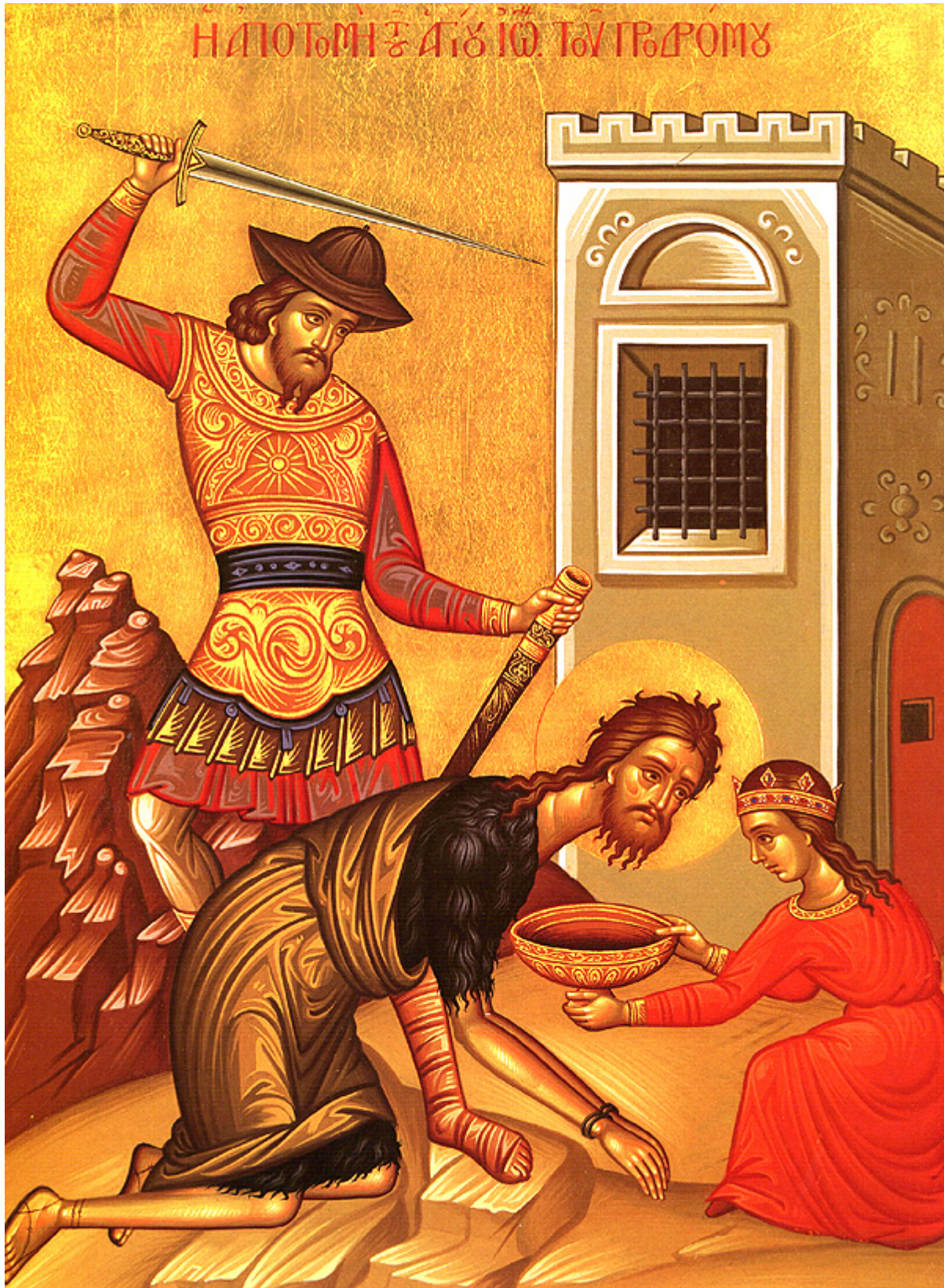
Ἡ Αποτομή της Τιμίας Κεφαλῆς του Αγίου Ιωάννου του Προδρόμου

Εορτάζει στις 29 Αυγούστου εκάστου έτους.