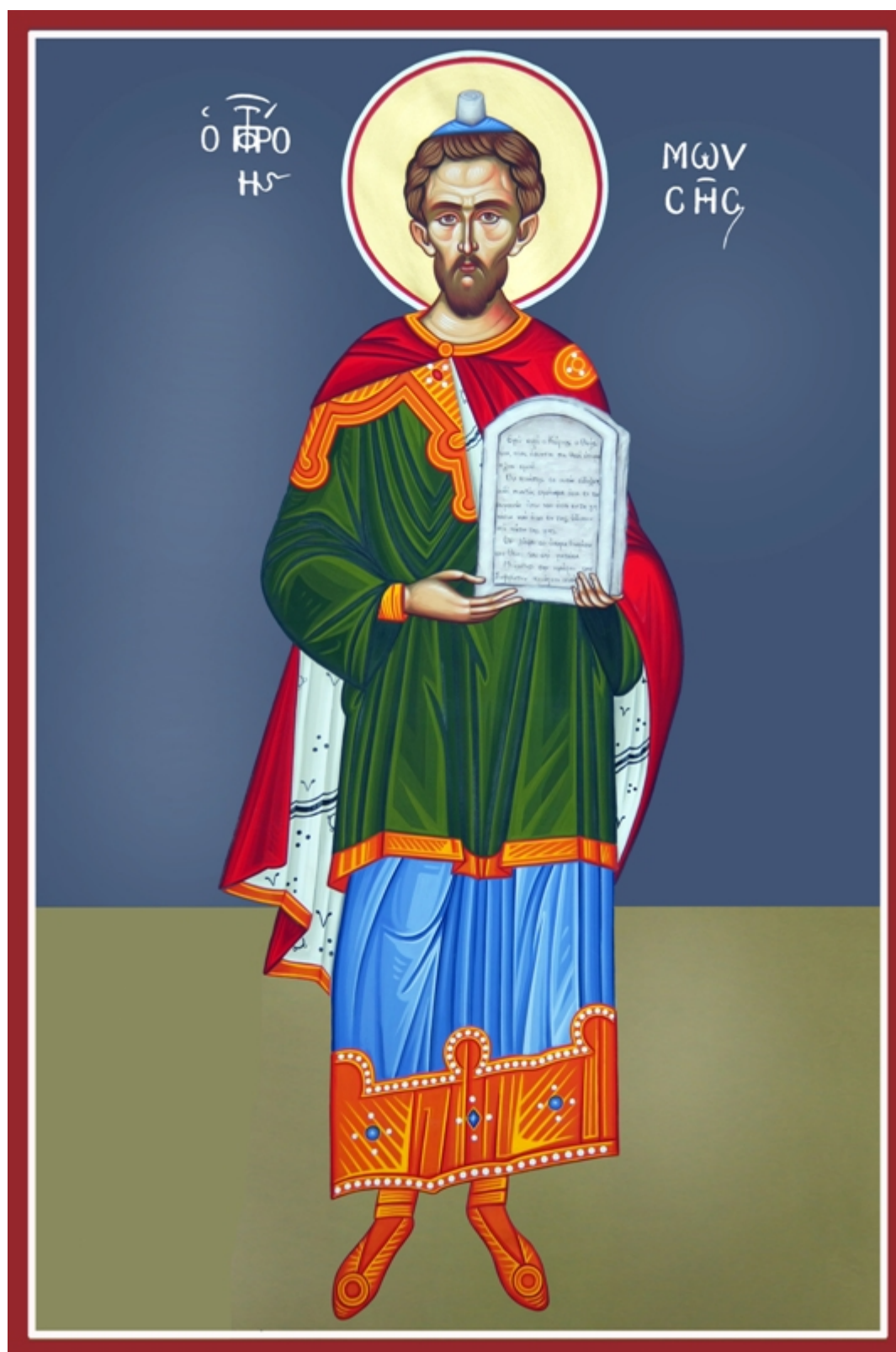
Προφήτης Μωσής ο Θεόπητος - Καζακίδου Μαρία© (byzantineartkazakidou.blogspot.com)