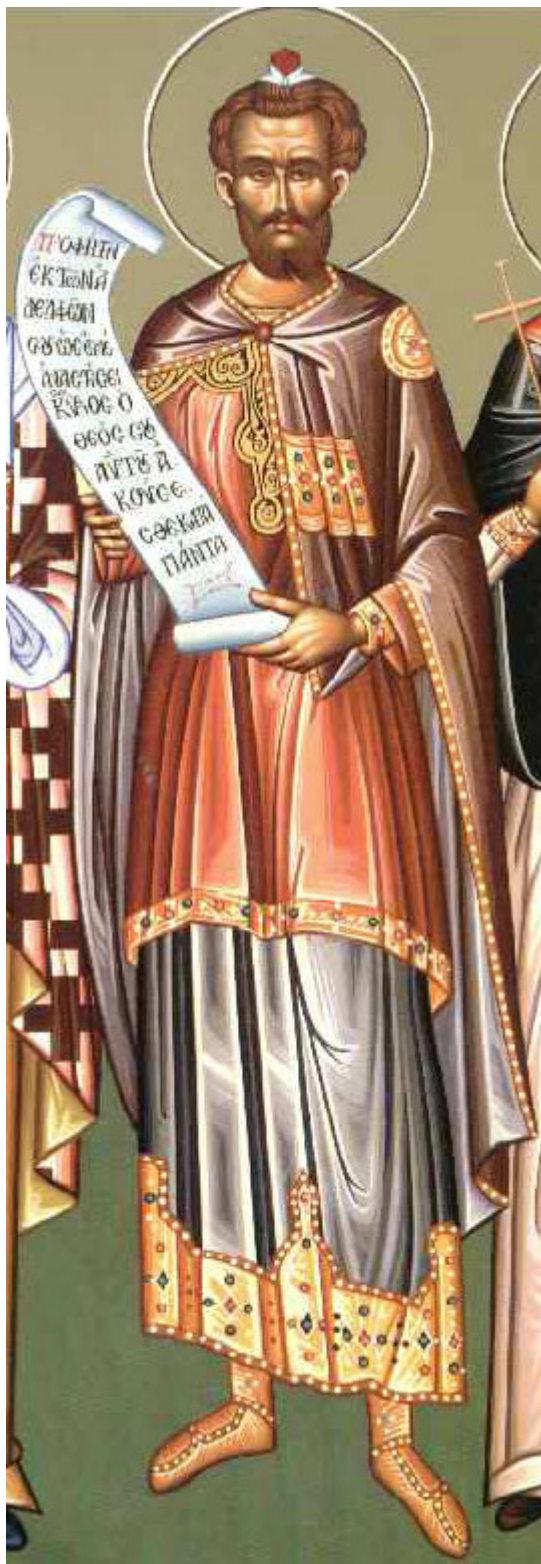
Προφήτης Μωυσής ο Θεόπτης