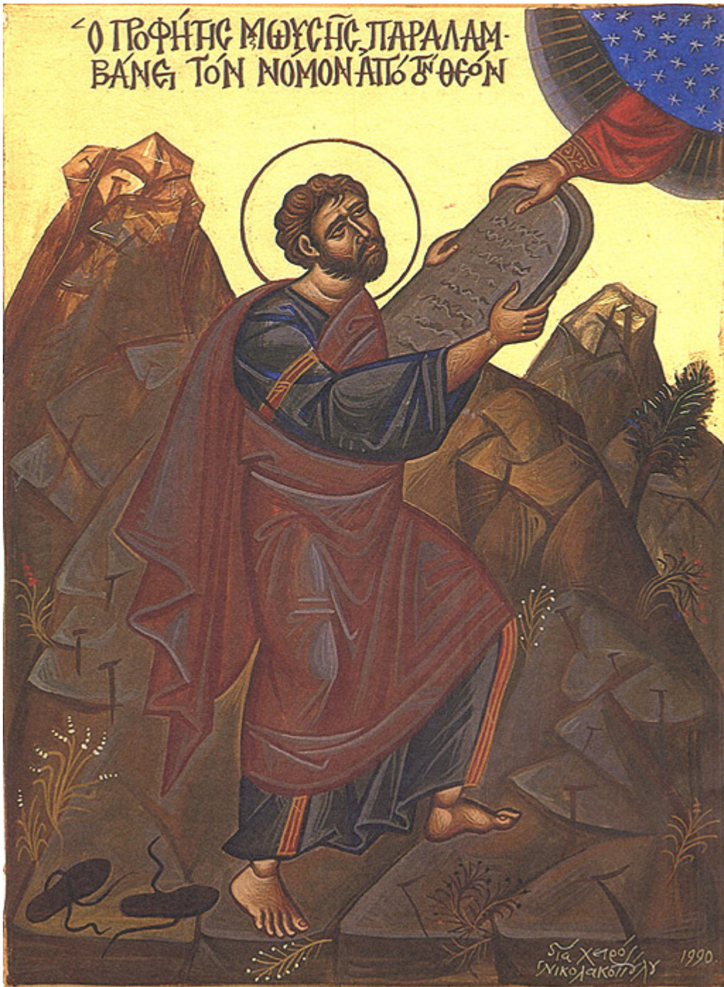
Προφήτης Μωυσής ο Θεόπτης

Εορτάζει στις 4 Σεπτεμβρίου εκάστου έτους.