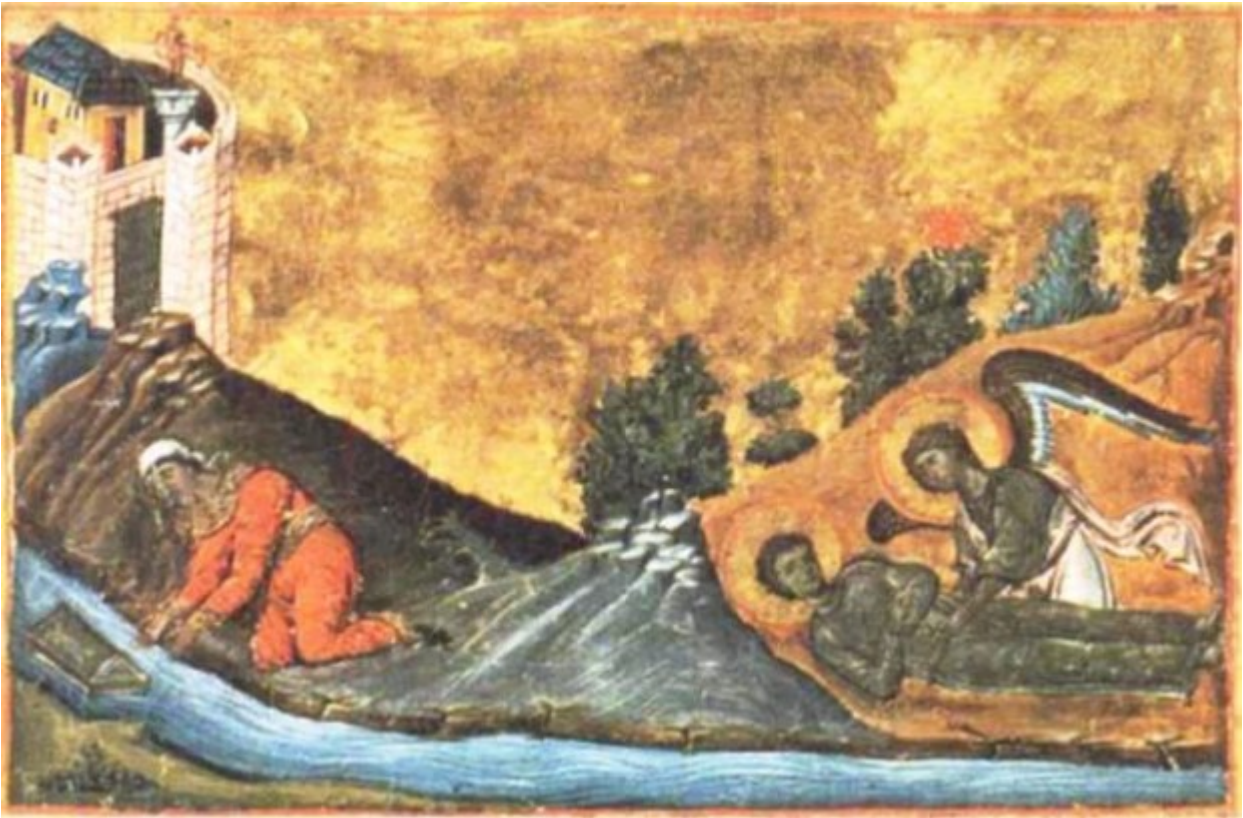
Προφήτης Μωυσής ο Θεόπτης