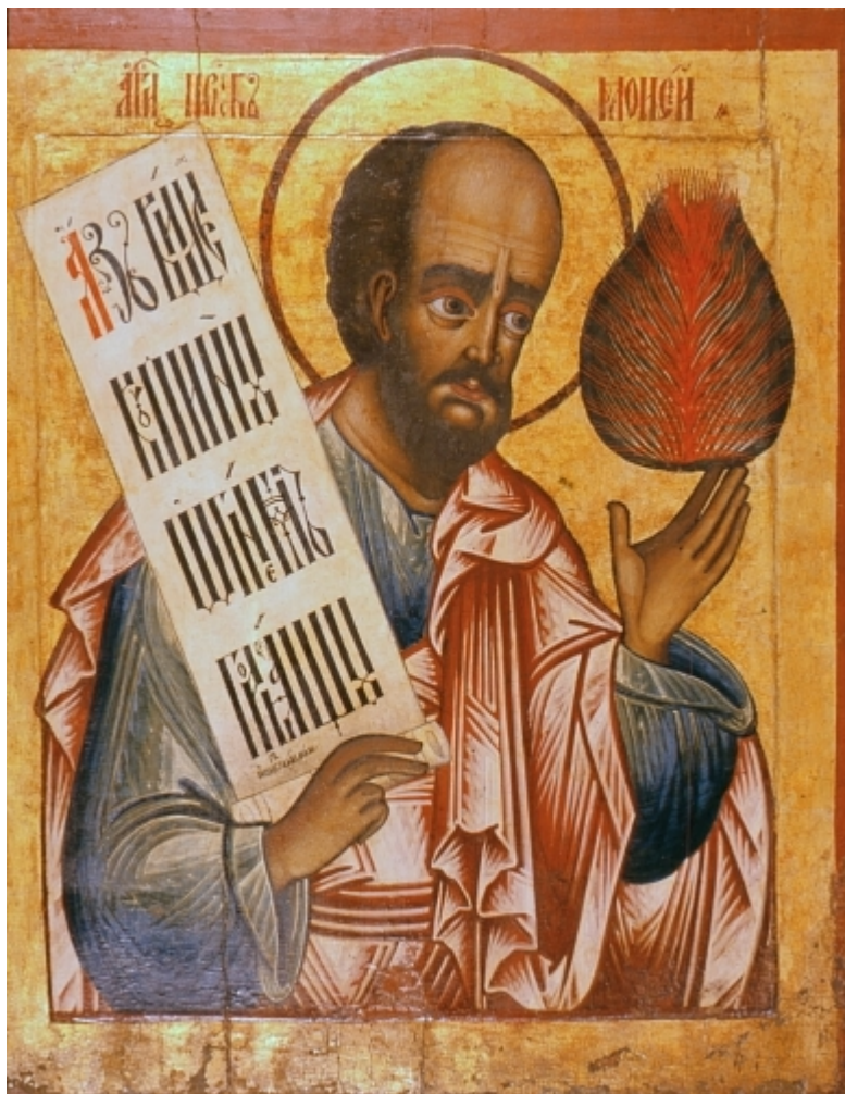
Προφήτης Μωυσής ο Θεόπτης