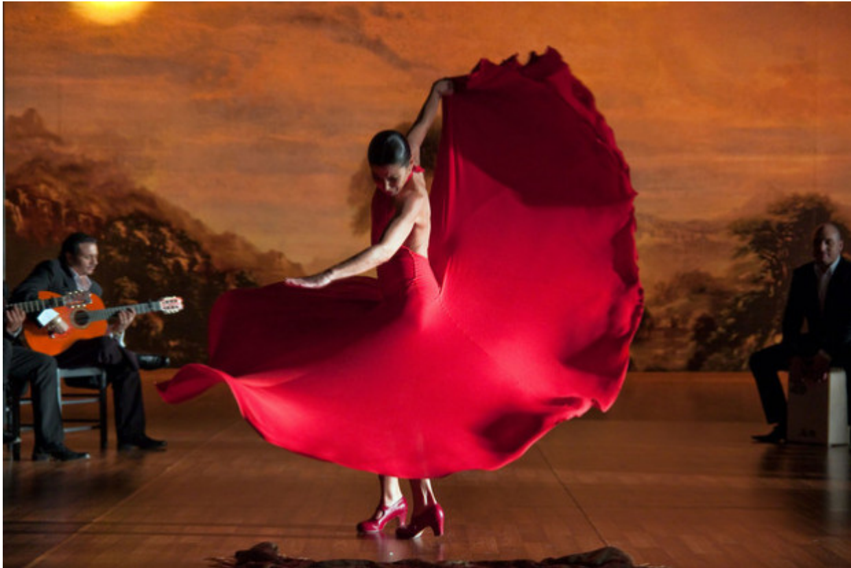
Sara Baras Medusa

Γιούρι Γκριγκορόβιτς, Μάγια Πλισέτσαγια και Σάρα Μπάρας δίνουν ραντεβού στο ωδείο της Διονυσίου Αρεοπαγίτου.