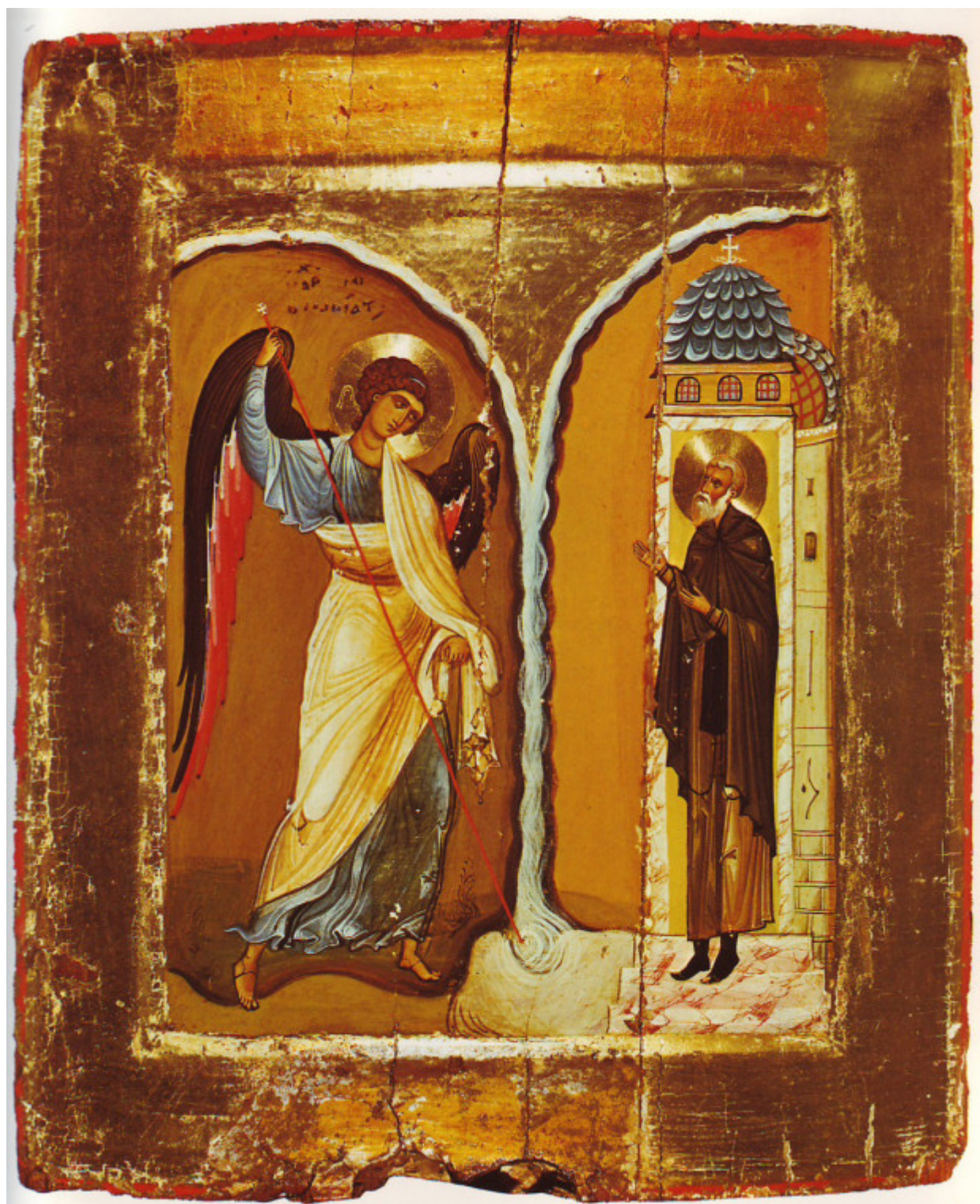
Το θαύμα του Αρχαγγέλου Μιχαήλ στις Χωναίς (ή Κολασσαίς) - α' μισό 12ου αι. μ.Χ.