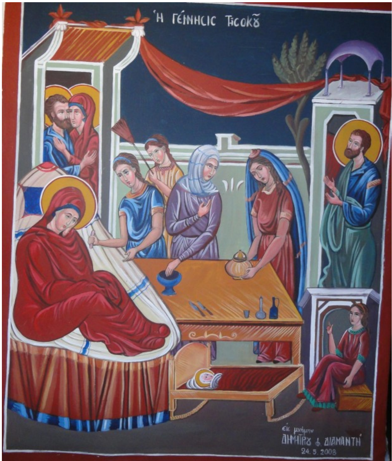
Γέννηση της Υπεραγίας Θεοτόκου - Πηνελόπη Σχιζοδήμου© (www.porpe.gr)