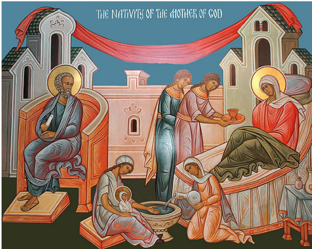
Γέννηση της Υπεραγίας Θεοτόκου

Εορτάζει στις 8 Σεπτεμβρίου εκάστου έτους.