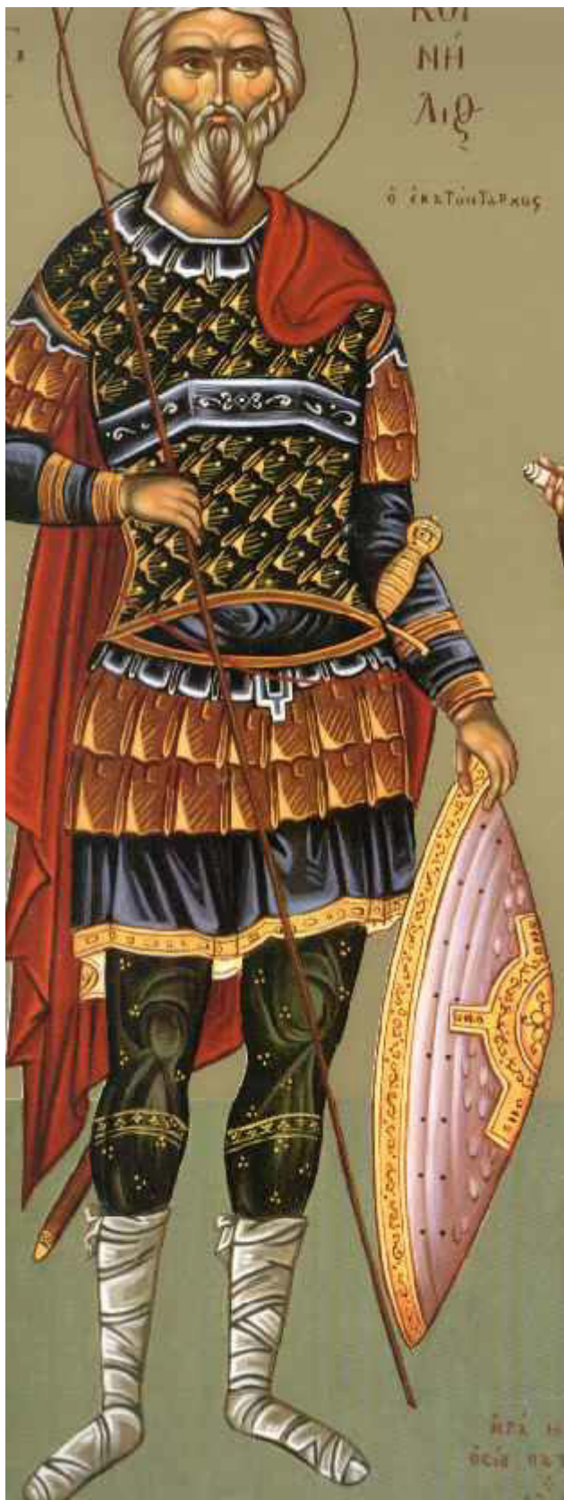
Άγιος Κορνήλιος ο Εκατόνταρχος