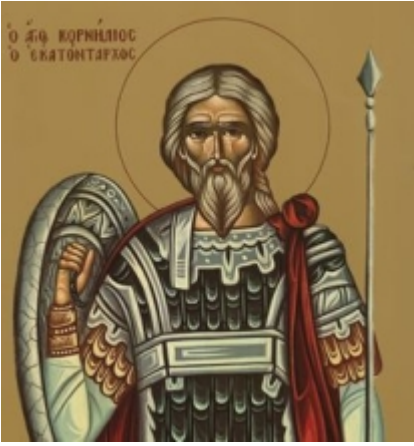
Άγιος Κορνήλιος ο Εκατόνταρχος