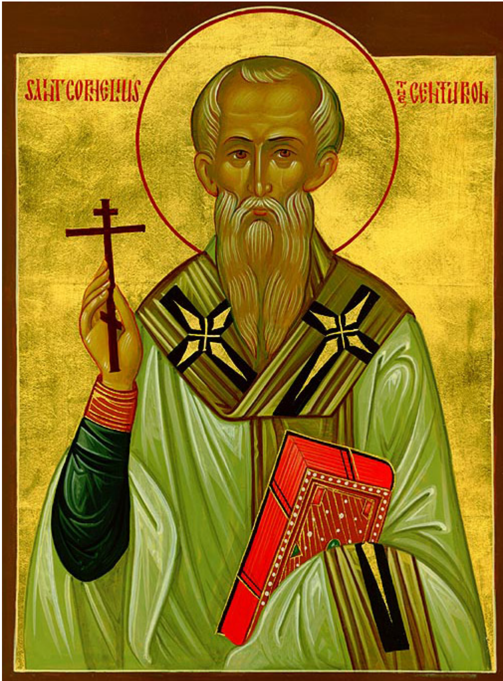
Άγιος Κορνήλιος ο Εκατόνταρχος