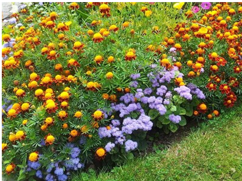
Αγήρατο και Κατιφές

Ωστόσο, ένας κήπος δεν μπορεί να είναι μονότονος και μονόχρωμος. Έτσι αν έχετε γωνιές, παρτέρια, γλάστρες που θέλετε να προσθέσετε λίγο χρώμα, υπάρχουν ανθοφόρα φυτά που έχουν αντικουνουπική δράση. Ο κατιφές, το αγήρατο, η καλέντουλα, το γεράνι, το νυχτολούλουδο είναι μερικά όμορφα ποώδη φυτά με μεγάλη διάρκεια ανθοφορίας.