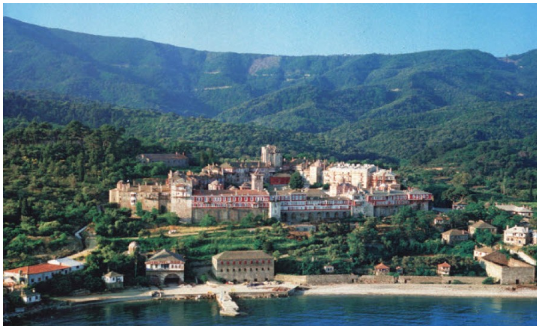
Ιερά Μεγίστη Μονή Βατοπαιδίου