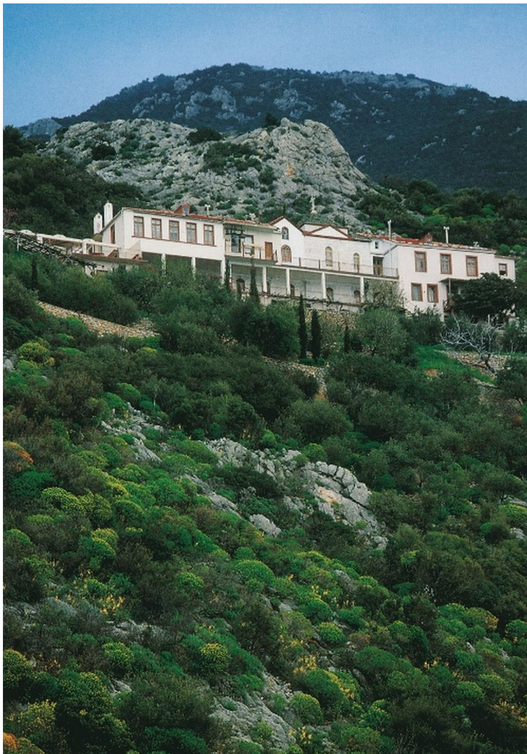
Το 1881 ο Γέροντας Δανιήλ έστησε στα Κατουνάκια την καλύβη του, η οποία υπήρξε το θεμέλιο για το σημερινό ησυχαστήριο της αδελφότητας των Δανηλαίων. Στην φωτογραφία άποψη του ησυχαστηρίου.

Ήδη ενώ ζούσε ακόμη στην λιτή και πενιχρή στην αρχή καλύβη του, διευρυμένη αργότερα για να φιλοξενεί τους διερχόμενους προσκυνητές, είχε επιβληθεί στην συνείδηση των Αγιορειτών Πατέρων ως κανών και γνώμων Ορθοδοξίας, ως ασφαλές κριτήριο για την διάγνωση των πλανών με τις όποιες ο «δολομήτης Σατάν», όπως έλεγε, παρέσυρε και προχωρημένους ακόμη μοναχούς. Κατέληξε να