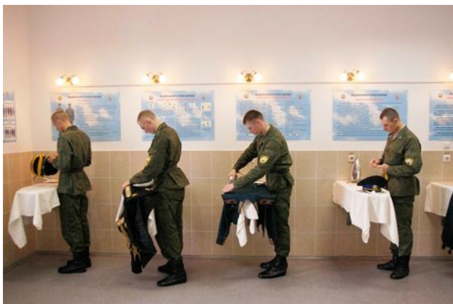
Πηγή: Νικολάι Κορολιόφ