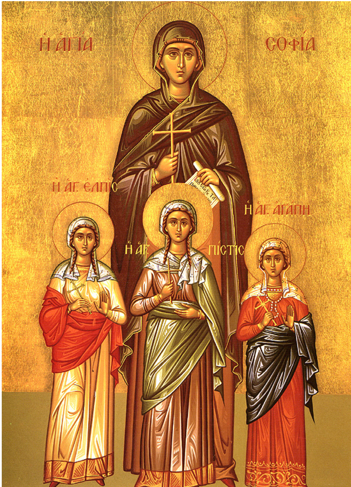
Αγία Σοφία και οι τρεις θυγατέρες της Πίστη, Ελπίδα και Αγάπη