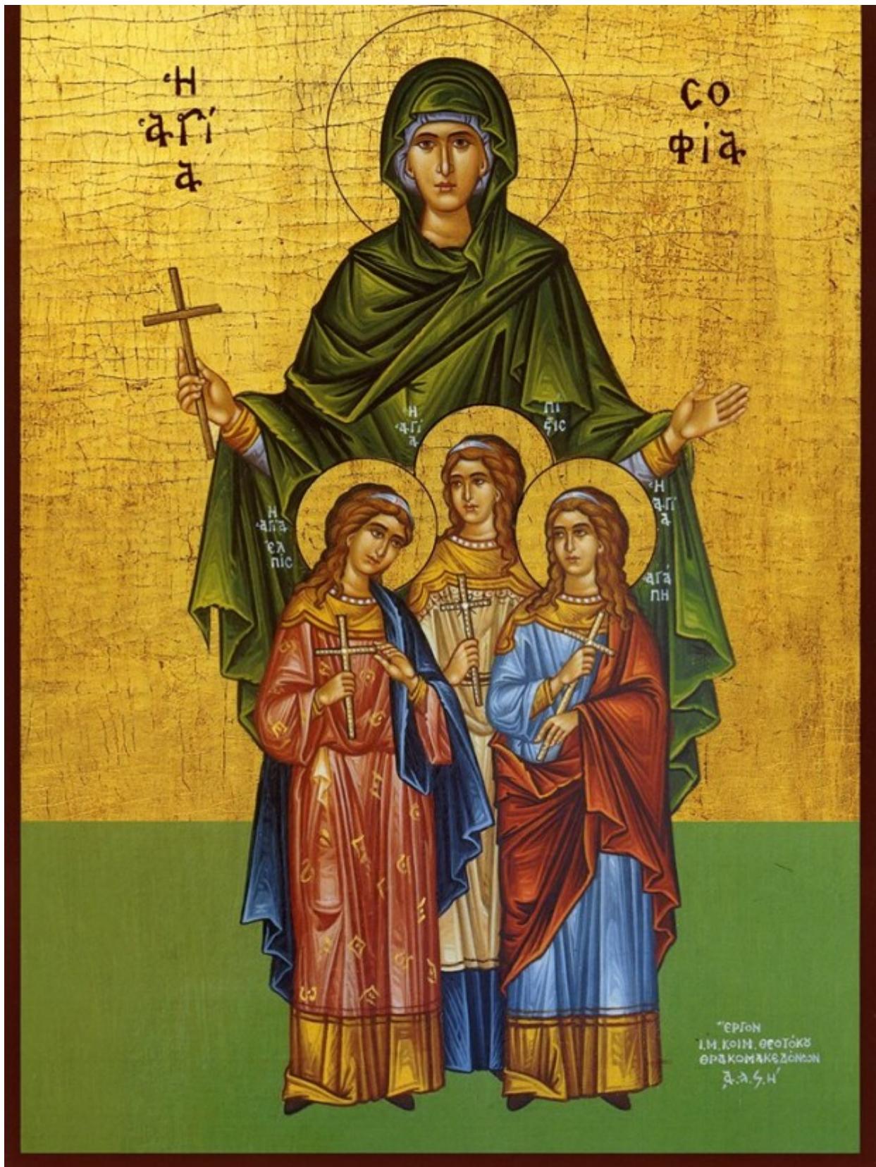
Αγία Σοφία και οι τρεις θυγατέρες της Πίστη, Ελπίδα και Αγάπη

Εορτάζει στις 17 Σεπτεμβρίου εκάστου έτους.