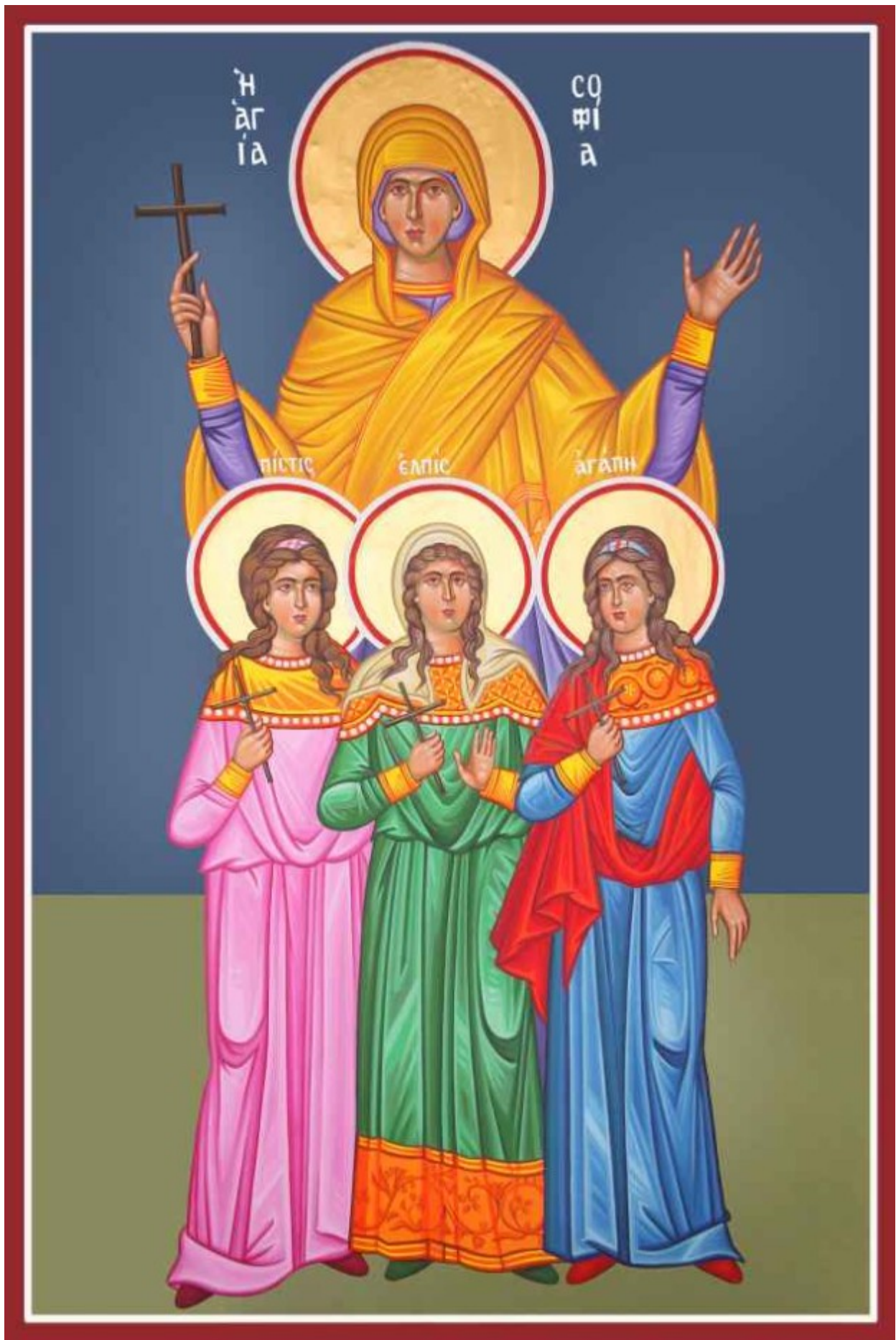
Αγία Σοφία και οι τρεις θυγατέρες της Πίστη, Ελπίδα και Αγάπη - Καζακίδου Μαρία©