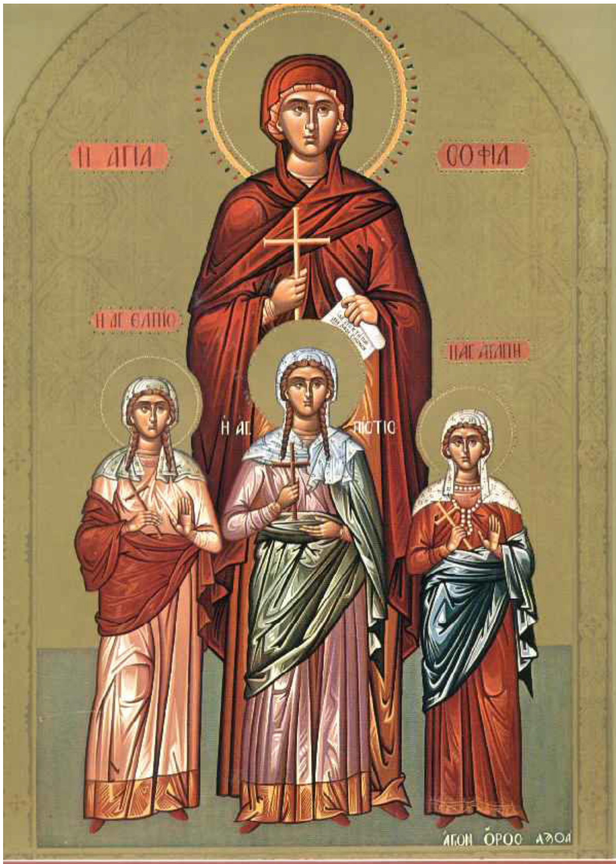
Αγία Σοφία και οι τρεις θυγατέρες της Πίστη, Ελπίδα και Αγάπη