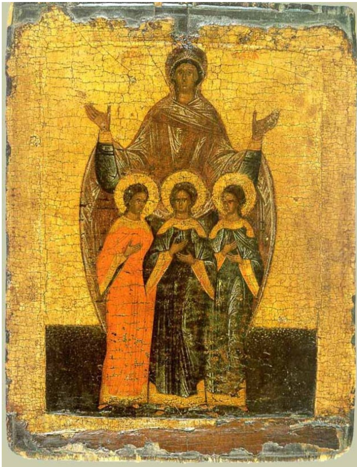
Αγία Σοφία και οι τρεις θυγατέρες της Πίστη, Ελπίδα και Αγάπη