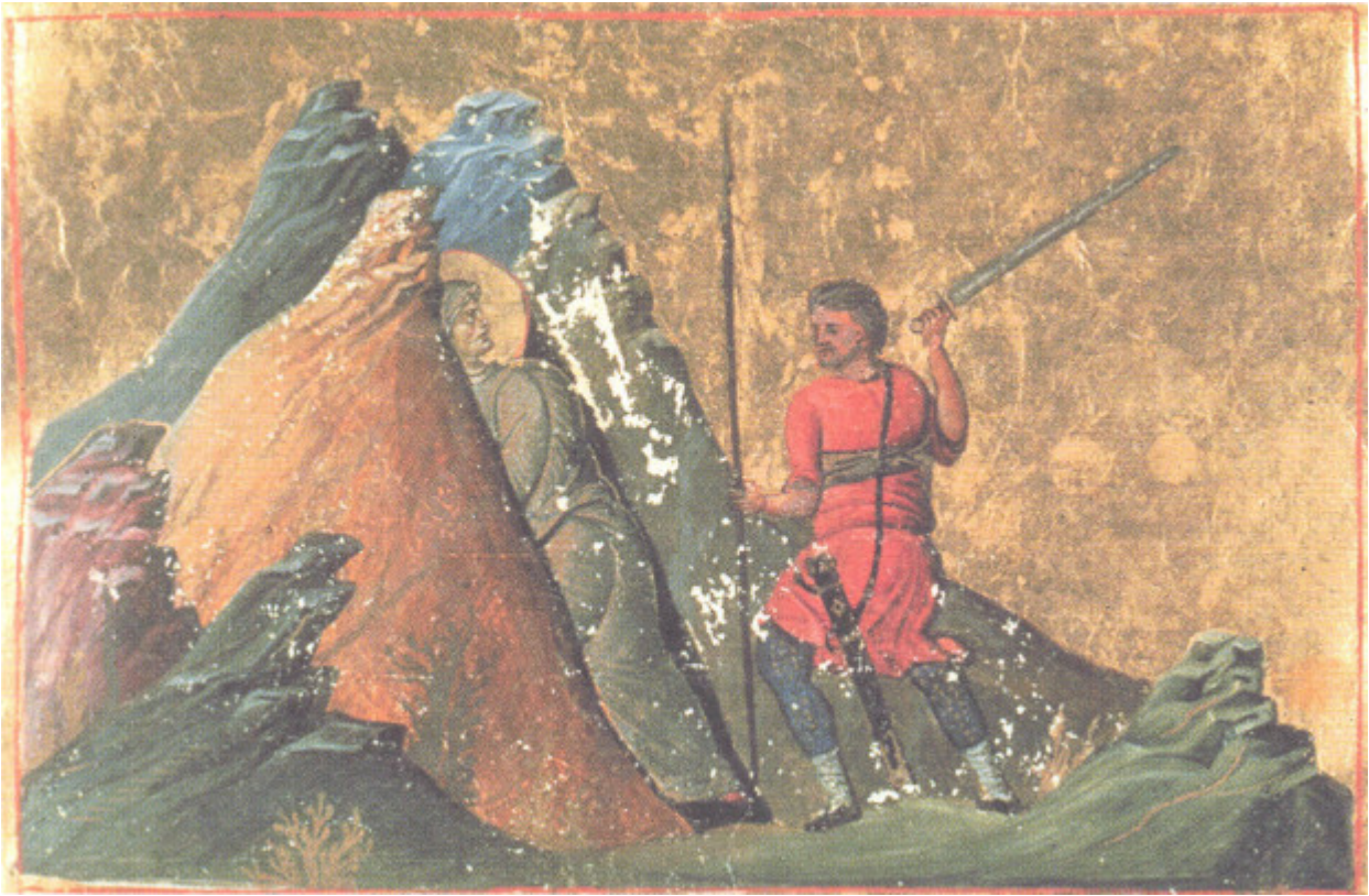
Αγία Αριάδνη - Μηνολόγιον Βασιλείου Β΄, φ. 48 (11ος αι.)