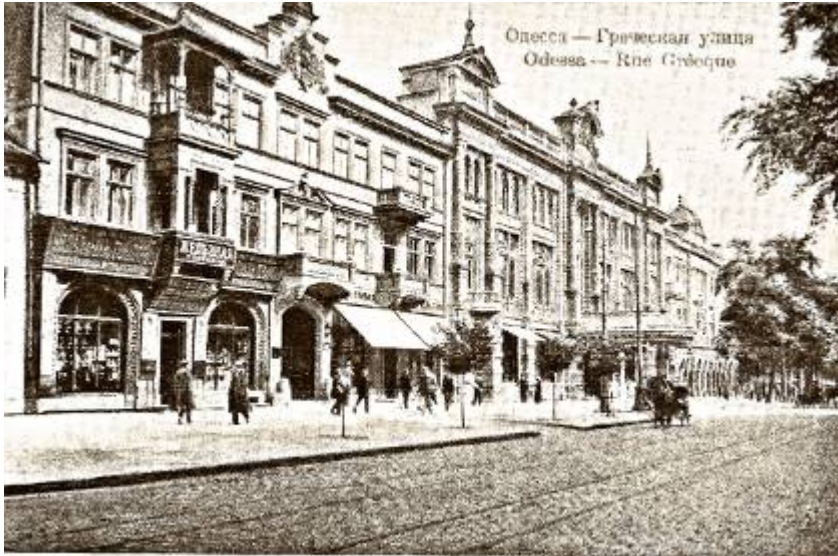
Η Οδησός οφείλει πολλά στον εθνικό μας ευεργέτη και μαικήνα Γρηγόριο Μαρασλή

Κτισμένη με βάση τα πρότυπα του ευρωπαϊκού νεοκλασικισμού, με τη βοήθεια του πρώτου κυβερνήτη της, Γάλλου δούκα Ρισελιέ (1803-1814), η Οδησός, χάρη στη γεωγραφική της θέση στις εκβολές του Δνεϊστερου στον Εύξεινο Πόντο, δεν άργησε να γίνει το δεύτερο μεγάλο λιμάνι, μετά την Αγία Πετρούπολη, και η τρίτη σε πληθυσμό πόλη της Ρωσίας. Σημαντικότερο ρόλο στην οικοδόμηση της πόλης έπαιξαν οι Έλληνες πάροικοι και οι ελληνικής καταγωγής εγκατεστημένοι στην πόλη μεγαλέμποροι.