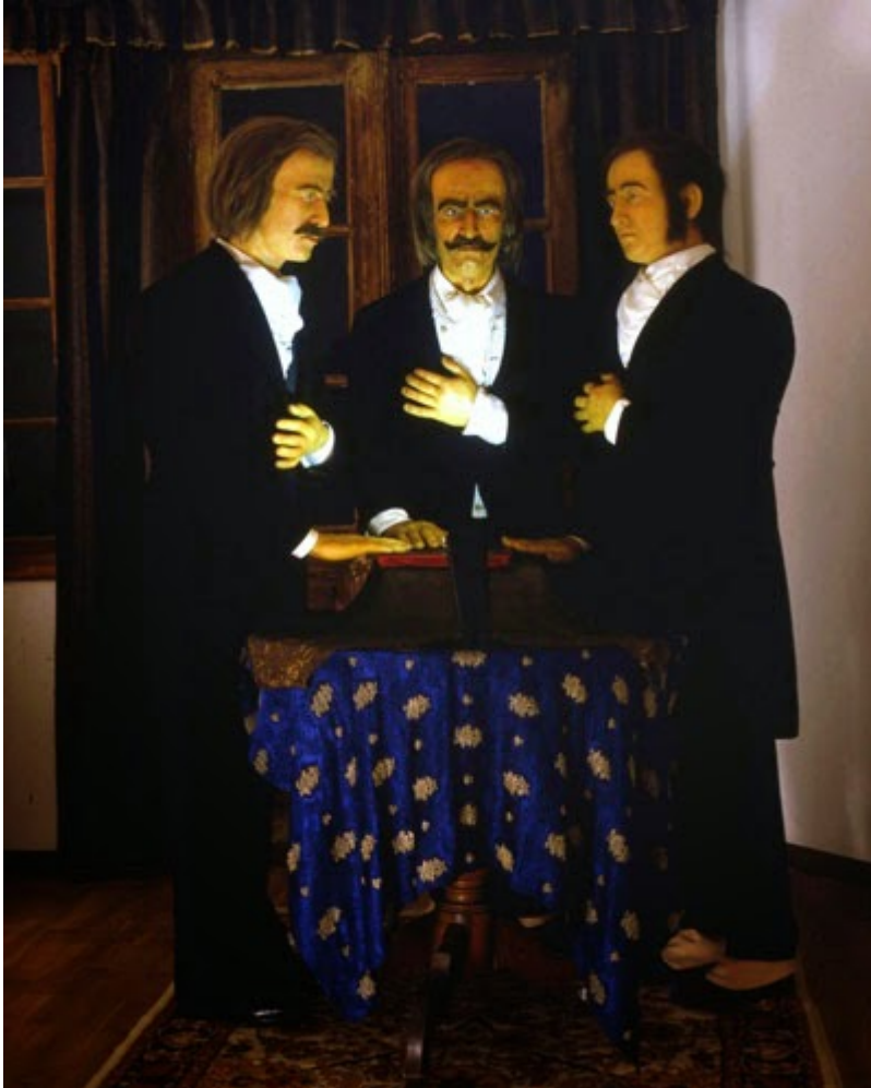
εικ. «Σκουφάς, Τσακάλωφ και Ξάνθος ορκίζονται, Η ίδρυση της Φιλικής Εταιρείας (μουσείο κέρινων ομοιωμάτων Π. Βρέλλη)»

1814-2014: 200 Χρόνια από την Ίδρυση της Φιλικής Εταιρείας Επιμέλεια Αφιερώματος: Σοφία Ντρέκου/Αέναη επΑνάσταση