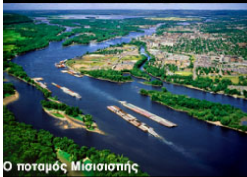
Ο ποταμός Μίσισιπής