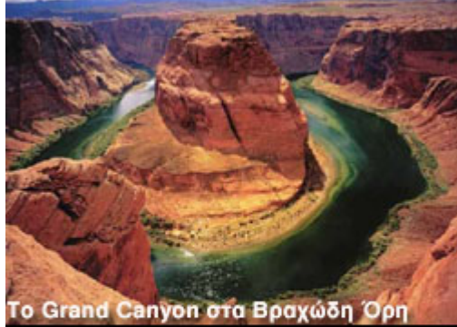
Το Grand Canyon στα Βραχώδη Όρη