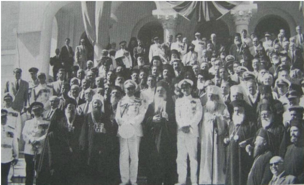
Το έτος 1963 εις τον ΑΘΩ εορτάσθη με μεγαλοπρέπεια η χιλιετηρίδα του Αγίου Όρους, χίλια χρόνια από την ίδρυσιν της Μεγίστης Λαύρας. Τότε εγένετο εις Αγιον Όρος η επίσκεψις του Οικουμενικού Πατριάρχου, κ.κ. Αθηναγόρα, του τότε Βασιλέως Παύλου, του διαδόχου Κωνσταντίνου, και η εκ περάτων σύναξις της Οικουμενικής Ορθοδοξίας.

ανάμεσα στις ψυχές. Επίστεψε ότι δεν υπάρχει απόσταση από άνθρωπο σε άνθρωπο, από βίωση σε βίωση. Έπλασε από την Επιστήμη μια θεότητα.