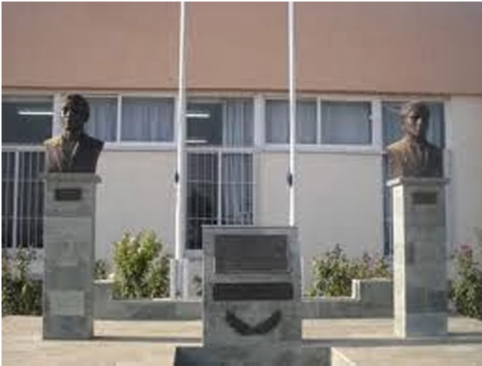
Οι ανδριάντες των ηρώων Ανδρέα Παναγίδη και Μιχαήλ Κουτσόφτα, έξω από το Λύκειο «Κουτσόφτα-Παναγίδη»

Θα ήθελα, πέρα από τα θερμότατα συγχαρητήρια για το εκλεκτό κείμενο, να εκφράσω και τις άπειρες ευχαριστίες μου προς τον κ. Χρίστο Ιακώβου που, σε μια εποχή αντιηρωική, «σε μια εποχή μαζικής παγκοσμιοποιημένης κουλτούρας και εθνομηδενισμού», όπως ομολογεί και ο ίδιος, αποφάσισε να ασχοληθεί με το θέμα ηρωισμός, αυτοθυσία, εθελούσια προσφορά της ζωής προς την πατρίδα, γενναιότητα, μεγαλείο ψυχής, ηθική, γενικά να μιλήσει για ήρωες και ηθικές αξίες, θυμίζοντάς μου τον Γιώργο Σεφέρη στο ποίημά του «Τελευταίος Σταθμός»: « να μιλήσω για ήρωες, να μιλήσω για ήρωες », τονίζοντας ποιος είναι ο πραγματικός ήρωας.