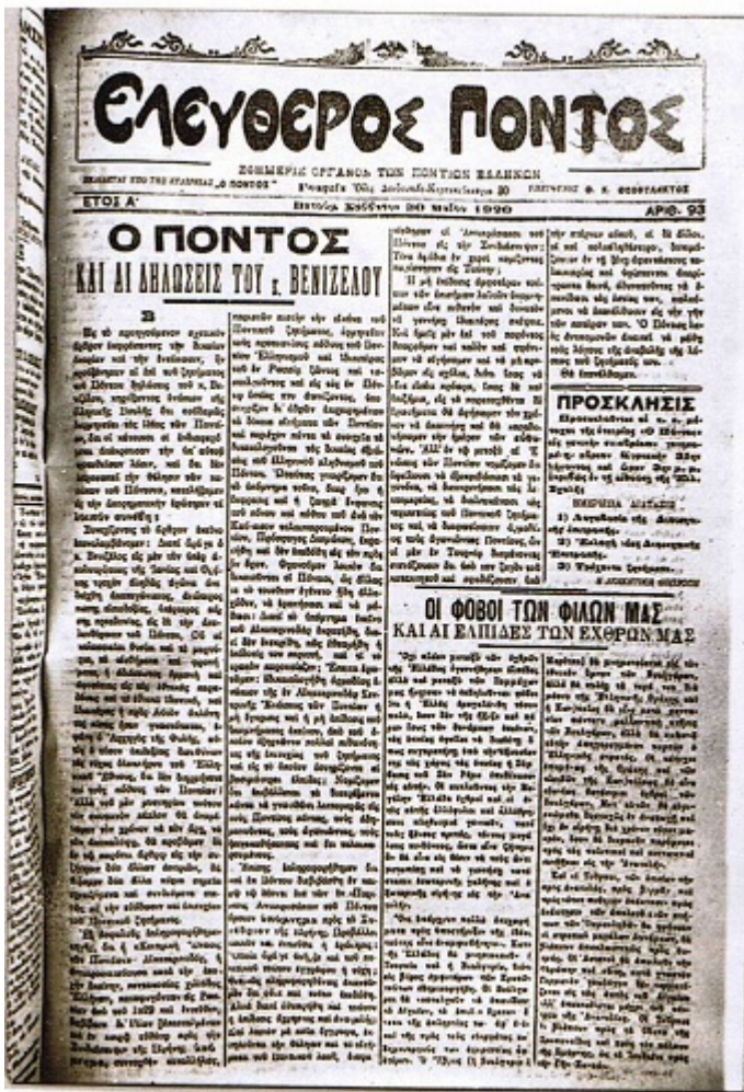
Οι εφημερίδες «Πόντος» και «Φάρος της Ανατολής» στις οποίες αρθρογραφούσε ο Καπετανίδης