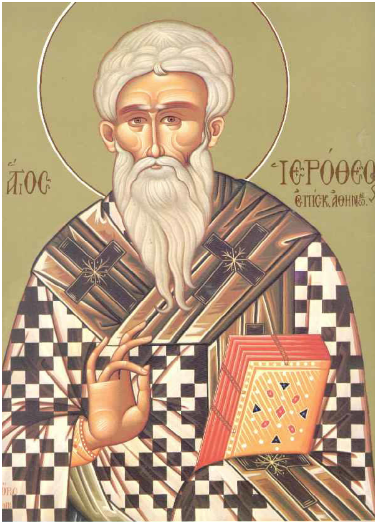
Άγιος Ιερόθεος Επίσκοπος Αθηνών