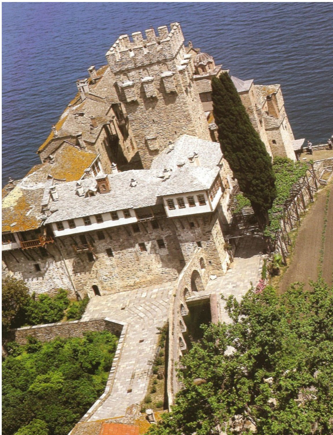
Η Ιερά Μονή Σταυρονικήτα. Πανοραμική άποψη.

Εκμεταλλεούμενος το ιδιόρρυθμο σύστημα της μέχρι τότε λειτουργούσης Μονής, προέβη σε σκληρούς και ανώτερους αγώνες.