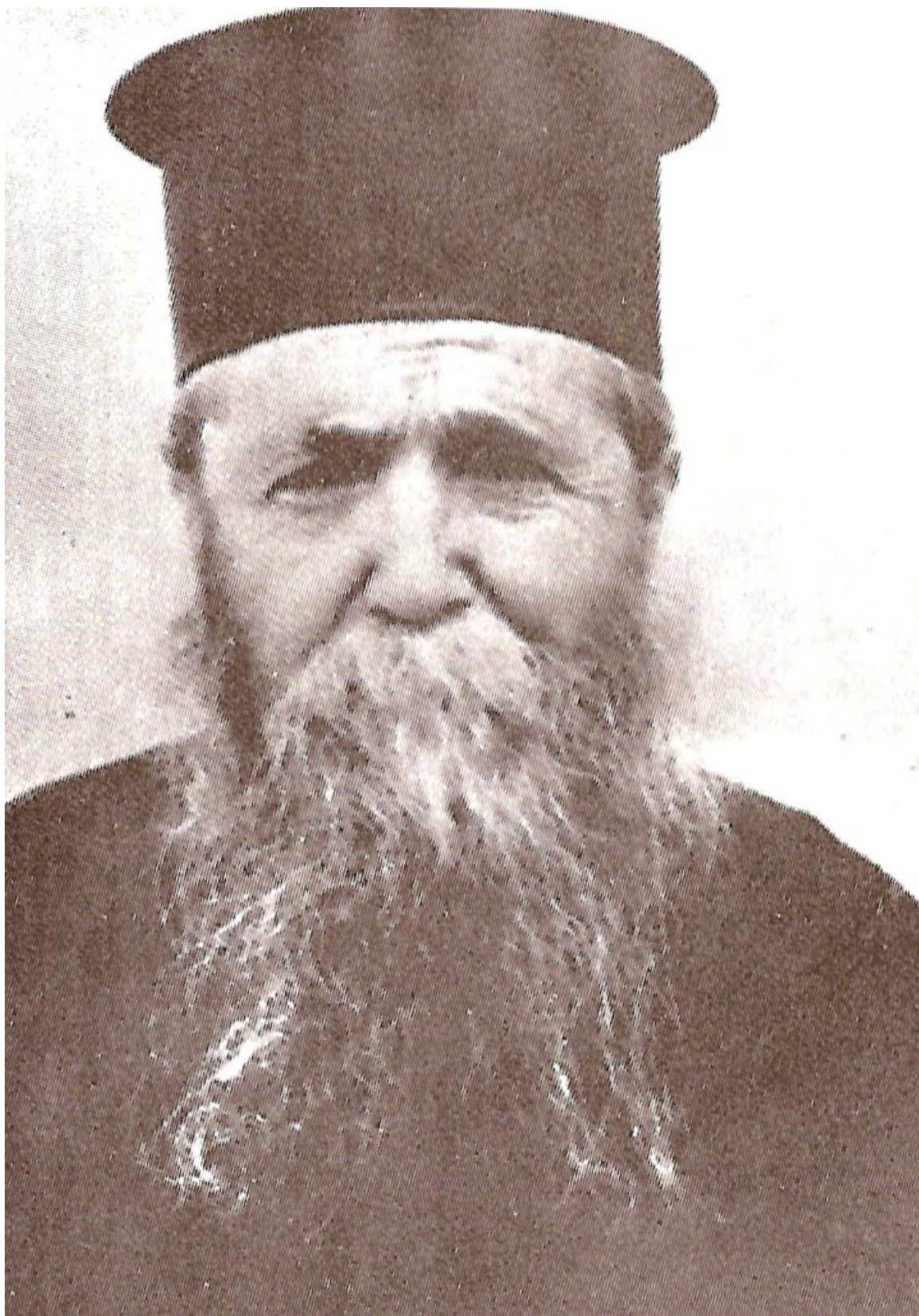
Ο μακαριστός Γέροντας Ιερώνυμος της Αίγινας, ο οποίος υπήρξε ο πρώτος εν Χριστώ διαδάσκαλος του μακαρίου Γέροντα Αρσένιου του Σπηλαιώτου και Ησυχαστού.