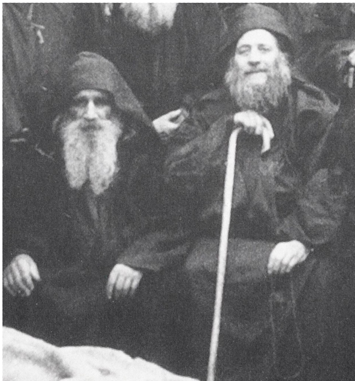
Ο μακάριοι Γέροντες Αρσένιος (αριστερά) και Ιωσήφ (δεξιά) οι Σπηλαιώτες και Ησυχαστές, οι για σαράντα χρόνια αχώριστοι συνασκητές. Λεπτομέρεια μεγαλύτερης φωτογραφίας.

Ο άλλος νέος ήταν ο μεγάλος μετέπειτα νηπτικός ασκητής του 20ου αιώνας Ιωσήφ ο Ησυχαστής, ο οποίος τότε με το λαϊκό του όνομα λεγόταν Φραγκίσκος Κώττης.