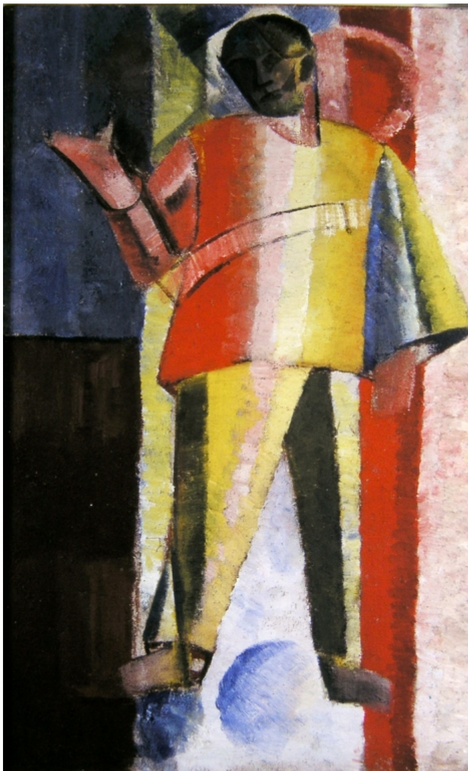
Αλεξέι Μοργκόνουφ Αεροπόρος, 1912-13 © ΚΜΣΤ Συλλογή Κωστάκη

Η έκθεση φιλοξενεί έργα τέχνης σε καμβά, γκούας και ακουαρέλες, αρχαικό υλικό, έγγραφα, φωτογραφίες, βιβλία, περιοδικά, μονογραφίες, αποκόμματα εφημερίδων, από το αρχείο Κωστάκη, καθώς και μια ομάδα σχεδίων κωνστροκτιβιστικής αρχιτεκτονικής. Τα έργα παρουσιάζονται με εγκυκλοπαιδικό-εκπαιδευτικό τρόπο. Αντιπροσωπεύουν όλα τα μεγάλα κινήματα της περιόδου (από τον Νεο-Ιμπρεσιονισμό και τον Συμβολισμό, στον Κυβοφουτουρισμό,