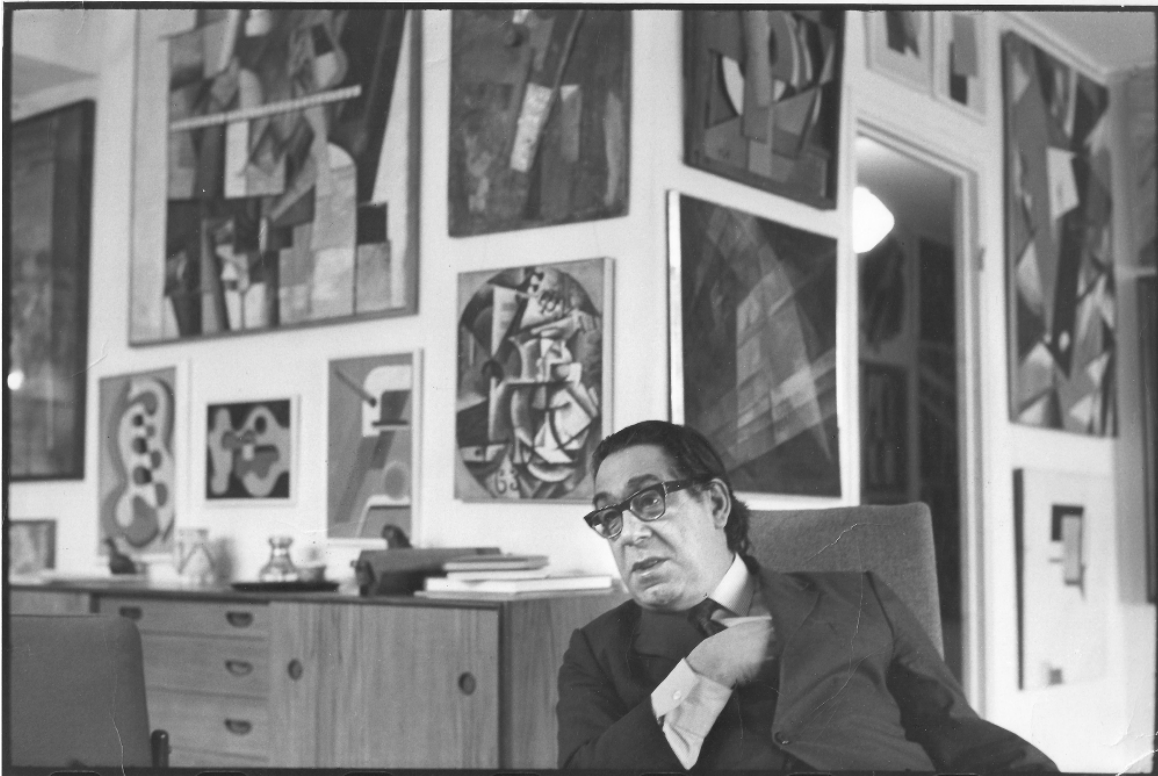
Πορτραίτο του Γιώργου Κωστάκη. Μέσα δεκ. '70.

Ο Γιώργος Κωστάκης γεννήθηκε στη Μόσχα το 1913 σε ελληνική οικογένεια. Εργάστηκε ως οδηγός στην ελληνική πρεσβεία μέχρι το 1940 και μετά τον 2ο Παγκόσμιο Πόλεμο άρχισε να εργάζεται ως προϊστάμενος τοπικού προσωπικού στην καναδική πρεσβεία. Το 1946 άρχισε να συλλέγει μεθοδικά έργα ρωσικής και σοβιετικής πειραματικής τέχνης από τις αρχές του 20ού αιώνα έως τη δεκαετία του 1930, με αποτέλεσμα να περισώσει από την καταστροφή αυτό το ζωτικής σημασίας κεφάλαιο στην ιστορία της τέχνης.